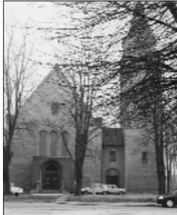
Kostel sv. Antonína Paduánského v Kunčičkách.