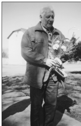
Pan starosta pokládá k pomníku květiny.

Po dohodě s vedením městského obvodu Slezská Ostrava bylo rozhodnuto, že obnova a následná údržba tohoto památníku budou provedeny na náklady úřadu. Objevily se však nečekané problémy. Pozemek, na kterém památník stojí, nepatří totiž městskému obvodu Slezská Ostrava, ale Pomocné škole v Kunčicích. Díky vstřícnému přístupu ředitelky této školy, Školského úřadu v Ostravě a majetkoprávního odboru ÚMOB Slezská Ostrava bylo dosaženo dohody o bezúplatné výpůjčce daného p o zemku. Jednoduché nebylo ani získání povolení na vykácení přerostlé zeleně. Nakonec odbor životního prostředí Magistrátu města Ostravy toto povole-