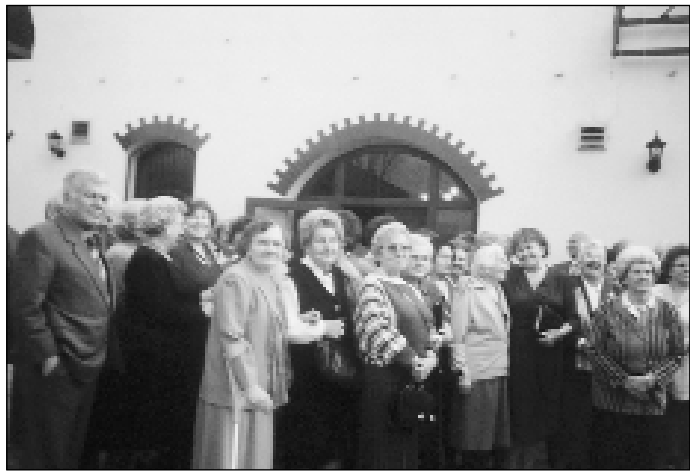
Foto ze setkání bývalých členů a příznivců Sokola v Kunčičkách

jichž zásluhou se činnost jednoty dále zdárně rozvíjela. Narůstal počet členů a cvičenců, prováděla se cvičení na nářadí i prostná, hrála se odbíjená i házená. V roce 1928 se činnost jednoty začala realizovat ve spolkové sokolovně (bývalý hostinec U Nachrů). Tragické období nastalo pro spolek v době 2. světové války. Na základě rozhodnutí policejního ředitelství v Moravské Ostravě byla dnem