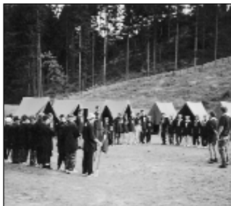
Ilustrační foto z letního stanového tábora.

le a jeho činnosti podá ing. Petr Holuša na tel. č. 568 37 72 nebo 568 35 21, případně 0603 59 49 70.