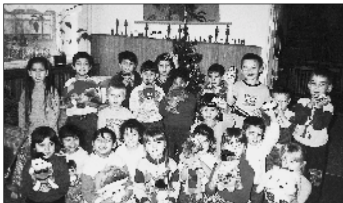
Děti z MŠ na Liščině měly z nových hraček radost

v jehož rámci navštěvovaly romské děti a děti ze sociálně slabších rodin plavecký výcvik a školka získala nové pomůcky a hračky.