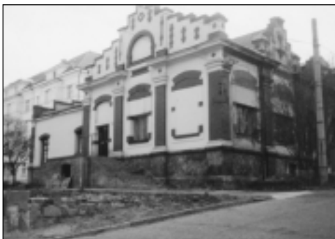
Bývalá budova elektrárny u Gagarinova náměstí