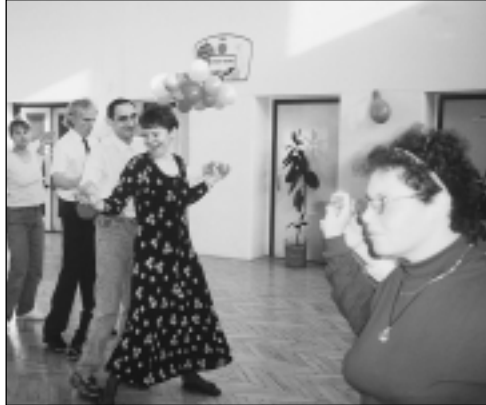
Z tanečních hodin v ÚSP