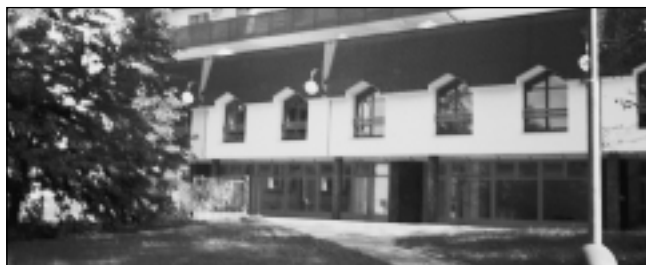
Prodejnu najdete v přízemí této budovy

OTEVÍRACÍ DOBA: pondělí – pátek od 9.00 do 17.00 hodin