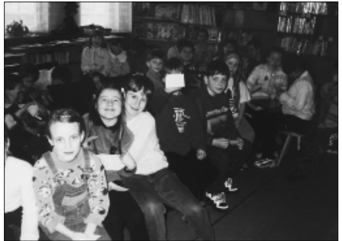
Ilustrační foto z loňského Dne čtenářů.

Formulář je rovněž zveřejněn na webových stránkách města Ostravy www.mno.cz .