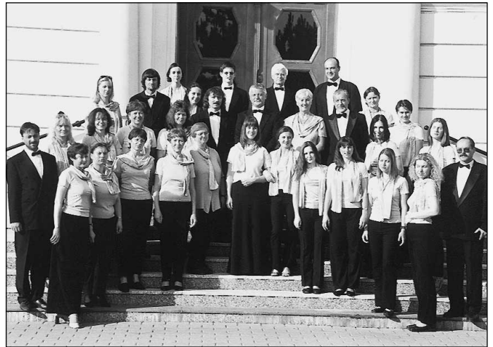
Pěvecké sdružení Slezská Ostrava před slezskoostrovskou radnicí