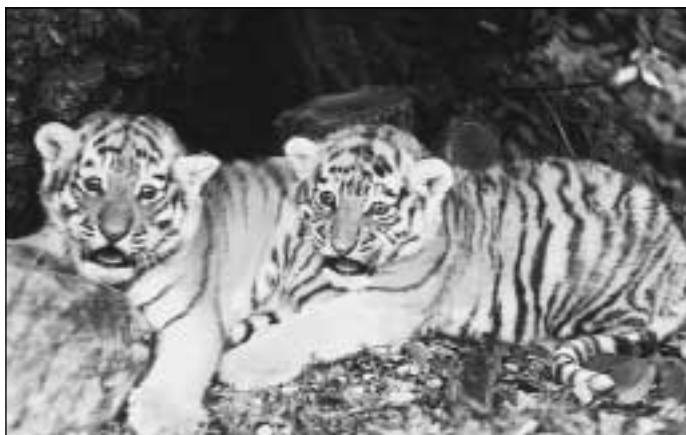
Dvě tygří mláďata.