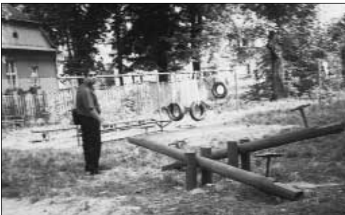
Ladislav Koky u jednoho z hracích koutků

výši 15 000 Kč pro Společenství Romů na Moravě, jež zařadilo akci zřízení dětských koutků ve výše uvedené lokalitě. Jeden z členů této organizace – Josef Tancoš-nakoupil s panem Kokym za přidělené prostředky potřebný materiál a ve svém volném čase začal vyrábět s nesmírnou zručností 6 laviček a 6 houpaček. Ty pak s pomocí místních obyvatel instaloval na vybraná místa. Všem, kteří se na této záslužné akci podíleli, náleží poděkování.