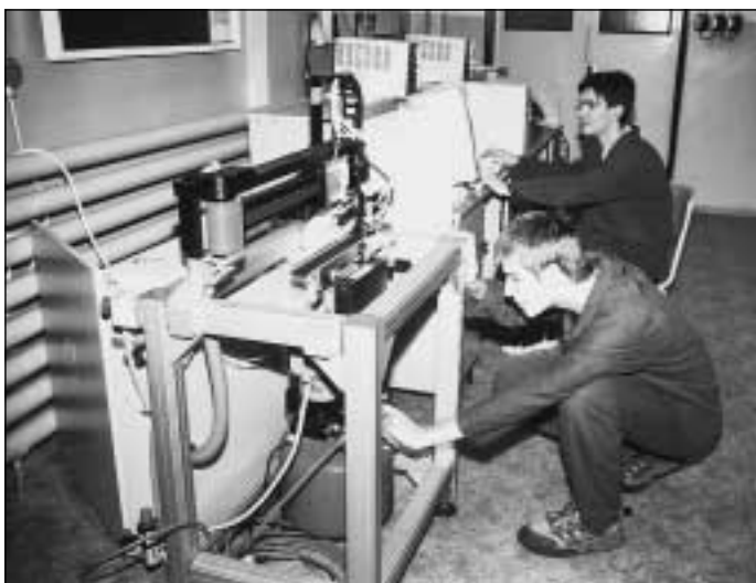
Ilustrační foto: Stanislav Drozd

Stanislav Drozd, SOŠ a SOU Ostrava-Kunčice