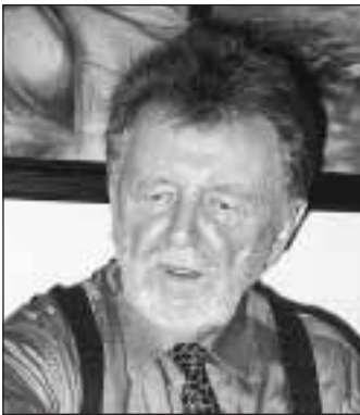
Doktor filozofie Bořivoj Čelovský

Narodil se 8. září 1923 v Heřmanicích. Gymnázium studoval před válkou v Moravské Ostravě a maturoval v Ostravě – Přívoze v roce 1942. Pak pobýval v Německé říši na nucených pracích a byl činný v protiletectvé službě. Po válce začal v Praze studovat práva. Pracoval rovněž jako knihovník Zemského archivu v Opavě a podílel se na vzniku Slezského ústavu. Právě na stránkách ústavního časopisu Slezský sborník začal svou životní dráhu historika. Jako rozhodný odpůrce totalitních režimů se nehodlal smířit s politickým vývojem v Československu a krátce po komunistickém puči v roce 1948 odešel do exilu. Pobýval v Německu, Francii a Rakousku, až získal v roce 1950 stipendium na francouzské univerzitě v Montrealu, kde studoval moderní historii. Ve studiích pokračoval na univerzitě v Heidelbergu, kde v roce 1954 promoval na doktora filozofie (získal mezinárodní titul PhD.) prací o mnichovské dohodě, jejíž německé vydání mělo celosvětový ohlas. Objektivní vyličení mnichovských událostí a jejich pozadí vyvolalo kritiku jak v kruzích sudetoněmeckých vysídlenců, tak u domácího komunistického režimu i v části exilu, ale renomované světové časopisy knihu přivítaly. Po návratu do Kanady se stal úředníkem Statistického úřadu a Minister-