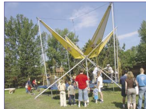
Velkou atrakcí byly bungy trampolíny.