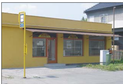
Rekonstruovaná prodejna v Antošovicích.

Ve Slezské Ostravě začneme v červnu s opravou kanalizace na Prokopské ulici, budeme pokračovat v realizaci probíhajících oprav Základní školy na Bohumínské ulici, zahájíme generální opravu Keltičkovy ulice. Koncem června začne velká oprava předsálí pro konání slavnostních občanských záležitostí v přízemí slezskoostravské radnice tak, aby se tento prostor stal důstojným místem pro prožití slavnostních životních chvil našich občanů. Nad naší radnicí pokračuje výstavba bytových domů a rodinných domků. Tato lokalita se stává jednou z nejžádanějších v Ostravě – tzv. ostravským Barrandovem, na což jsme samozřejmě velmi pyšní! Dále se připravuje studie a následně projekt zřízení výstav-