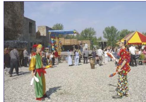
O zábavu se postarali i žongléři.

Tím ale program nebyl zdaleka vyčerpán, neboť v celém hradním areálu byly připraveny další atrakce – vyjížďky kočárem, jízda na koních a ponících, divadlo babky Miládky, vystoupení sokolníků, malování na obličej, kresba karikatur, balonková show. Nechyběla ani dětská olympiáda, pořádaná občanským sdružením YMCA, v jejímž rámci si děti vyzkoušely střelbu lukem, kterou jim umožnili lukostřelci