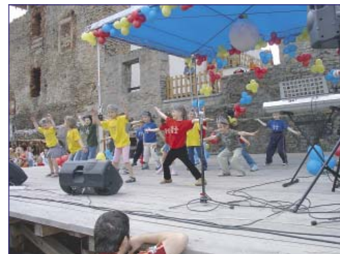
Na pódiu vystoupily i děti z mateřských škol.

Tím ale program nebyl zdaleka vyčerpán, neboť v celém hradním areálu byly připraveny další atrakce – vyjížďky kočárem, jízda na koních a ponících, divadlo babky Miládky, vystoupení sokolníků, malování na obličej, kresba karikatur, balonková show. Nechyběla ani dětská olympiáda, pořádaná občanským sdružením YMCA, v jejímž rámci si děti vyzkoušely střelbu lukem, kterou jim umožnili lukostřelci