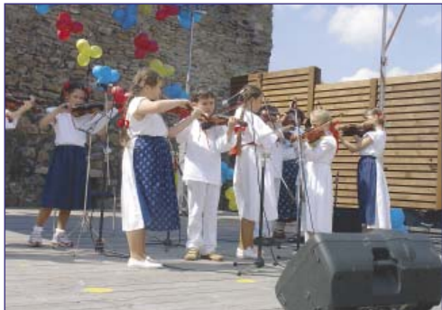
Přítomným zahráli žáci ZUŠ E. Runda.

pro různorodé akce pro děti a mládež, přičemž se výborně bavili i dospělí. Na pódiu postupně předvedly svá pásma písní, tanců a her děti z mateřských a základních škol z obvodu, žáci ZUŠ Edvarda Runda, dětský soubor Prievidza a pěvecký soubor Polonia a taneční soubory občanského sdružení Vzájemné soužití. Svými vy-