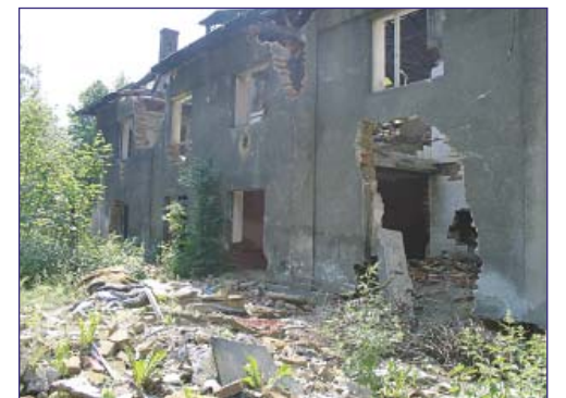
Zdevastovaný dům u Žalmanovy ulice v Hrušově.