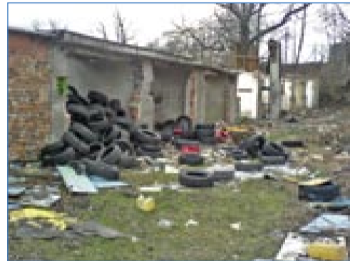
Devastované garáže u Šenovské ulice.

Z výše uvedeného vyplývá, že najít řešení je obtížné. Snad jednou z cest je to, že každý z vlastníků uvedených garáží dostatečně zabez-