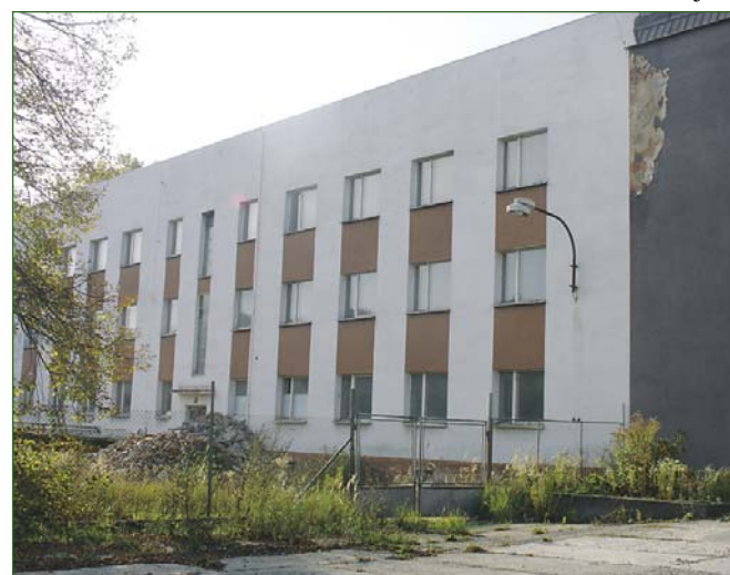
Foto jedné z budov budoucích kolejí před rekonstrukcí.