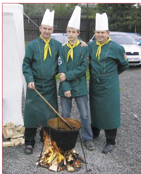
Ze soutěže ve vaření bigosu