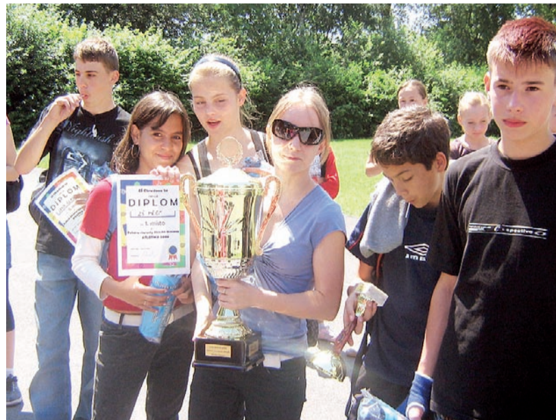
NEJLEPŠÍ / Putovní pohár si tentokrát odvezli žáci Základní školy Pěší.

Všichni účastníci sportovního dne byli odměněni sladkou odměnou a prozradili, že už se těší na další ročník, kdy to těm ostatním pořádně natřou.