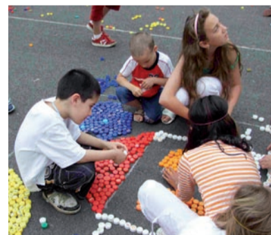
diskotékou. Domů odcházeli všichni účastníci spokojení a s dobrou náladou. (red)

stromů vyrobit slušivý kšilt. V připraveném stánku bylo možné zakoupit si drobné občerstvení. Mezitím se už rozhořel oheň a všude se začala rozlévat vůně pečených párků. Pak se všichni návštěvníci společně pustili do stavby velkých obrazců z vršků od PET lahví. Po chvíli se rozpoutal boj o stavební materiál, který mizel před očima. Stavěli malí i velcí a výsledek byl opravdu skvělý. Květina, domeček a duha zabraly téměř polovinu hřiště. Program byl završen