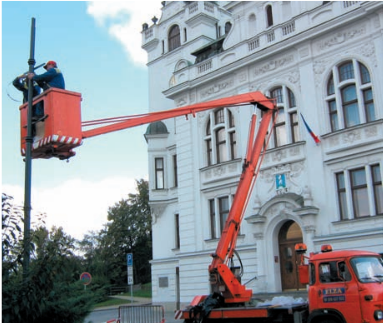
DOMINANTA IV NOCI. V těchto dnech by se měla radnice ve Slezské Ostravě konečně rozsvítit. Snímek zachycuje instalaci světla.