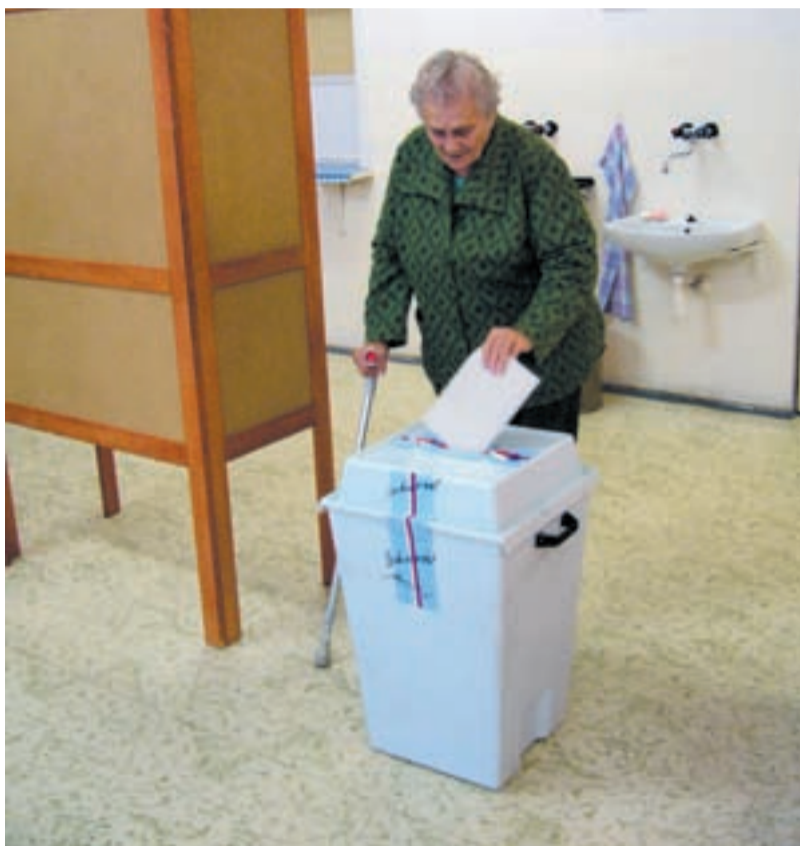
PRÁVO A POVINNOST. Slezskostravští občané volili ve 27 volebních místech. Snímek zachycuje volby v Domě s pečovatelskou službou na Koněvově ulici v Heřmanicích, kde volili především senioři.