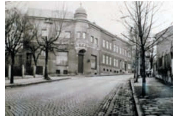
Národní dům - restaurace U Helingera a kulturní dům na křižovatce ulic Keltičkovy (tehdy 28. října) a Vilové.