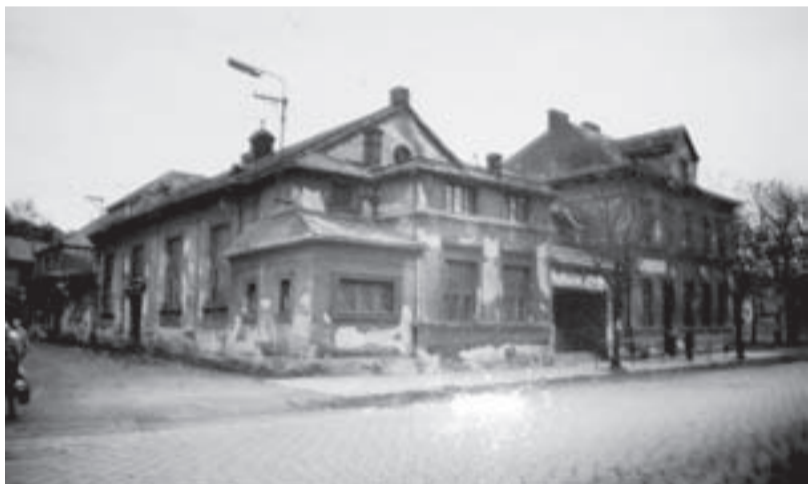
Starý kulturní dům na Bohumínské ulici asi v místě dnešního věžového domu na pravé straně směrem na Bohumín. Byly tu v 50. a 60. letech pořádány různé kulturní akce, plesy i taneční kurzy pro školy.