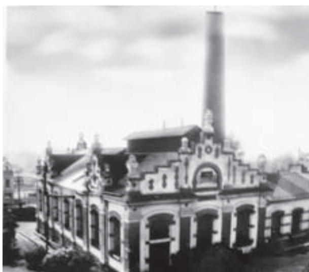
Pohled na elektrárnu u Gagarinova náměstí na počátku 20. století.

Za reklamu na vašem AUTĚ, PLOTĚ, DOMĚ či POZEMKU získejte až