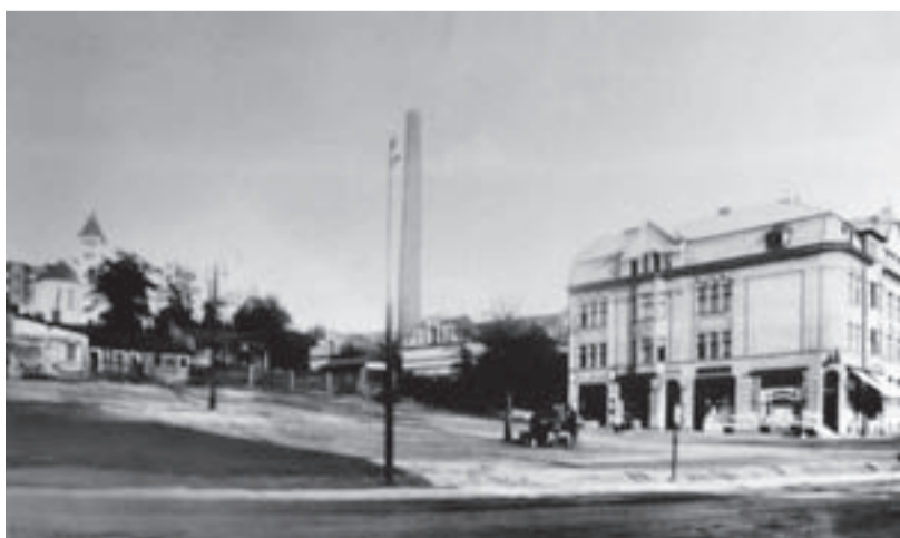
Náměstí Jurije Gagarina s elektrárnou a (kostelem) Husovým sborem v pozadí okolo roku 1925.