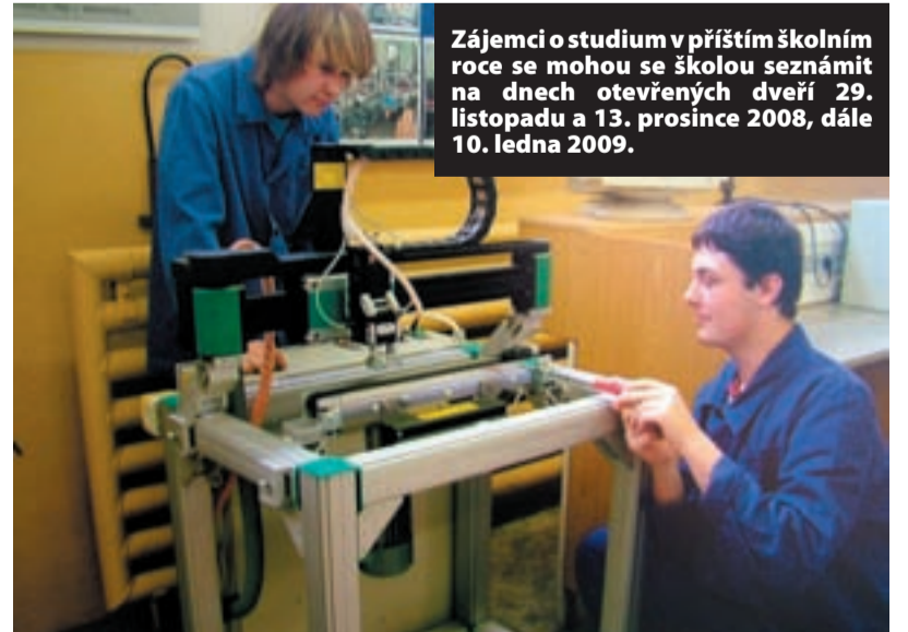
Zájemci o studium v příštím školním roce se mohou se školou seznámit na dnech otevřených dveří 29. listopadu a 13. prosince 2008, dále 10. ledna 2009.

rovněž uskuteční tradiční soutěž elektroniků o „Pohár starosty Slezské Ostravy“. Dále se škola představí na výstavě Učeň, středoškolač, vysokoškolač a pedagogika, opět na Černé louce, a to ve dnech 5. - 6. prosince 2008. V současné době má škola 1231 žáků, z toho 521 v 1. ročníku. Většina z nich studuje technické obory. (sy)