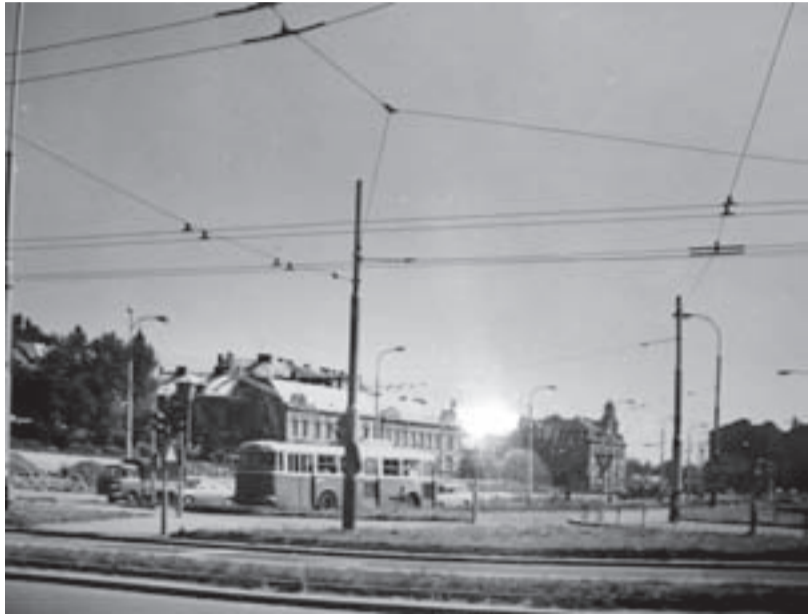
Původní křižovatka ulic Bohumínské a Revoluční. Odtud vedla stará Revoluční přes původní Most pionýrů.