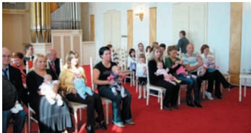
DO NOVÉHO ŽIVOTA. Poslední vítání nových občánků, kteří se narodili ve Slezské Ostravě, se uskutečnilo v obřadní síni slezskoostravské radnice v sobotu 11. října.