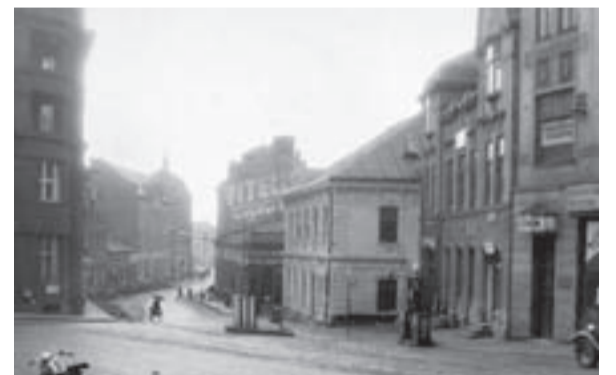
Křižovatka u budovy České spořitelny v 50. letech 20. století.