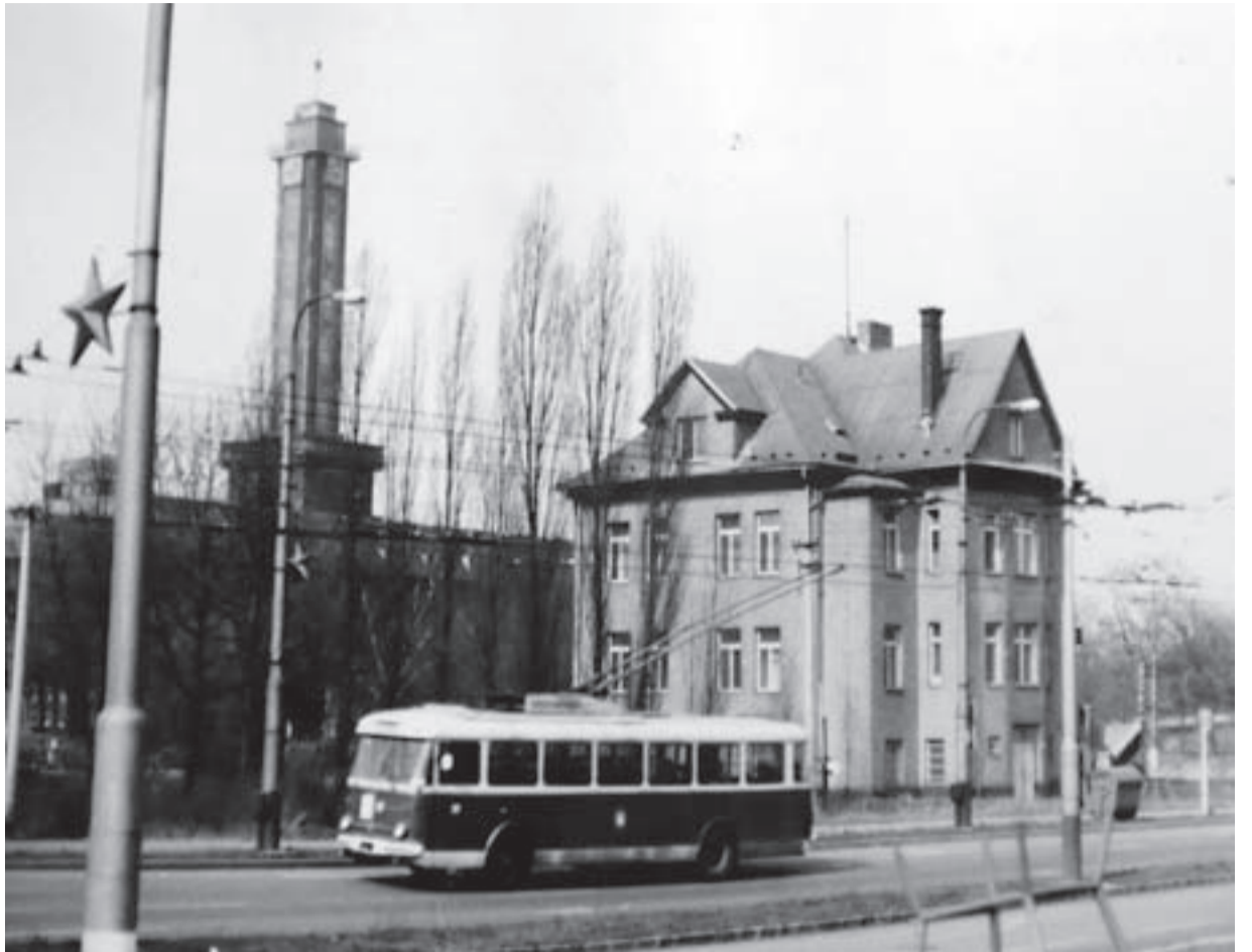
Pohled z Bohumínské ulice na Novou radnici na konci 60. let 20. století. V popředí Špačkova vila, která byla zbourána při výstavbě nového Mostu pionýrů. Na jejím místě vede sjezd z nového mostu na Bohumínskou ulici. Vlevo na obrázku je původní umístění (za řekou Ostravicí při vchodu do Komenského sadu do roku 1980) tanku č. 051 1. československé samostatné tankové brigády v SSSR, který přešel 30. dubna 1945 jako první přes Sýkorův most.