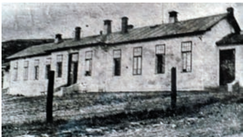
Slezskoostravská nemocnice v místě dnešní základní školy na Kamenci na počátku 20. století.