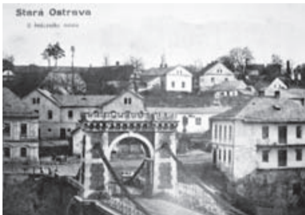
Řetězový most přes Ostravicí (na místě dnešního Sýkorova mostu), který sloužil mezi lety 1851 - 1886. Nakonec se zřítíl pod pochodovým krokem oddílu rakousko-uherské armády 15. 9. 1886 a byl nahrazen v 90. letech 19. století dnešním mostem.