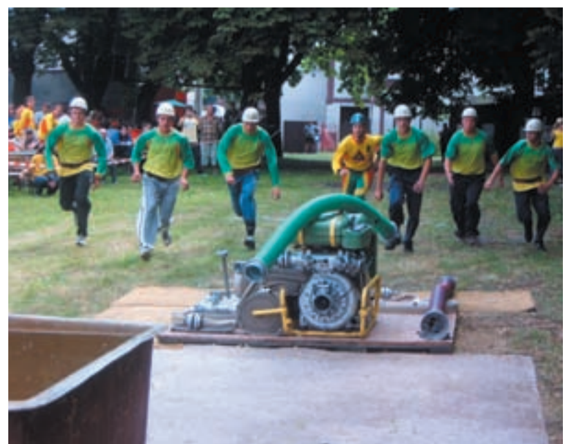
V AKCI. Koblovští dobrovolní hasiči jsou neustále v akci.