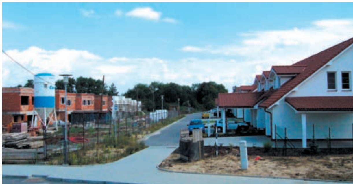
KRÁSNÉ BYDLENÍ. Malebné domečky v Muglinově poskytují svým majitelům příjemné bydlení. Další várka řadovek by měla být dokončena do 30. června příštího roku.

Stavbu provádí firma Stavos Stavba Ostrava. Výstavba má být dokončena do 30. června příštího roku.