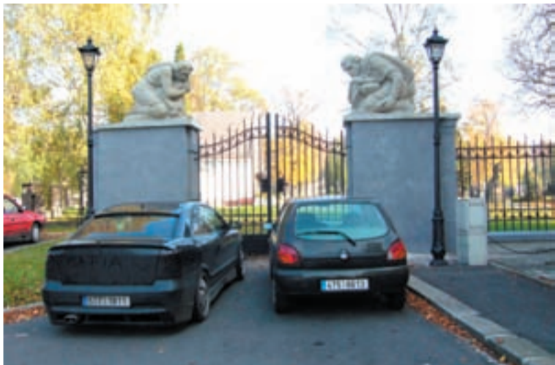
DO GALA. V současné době probíhají restaurátorské práce na dvou alegorických sochách na vstupních pilířích brány.

V areálu hřbitova vyrostly nové žulové stojany na vodu a v současné době probíhají restaurátorské práce na dvou alegorických sochách na vstupních pilířích brány.