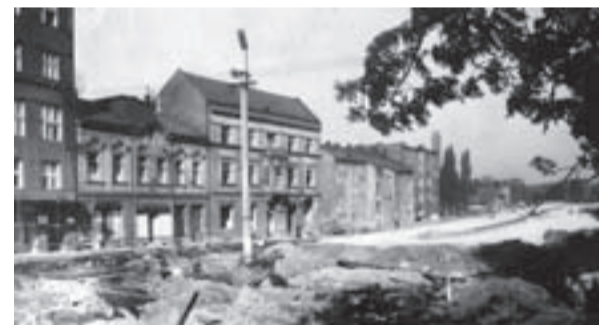
Přestavba Bohumínské ulice na počátku 70. let 20. století. Pohled na západní stranu ulice od budovy České spořitelny směrem k dnešnímu Mostu pionýrů.