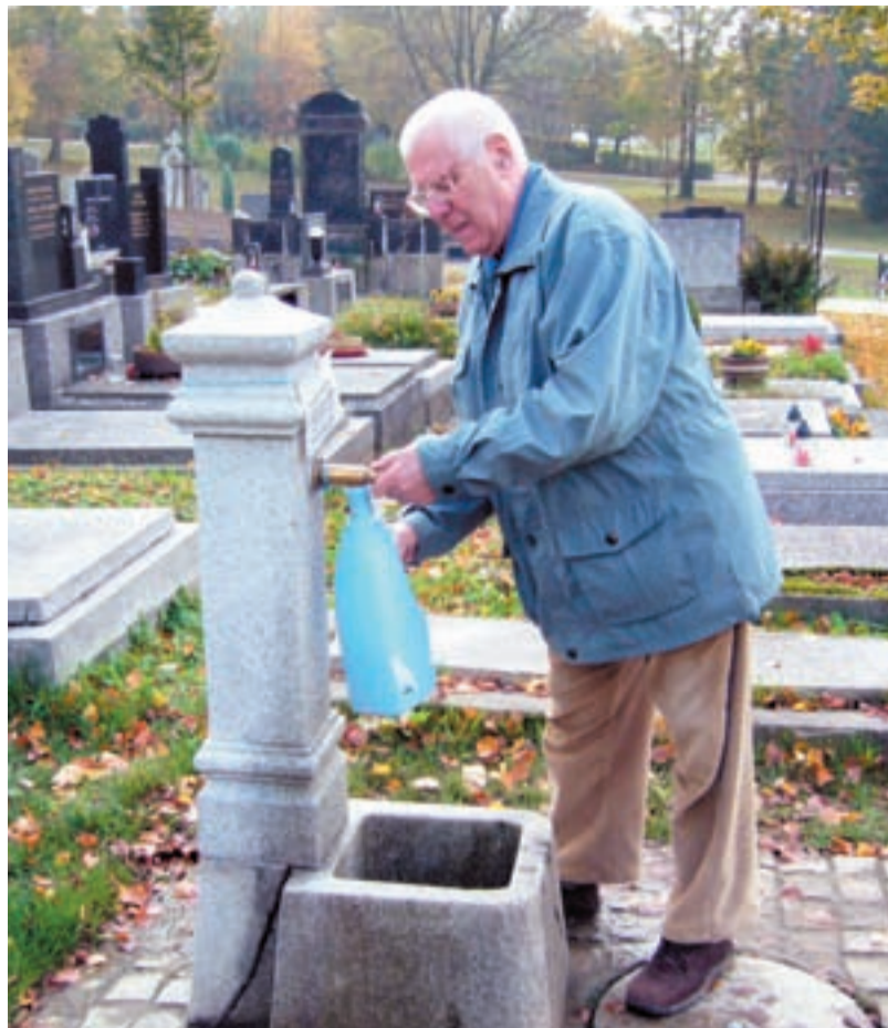
VODA. V areálu hřbitova vyrostly nové žulové stojany na vodu.

Na hřbitově v Ostravě-Kunčičkách byly zase opraveny vstupní zdi, které jsou součástí brány. I ta je opravena. Vše se rozjasnilo novými omítkami a barvami.