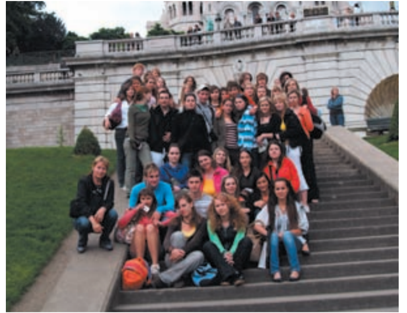
ZÁŽITKY. Na týdenní pobyt v malebné Francii hladnovští studenti hned tak nezapomenou.