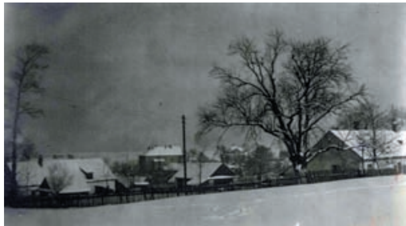
Krutá zima. Historický pohled na Muglinov v zimě roku 1938/39.