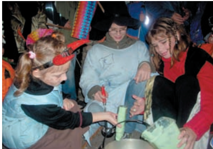
KOUZLA. Žáci Základní školy Pěší v Muglinově oslavili halloween jaksepatří.

„V nejtemnějších zákoutích Muglinova však na děti čekala stezka odvahy osvětlená pouze svíčkami. Děti si musely zapamatovat obrázky, které každá svíčka osvětlila a na konci je všechny odříkat. Za to je pak čekala sladká odměna. Ale to ještě nebylo vše. Nyní přišlo na řadu kouzelné zaříkávadlo a příprava kouzelného lektvaru, který pak všichni ochutnali. Před rozloučením děti dostaly na památku masku a halloweenskou sladkost. S hurónským pokřikem se vrátily ke škole, kde je už nedočkavě očekávali rodiče. Příští rok si to prý rádi zopakují znovu. (lr)