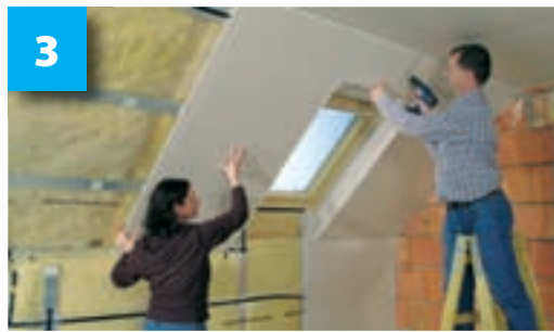
Opláštění vodorovných a šikmých stěn sádrokartonovými (či sádrovláknitými) deskami

Více informací: Centrum technické podpory Rigips, tel.: 296 411 800, mob.: 724 600 800, e-mail: ctp@rigips.cz , www.rigips.cz