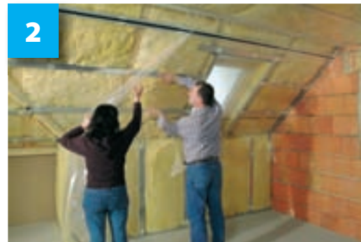
Aplikace parozábrany pod již vloženou tepelnou izolací