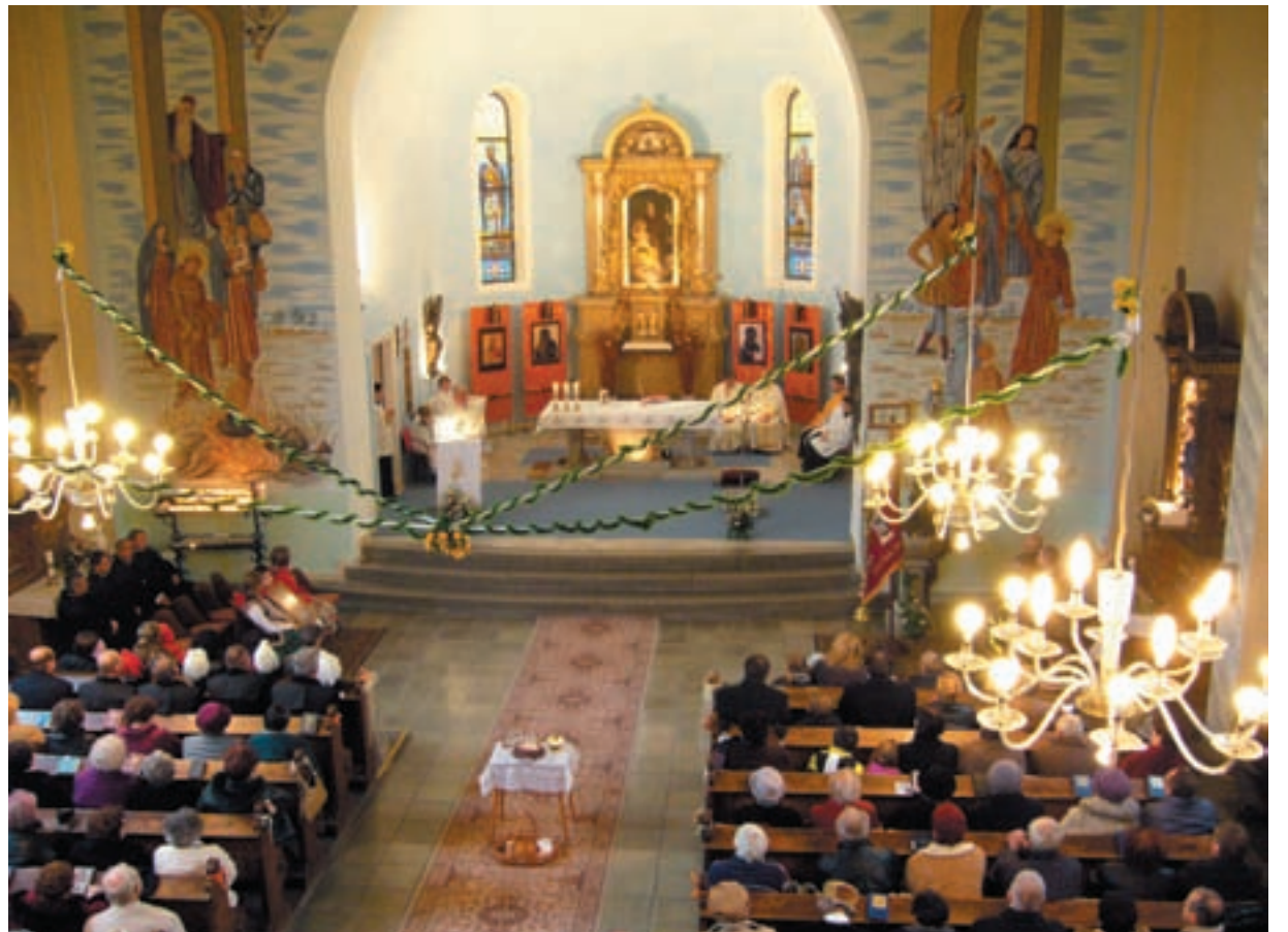
OSLAVY. V neděli 18. listopadu si věřící v Kunčičkách připomněli 80. výročí zasvěcení zdejšího kostela sv. Antonínu Paduánskému.

Další zasedání slezskoostrovského zastupitelstva se uskuteční 18. prosince v 15 hodin v Kulturním domě v Muglinově.