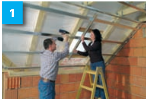
Připevnění pozinkovaných profilů a krokových závěsů

Podrobnější informace o výstavbě podkroví najdete v odborné literatuře, např. v knize „Sádrokarton zvládneme sami“ od společnosti Rigips.