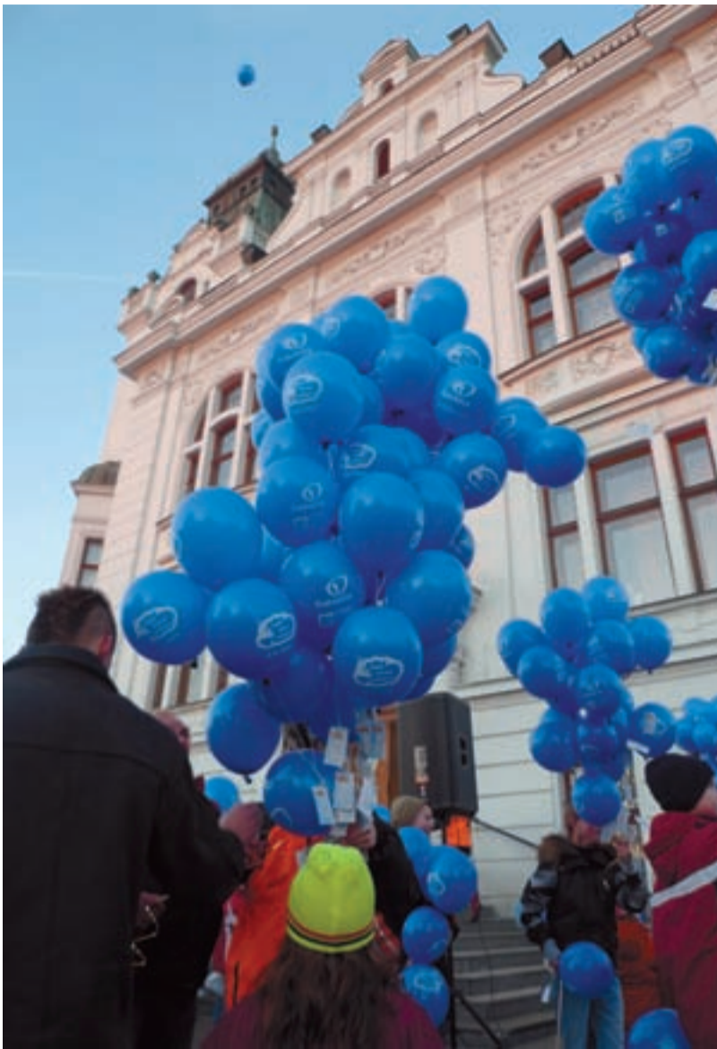
HROMADNÁ POŠTA. Modré balónky byly opravdu všude.

Na území našeho regionu se akce zúčastnily například města: Brušperk, Ostrava, Bílovec a mnohé další. Účastnily se jí nejen děti, ale i dospělí. Na mnoha místech bylo vypouštění spojeno s doprovodným programem, zpíváním koled a celkovou vánoční atmosférou.