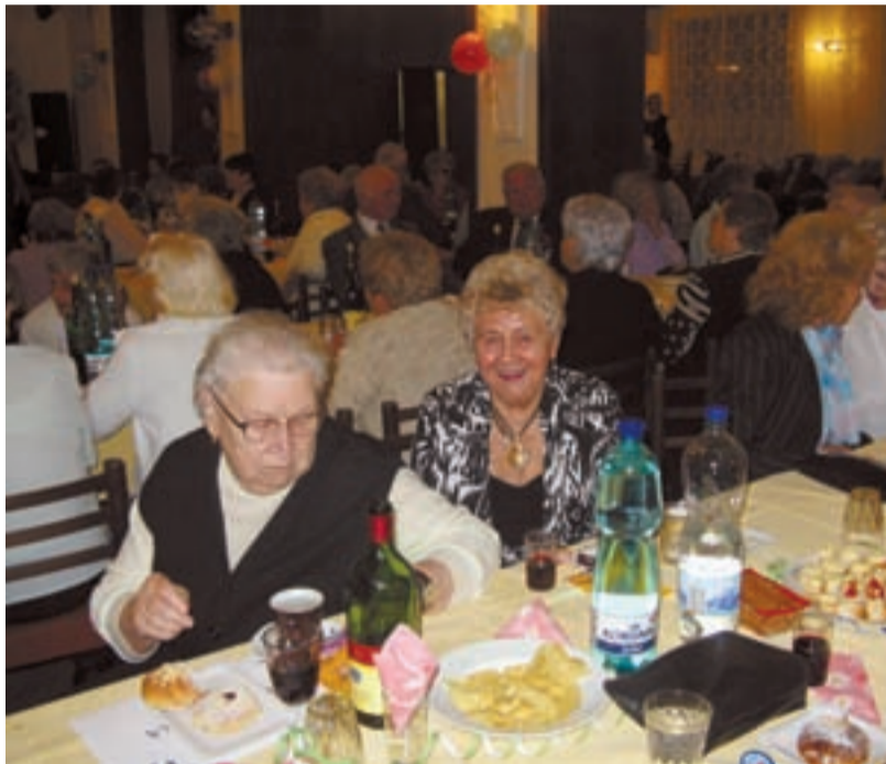
SENIORI. Ples seniorů, který se konal koncem listopadu v Kulturním domě v Michálkovicích, se vydařil.