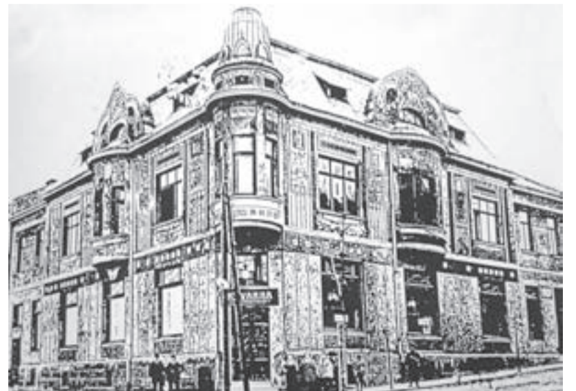
VZPOMÍNKY. Kavárna Metropol na rohu Jaklovecké a Nejedlého ulic ve Slezské Ostravě v době, kdy zde působila stálá scéna loutkového divadla Dřevěné království.