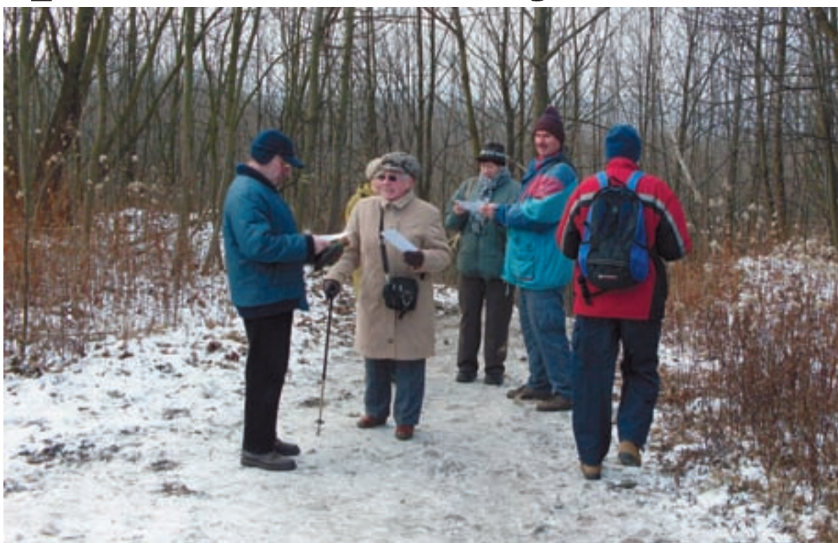
JAK NA NOVÝ ROK. Letošního novoročního výstupu na haldu Emu se zúčastnilo 371 lidí.