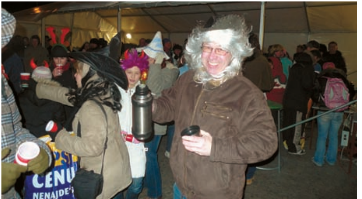
DŮSTOJNÉ ROZLOUČENÍ. Přes tisíc Ostravanů se přišlo rozloučit před slezskoostravskou radnicí s rokem 2008.