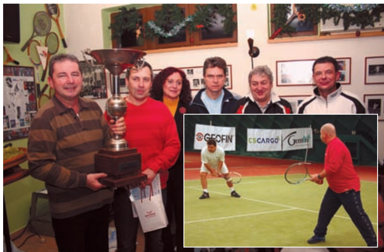
PŘEDVÁNOČNĚ. Vánoční turnaj se i tentokrát velmi vydařil.

Uzávěrka dalšího čísla Slezskoostrovských novin je 10. února 2009.