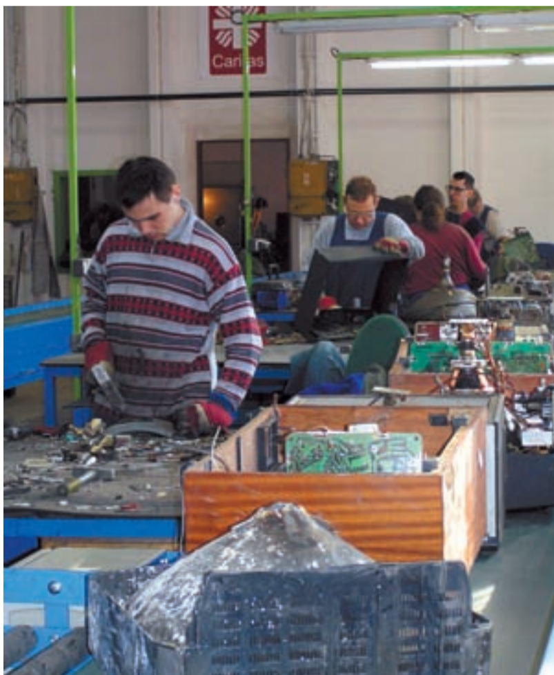
ÚLEVA. Nové prostory s dopravními pásy šetří síly tělesně postižených zaměstnanců.