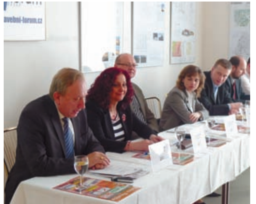
STAVEBNÍ BOOM? O tom, co udělat, aby byla Slezská Ostrava stále krásnější, debatovali na stavebním fóru představitelé obvodu se zástupci města a RPG.