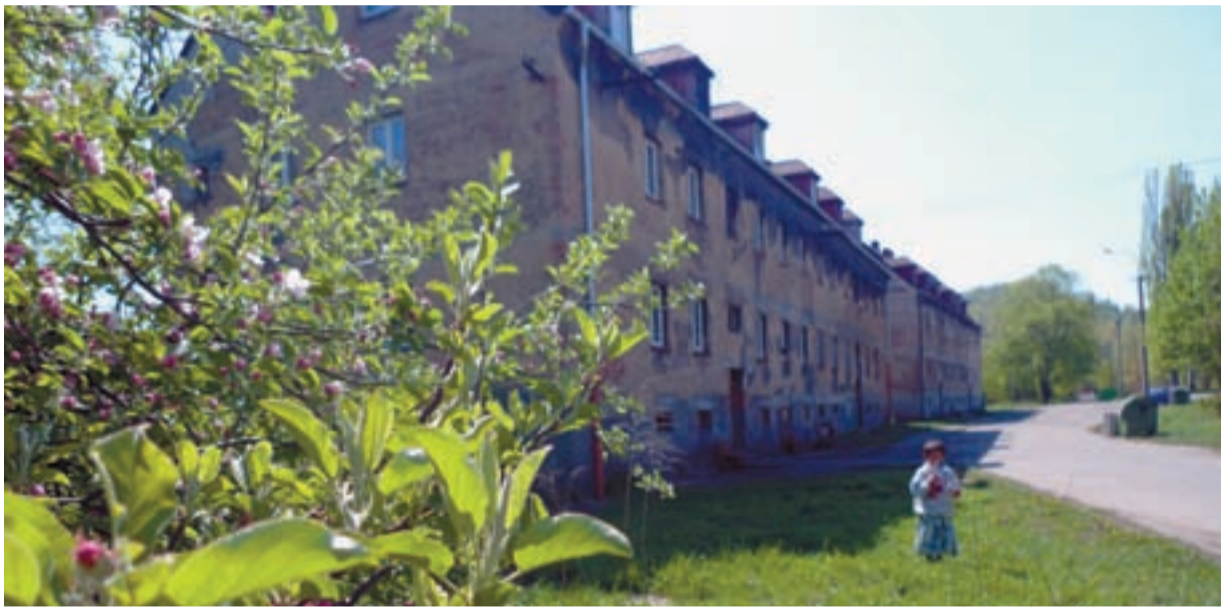
ZEMĚ NIKOHO. Kdysi malebný Hrušov se stal zemí nikoho. Riegrova ulice patřila k nejhezčím.

Vznik Hrušova se datuje od roku 1256. Jeho zánik začal od roku 1960. Hlavním důvodem byly velké povodně v letech 1960 a 1997, kdy měla voda nerovného soupeře v podobě značného poddolování jeho území. Živitelkami desetitisíců jeho občanů byly dva dosti velké doly a největší v té době chemická továrna s přílehlou továrnou na hliněné zboží.