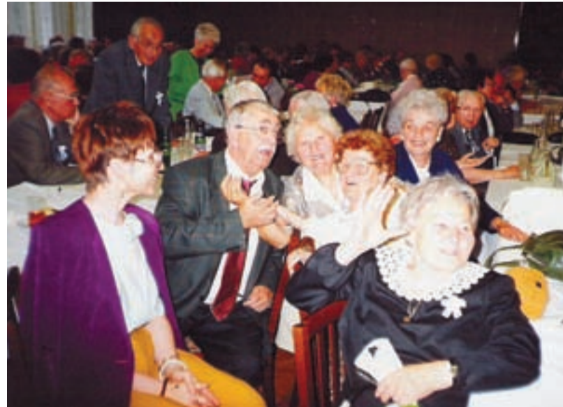
VESELÁ NÁLADA. Bavili se všichni – ti slavní i ti méně slavní.