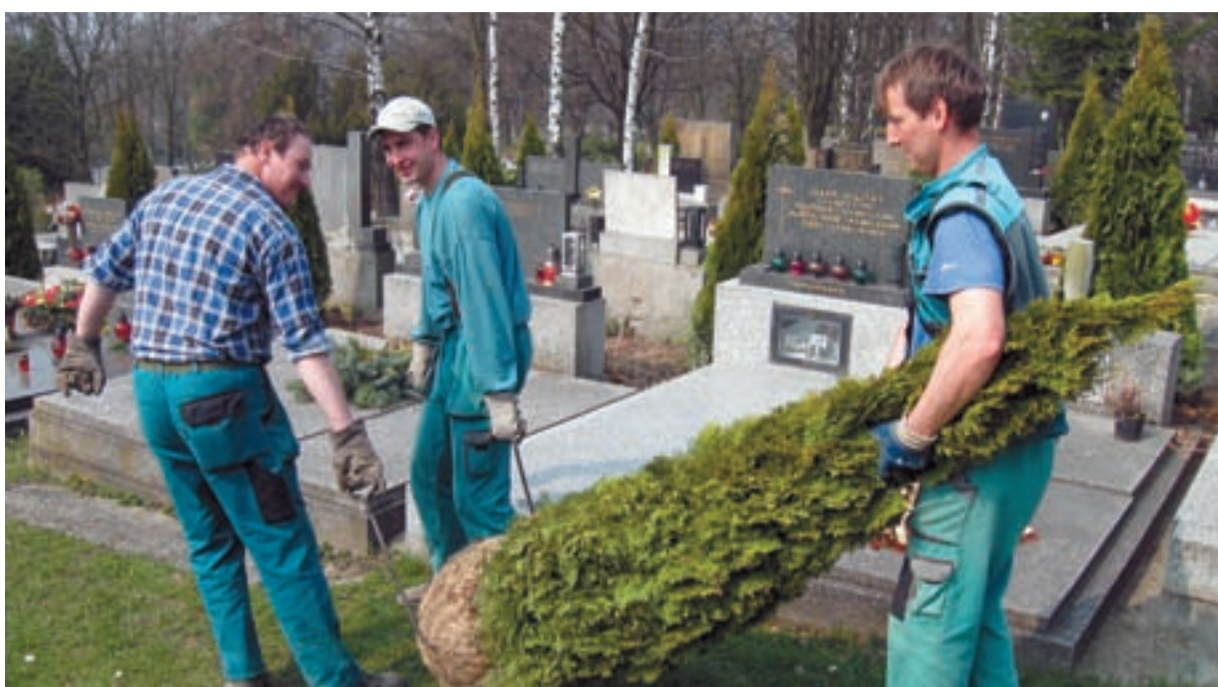
DŮSTOJNÝ ODPOČINEK. Zaměstnanci městského obvodu vysadili na přelomu března a dubna několik desítek již vzrostlých tují. Hřbitov se tak stává stále důstojnějším místem posledního odpočinku zemřelých.