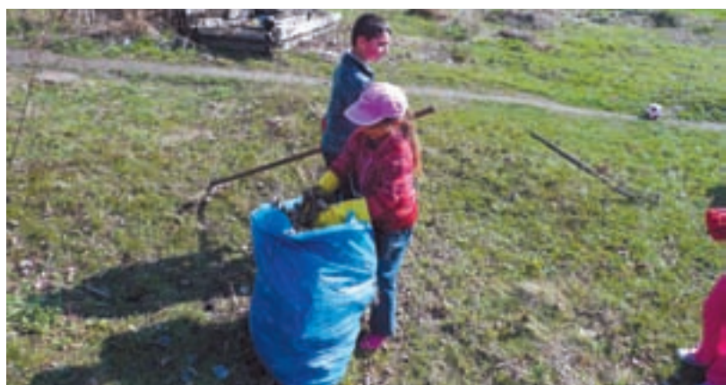
PŘÍKLADEM. Jako první se zhostily úklidu na Liščině malé děti.

OSTRAVA/ Ještě nedávno se mnozí lidé báli chodit do sklepů nebo na půdy bývalých hornických činžáků na Liščině. Přes hory odpadků totiž nebylo vidět. Aby se situace zlepšila, bylo před domy na ulicích přistaveno v pátek 3. dubna patnáct velkokapacitních kontejnerů, a to na ulice Žalmanova, Vývozní, Sodná a Orlovská.