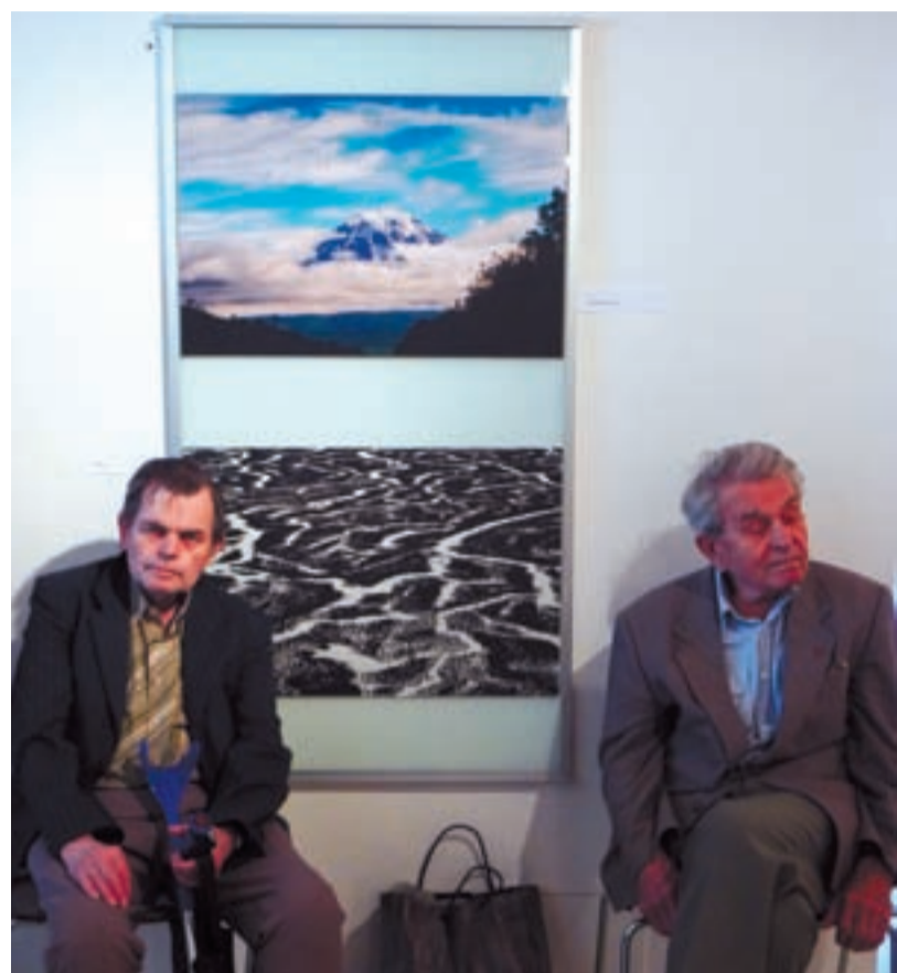
ROZMANITÉ PODOBY. Kamčatka má mnoho nejrůznějších podob.

30.5.09 Baletní představení žáků tanečního oboru, koncertní sál JKGO od 17 hodin.