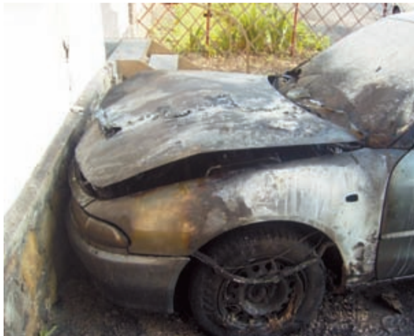
ŠOK. Zápalná láhev dopadla na auto veterinářky a zcela je zničila.

MUGLINOV/ Automobil zaparkovaný těsně u domu a veterinární ordinace ostravské zvěrolékařky MVDr. Barbory Jelonkové v Ostravě-Muglinově se stal 1. května ve tři hodiny ráno terčem útoku neznámých pachatelů, kteří na přední sklo auta hodili zápalnou lahev.