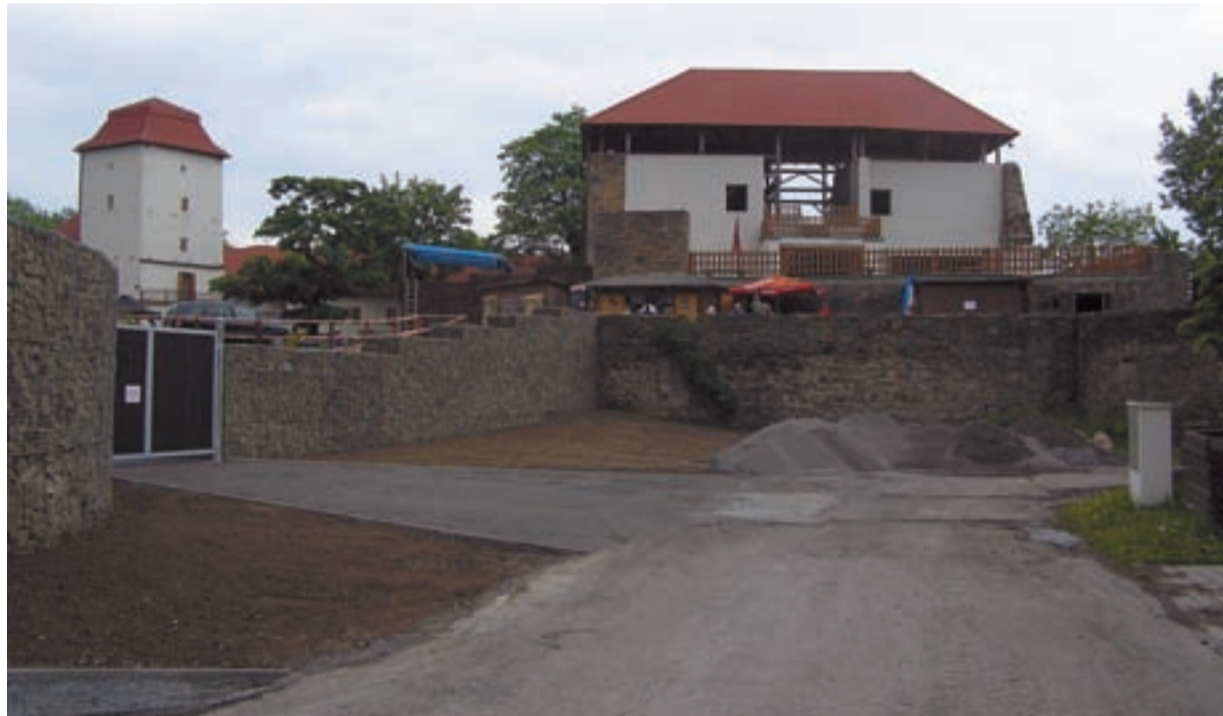
STÁLE KRÁSNĚJŠÍ. Slezskoostrovský hrad se neustále rozrůstá a vylepšuje.