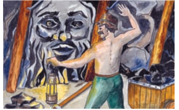
V podvečer před svátkem svatého Prokopa pracoval Uhel ještě v jámě, aby dokončil započaté dílo. Skalní duch, ochránce horníků, mu našeptal, jak má chytře na své dcery vyzrát.