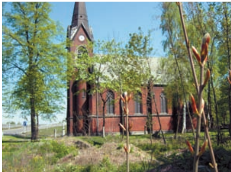
SOS. Hrušovský kostel sv. Františka a Viktora volá o pomoc.

Hrušovský kostel sv. Františka a Viktora však není pouze majetkem církve, ale stojí také na území městského obvodu Slezská Ostrava. Jedná se o ojedinělou architektonickou stavbu, která by se mohla stát kulturní památkou, navíc s výbornou akustikou a s vzácnými velkými varhanami, jaké jsou v Ostravě pouze tři. Aby se nám však kostel nerozpadl před očima, je nutné dokončit opravu nejen věže, ale také vitráží, varhan a především dlažby kolem kostela, která byla doničena při stavbě dálnice. Záchrana kostela je však finančně odkázána pouze na snahu zdejšího kněze a jeho farníků a na případné dotace z nadací. Město nebo případní sponzoři jako by na tuto stavbu zcela zapomněli. A chátrající stav nikoho netrápí a možný zánik kostela nikoho nebolí. Jako kdyby-