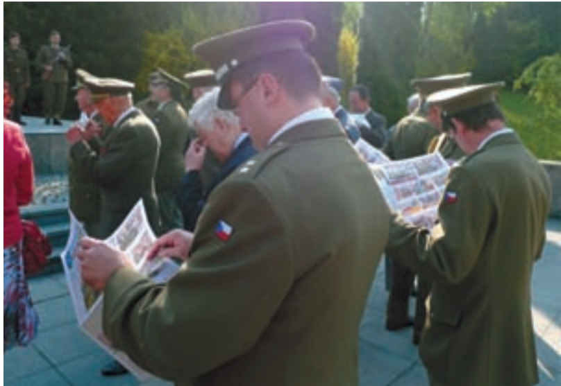
ZPESTŘENÍ. Milým zpestřením akce byly naše Slezskoostravské noviny, v nichž právě vyšel komiks Drama u mostu. Jak je vidět, zaujal i vysoké vojenské šarše.