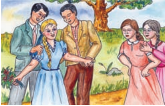
Nejmladší dcera Lenka byla nejen neobyčejně chytrá, ale i velice krásná, a proto o nápadníky neměla nikdy nouzi. Obě starší sestry pohlížely na Lenčino štěstí s neskrývanou závistí.