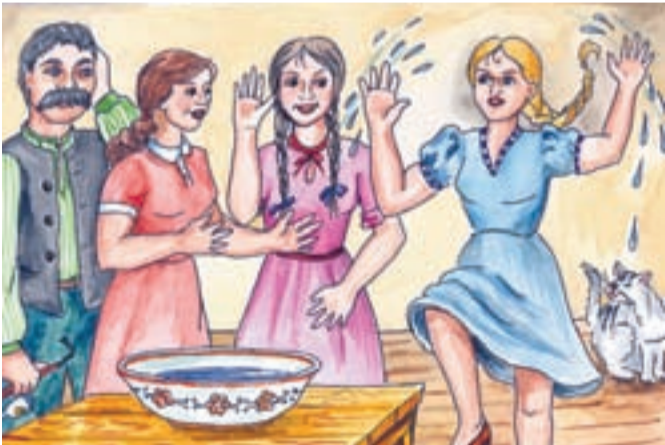
Lenka se však nesmála a věděla proč. Následkem rychlých pohybů rukou oschly její ruce první a to rozhodlo, že se bude vdávat jako první. Teprve nyní se usmála na sestry a na tatínka, který prohlásil: „Tobě uschly ruce první, budeš se tedy vdávat.“