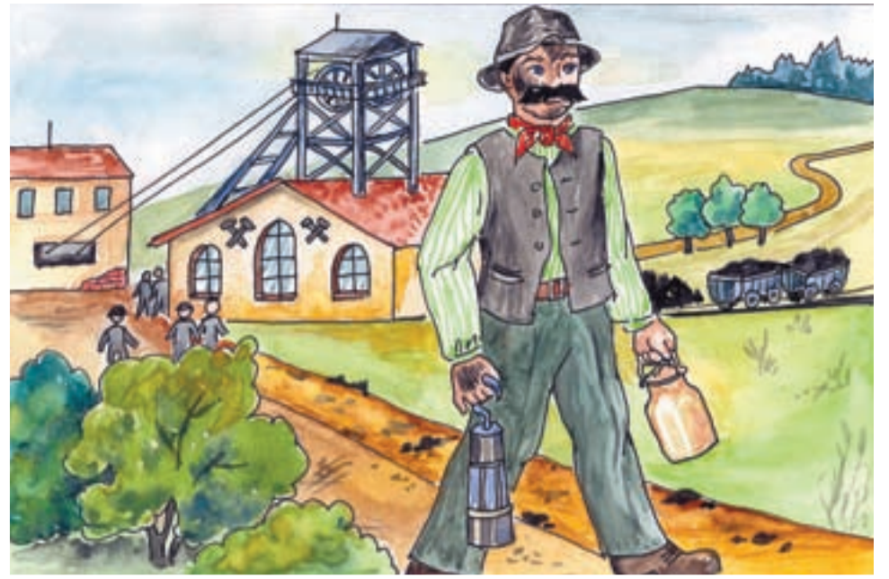
Před mnohými lety pracoval na slezskoostravské šachtě počestný a pilný havíř s typickým jménem Uhel.