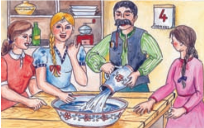
Dcery souhlasily a na otcův pokyn ponořily své ruce do kameninové mísy naplněné vodou a za chvíli je opět na otcův pokyn z mísy vytáhly.