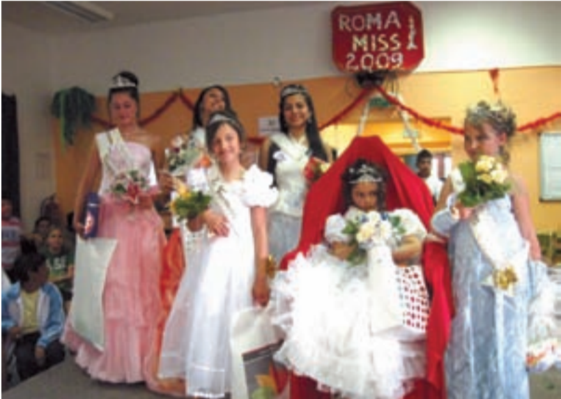
NEJKRÁSNEJŠÍ. O titul Roma Miss Ostrava 2009 soutěžilo šestnáct dívek.