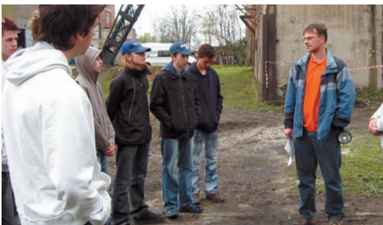
DŮL PETR BEZRUČ. Žáci slezskoostravských základních škol navštívili památný Důl Petr Bezruč.

Účastníky - většinou rodiny s dětmi - zajímalo například, proč nelze jít na věž, když jsou tam schody, nebo proč je tam zámek. „I to svědčí o atraktivitě lokality, která by měla být zpřístupněna a smysluplně využita,“ doplnil Jiří