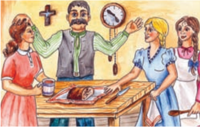
V domku hornické kolonie, kde bydlel, panovala i přes jeho pilnost v práci více bída než nadbytek. Navíc měl i tři dcery a všechny na vdávání, ale na to, aby je všechny provdal, neměl dostatek peněz.