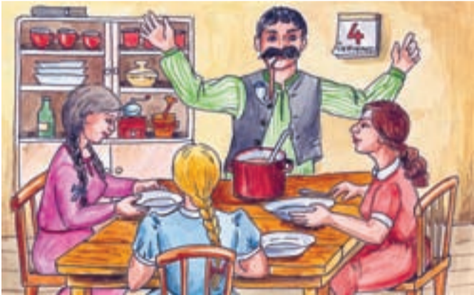
Po nedělním obědě řekl svým dcerám: „Samy dobře víte, že nemám dostatek peněz na to, abych vás provdal všechny najednou. Naplním proto velkou mísu vodou a vy si v ní umyjete ruce. Té, které ruce uschnou nejdříve, té vystrojím veselku první. Rozumíte?“