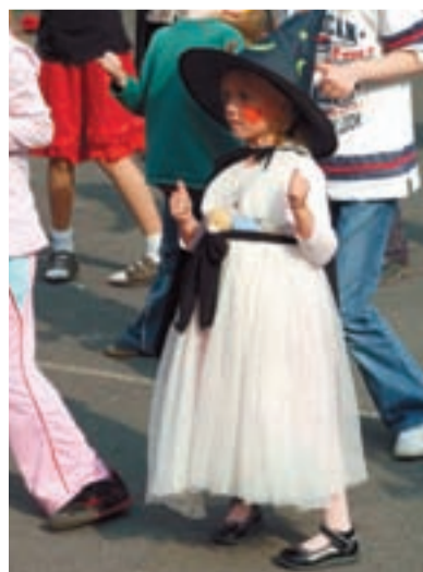
FILIPOJAKUBSKÁ NOC. Děti se na jedno odpoledne převtěly do nadpřirozených bytostí.