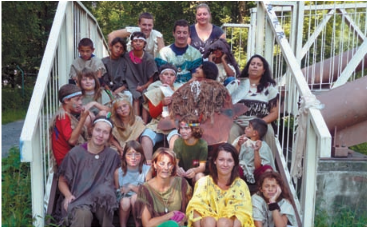
RARITA. Díky zálibě pana školníka se mohou v muglinovské škole radovat ze záplavy květů.