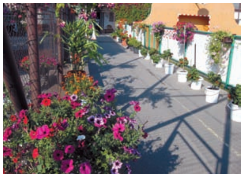
RARITA. Díky zálibě pana školníka se mohou v muglinovské škole radovat ze záplavy květů.