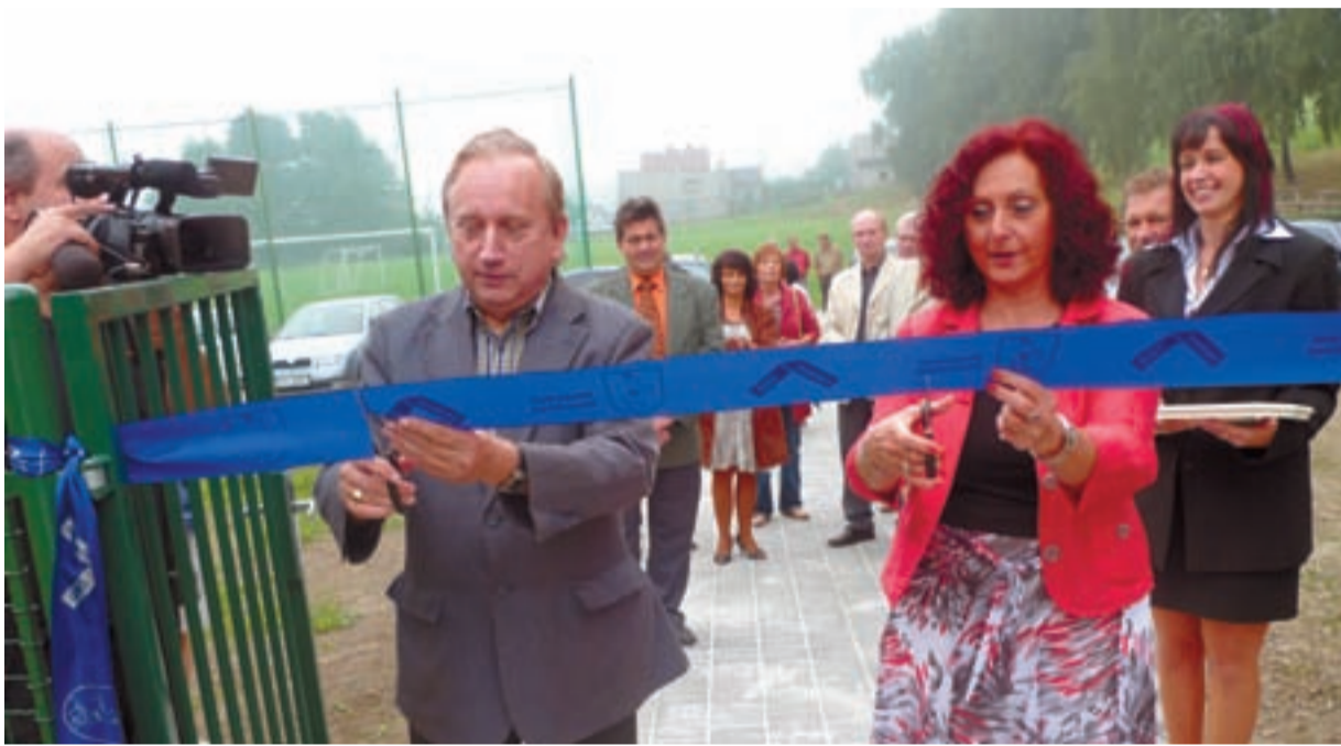
PODAŘILO SE. Nové multifunkční hřiště slavnostně zkolaudovalo vedení městského obvodu přestřižením pásky, a to ve čtvrtek 10. září 2009.

„Protože nadace měla podmínku, že stavba musí být realizována do listopadu letošního roku, měli jsme opravdu co dělat, abychom zbývající peníze včas sehnali. To se nám nakonec podařilo a my jsme velmi rádi, že můžeme našim občanům nabídnout tento špičkový sportovní areál,“ dodává místostarostka.