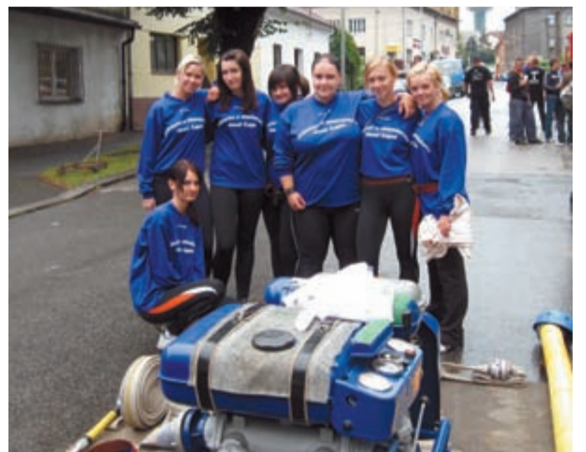
MLÁDÍ. Okrasou soutěže byly bezesporu mladé dívky – požárnice z Muglinova.