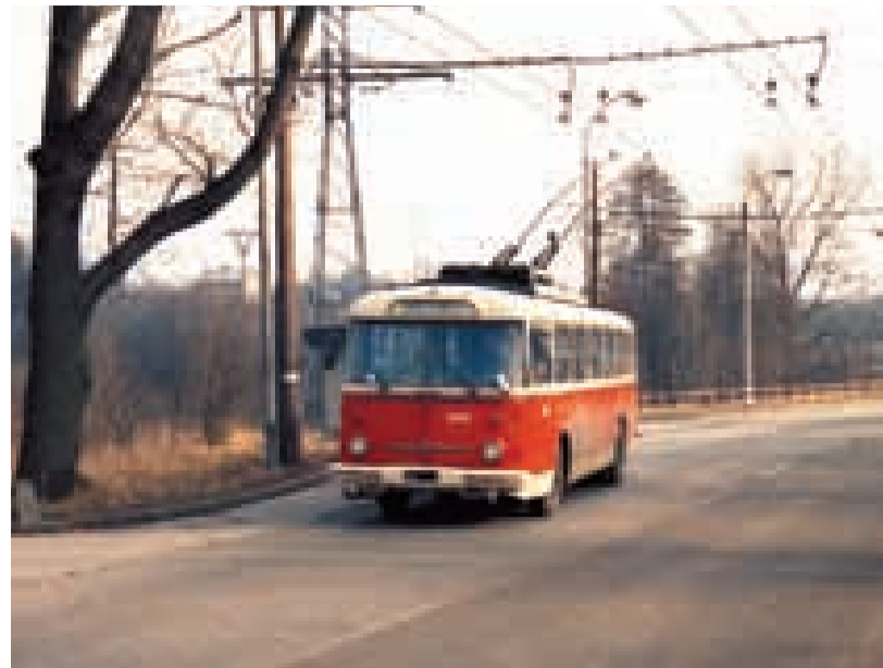
Jeden z posledních zástupců červenobílých trolejbusů Škoda 9TrHT č. 3113 byl vypraven dne 28.2.1994 na linku č. 106. Foceno při odjezdu ze zastávky Parcelní.