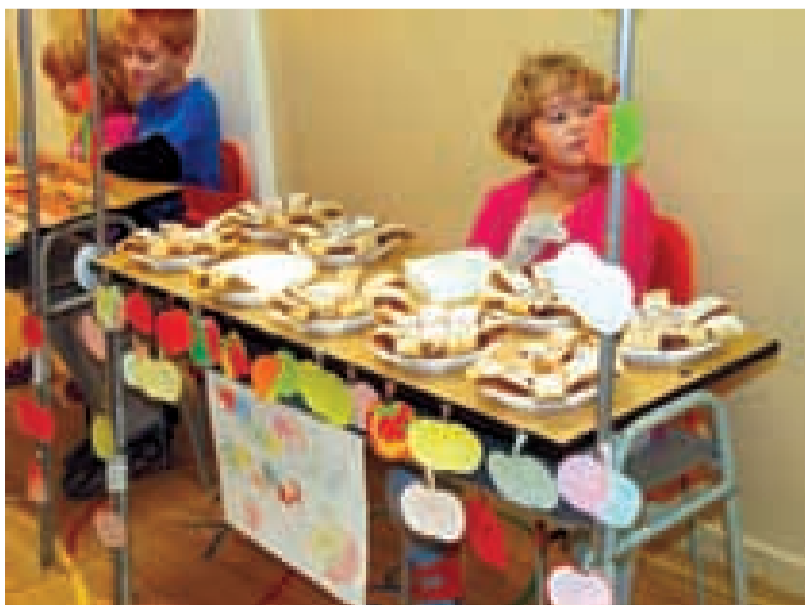
DELIKATESY. Jablečný den se stává v Základní škole Chrustova tradicí. Ani letos tomu nebylo jinak a všude po chodbách se linula libá vůně jablíček.