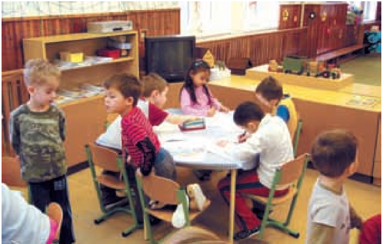
PRASKAJÍ VE ŠVECH. Většina mateřských škol ve Slezské Ostravě zápasí s nedostatkem míst.

Obrovský zájem ze strany rodičů je o Mateřskou školu Požární v Heřmanicích. Přestože kapacita tohoto předškolního zařízení je 50 míst, již zhruba sedm let není schopna uspokojit všechny zájemce. „Žádosti o přijetí podávají rodiče již kolem jednoho roku dítěte, dokonce i dříve, aby měli jistotu, že bude dítě do naší školky umístěno. Proto bychom přivítali rozšíření kapacity, ale z hygienických důvodů to zatím není