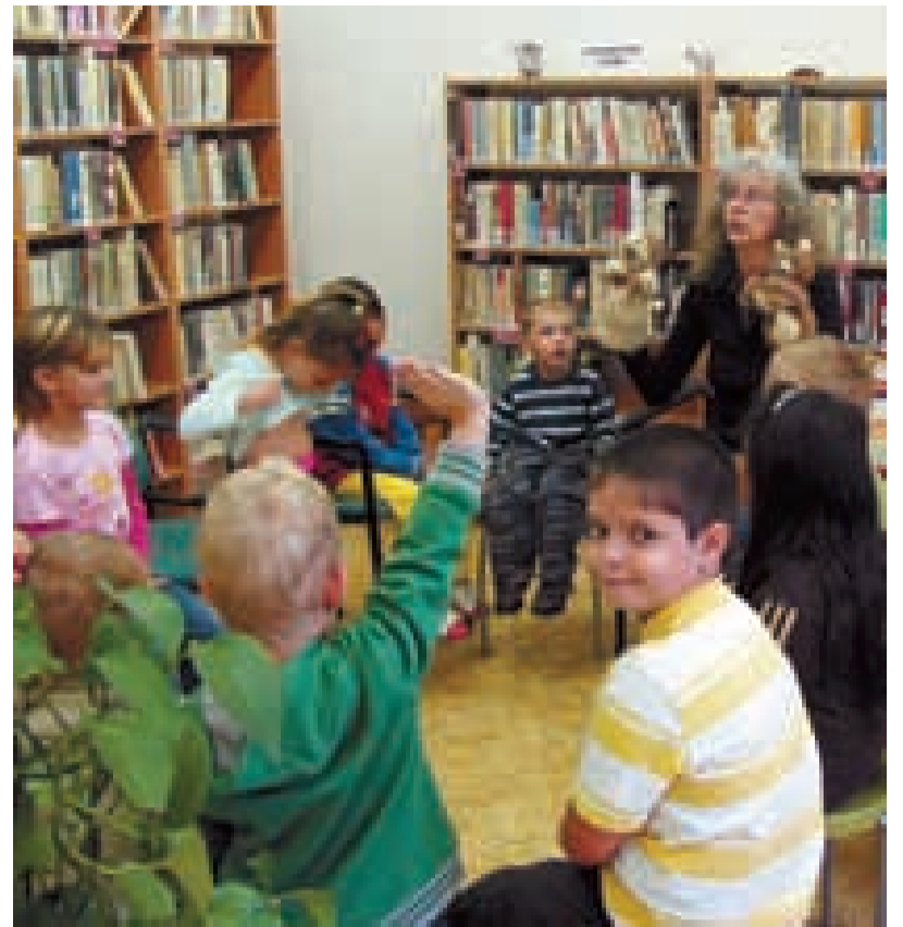
KNIHA MÉHO SRDCE. Knihovnice navštívily i slezskoostravské mateřské školy, aby dětem přiblížily krásu psaného slova.