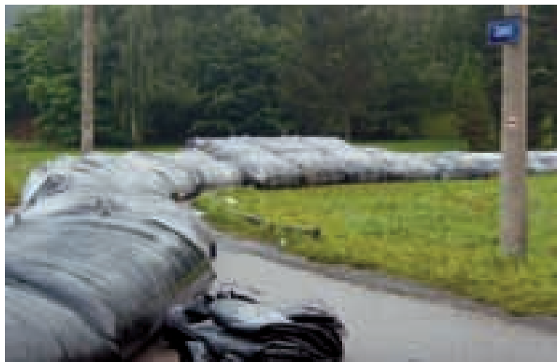
JAK DLOUHO JEŠTĚ? Při každém větším dešti se staví v Koblově protipovodňová hráz.

Na řece Odře v Koblově se začala budovat hráz na levém břehu. Dokončena bude v roce 2010, celkové náklady mají dosáhnout 133 milionů korun. (sy)