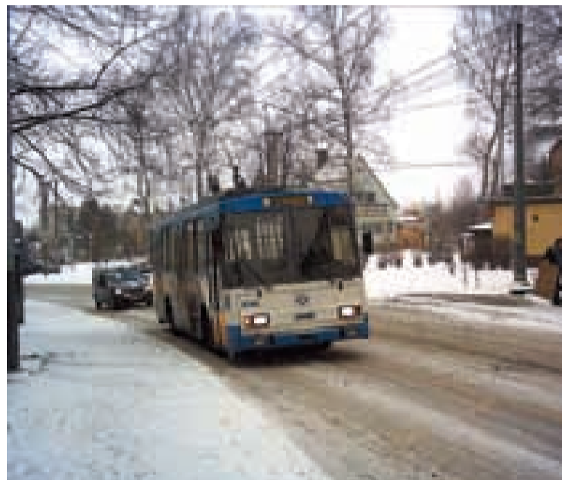
Po nádherně zasněžené silnici s obtížemi stoupá trolejbus Škoda 14Tr č. 3246 k zastávce Kepkova.