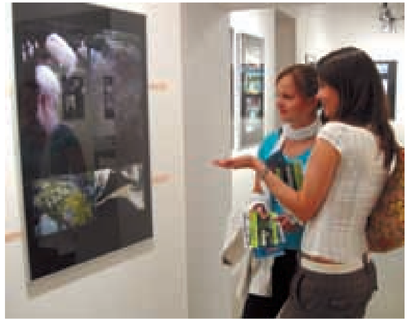
POZVÁNÍ. Záměci si mohou prohlédnout ve Slezskostravské galerii na 250 fotografií Jiřího Kráčalíka.