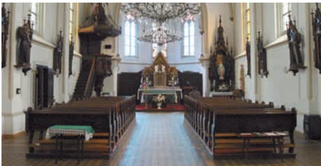
SOS. Kostel sv. Františka a Viktora v Hrušově čeká na pomoc.