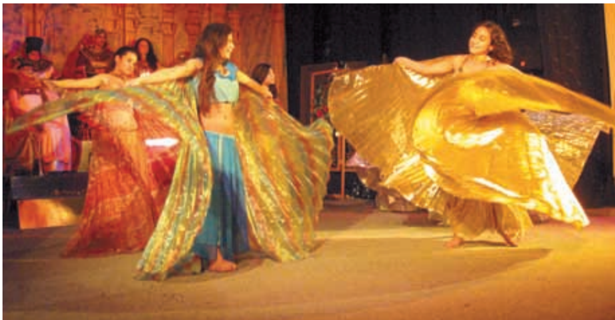
ZASLOUŽENÉ OVACE. Pohádka, kterou odehráli děti z nízkoprahových zařízení, publikum doslova nadchlo.