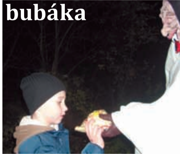
STRAŠIDLA. Halloween se žákům muglinovské školy vydal i díky umrlici, který jim nabízel za jejich odvalu „ruku“ plnou pamlsků.