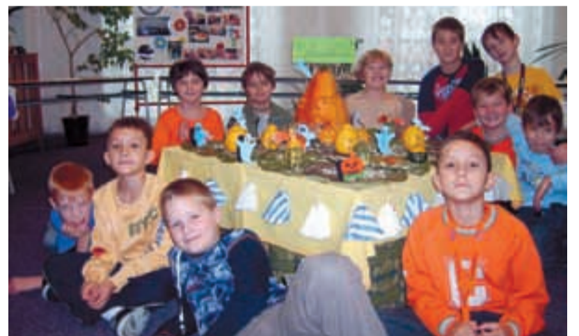
VÍTĚZOVÉ. Ve velké konkurenci byla jako nejlepší vyhodnocena práce žáků 3. třídy.