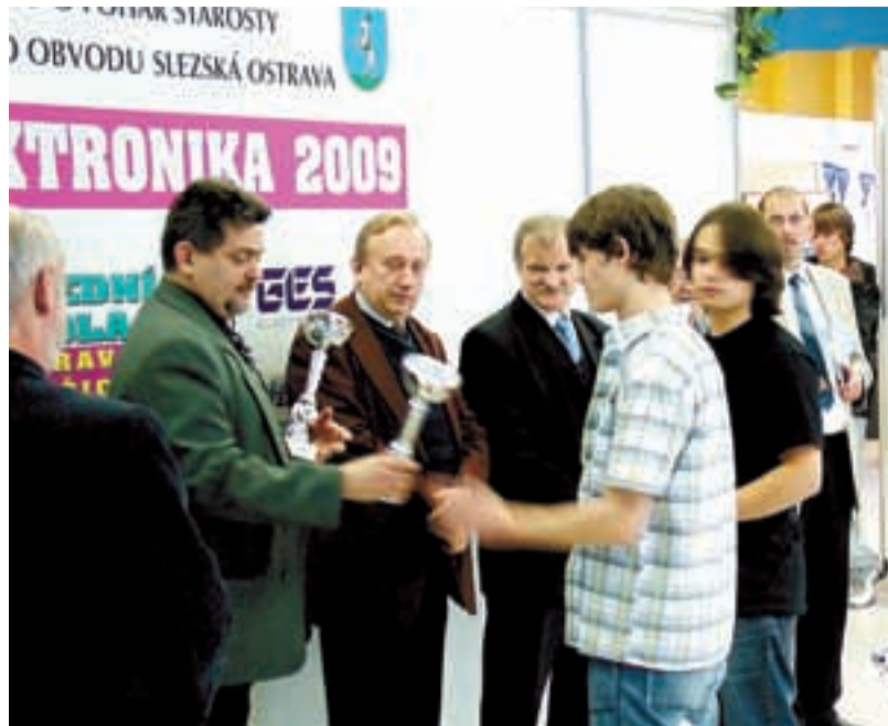
ZASLOUŽENĚ. Ceny vítězným školám předali starosta ing. Antonín Maštálíř a místostarosta Radomír Mandok.

Stanislav Drozd Střední škola, Ostrava-Kunčice