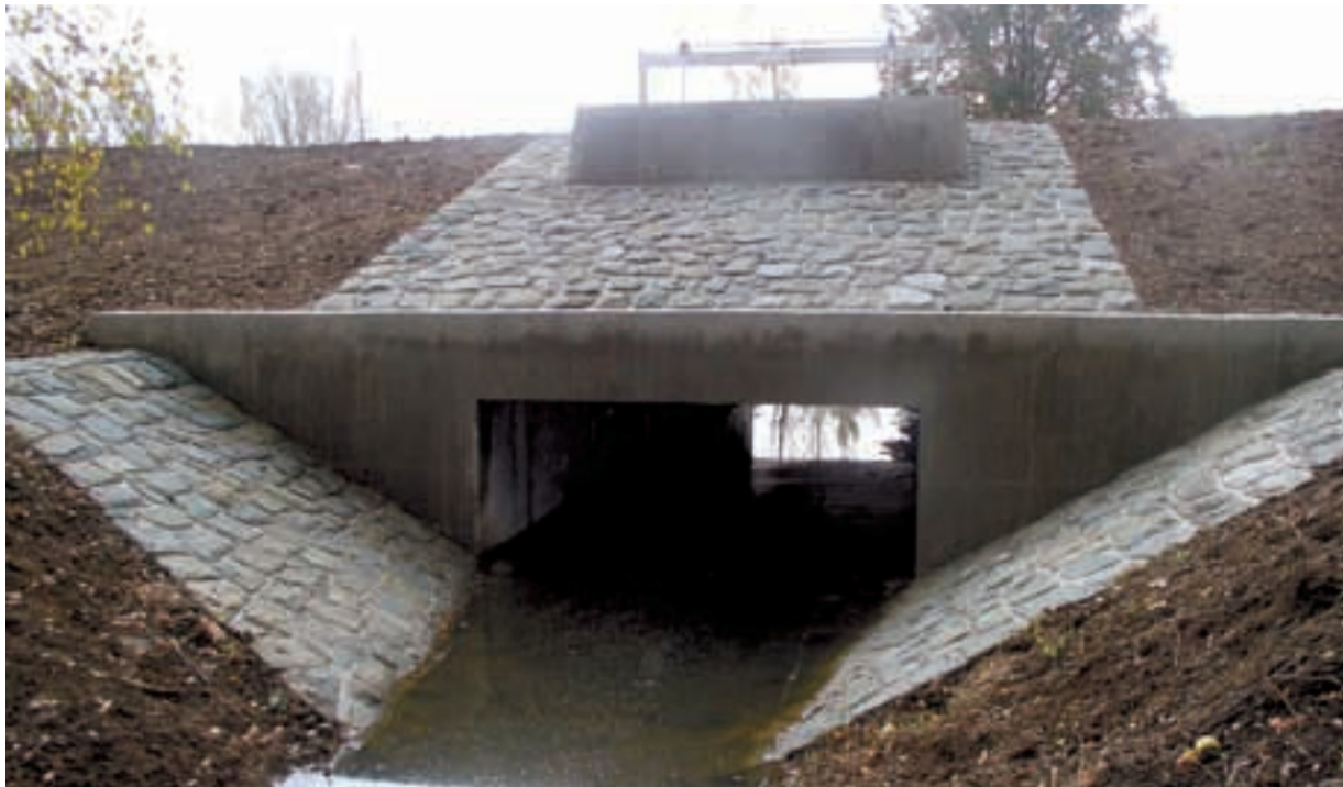
PROPUSTEK. Tato stavba bude regulovat průtok vody v době povodní.