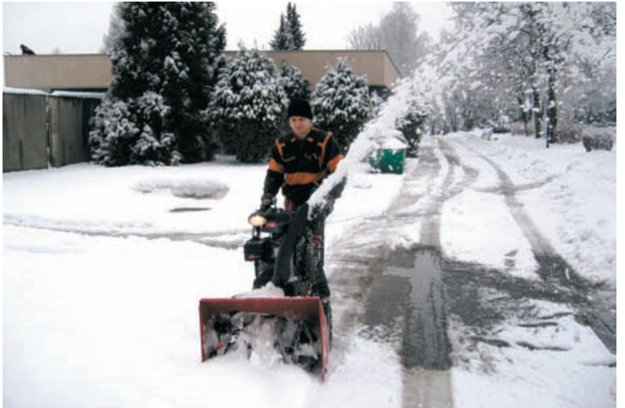
V AKCI. Aby se lidé dostali na Vánoce ke hrobům svých zemřelých blízkých, musejí být zaměstnanci ústředního hřbitova neustále v akci.

Občany jistě bude zajímat také skutečnost, že od 1. prosince 2009 byly převedeny v důsledku změny zákona č. 114/1992 Sb. na zdejší úřad kompetence ve věci povolování kácení dřevin. Od tohoto data vykonává tuto činnost odbor TSKZaH, což znamená, že vede správní řízení ve věci kácení dřevin pro všechny subjekty na pozemcích v městském obvodu Slezská Ostrava, a to v případě, že dřevina má ve výšce 130 centimetrů nad zemí obvod větší než 80 centimetrů a plocha keřů pro vymýcení je větší než 40 metrů čtverečních. (sy)