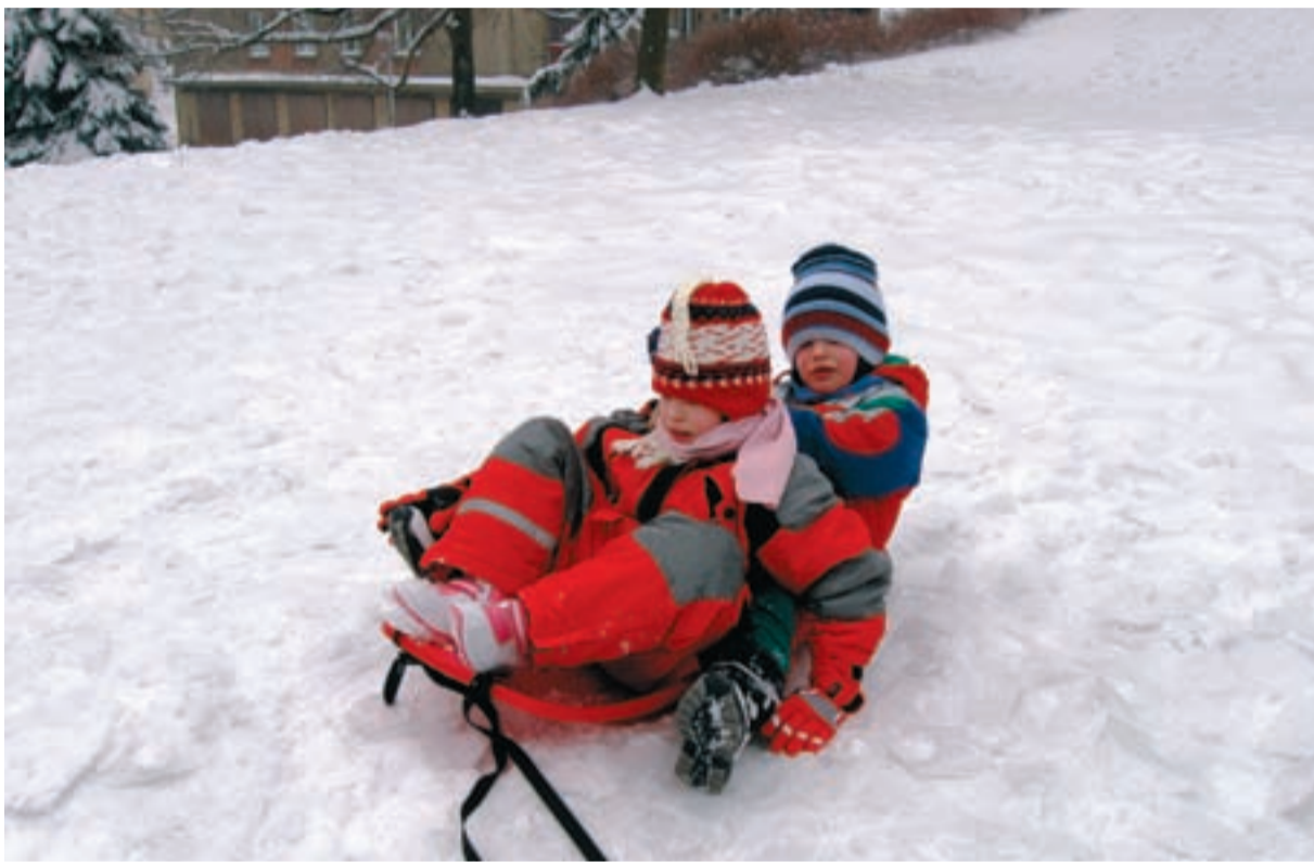
SNĚHOVÉ NADĚLENÍ. Letošní leden zřejmě vejde do historie jako měsíc s opravdu bohatou nadílkou sněhu. Radost z něj mají hlavně děti. Snímek zachycuje zimní radovánky na sídlišti v Muglinově.