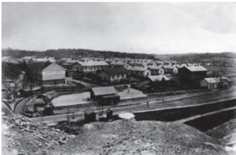
Ferdinandova kolonie v Michálkovicích okolo roku 1940.