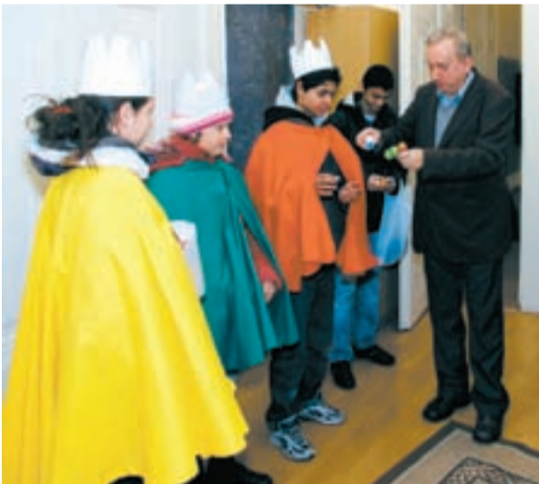
TRADICE. Tři králové letos navštívili i radnici. Starosty koledníky obdaroval sladkostmi.