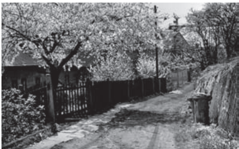
Kolonie na Františkově okolo roku 1950 - v pozadí lanová dráha - Důl Bezruč - Karolína.