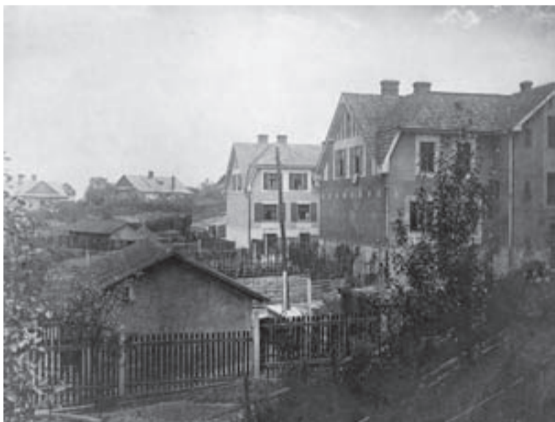
Kolonie na Burni ve 40. letech 19. století.