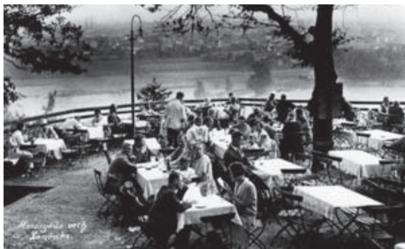
NA LANDEKU TO ŽILO. Landecká restaurace na petřkovickém katastru přibližně z roku 1924, v době, kdy byl Landek na krátké období ((1920 -1938), přejmenován na Masarykův vrch.

S koblouckou částí Landeku jsou také spojeny četné archeologické výzkumy. Landek má tak dvě tváře – industriální petřkovickou, spojenou s lovci mamutů, Venuší a hornickým muzeem a tajemně pohádkovou koblouckou, spojenou nejprve s hradiskem, pak s hradem, z něhož údajně vedla tajná