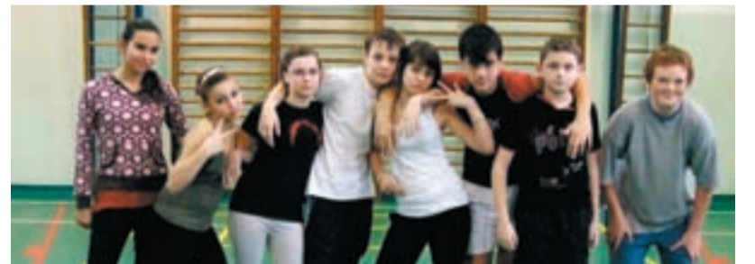
VÍTĚZOVÉ. Po zaslouženém vítězství si žáci užívali vánoční besídku, kde nechyběly dortíky a další laskominy.