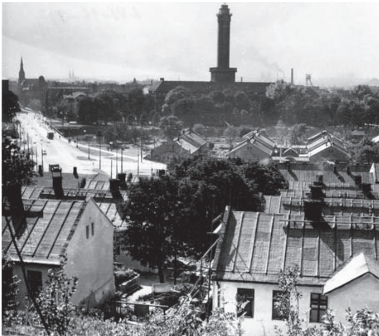
Kolone na Jaklovci - původní most Pionýrů, radnice před rokem 1976.