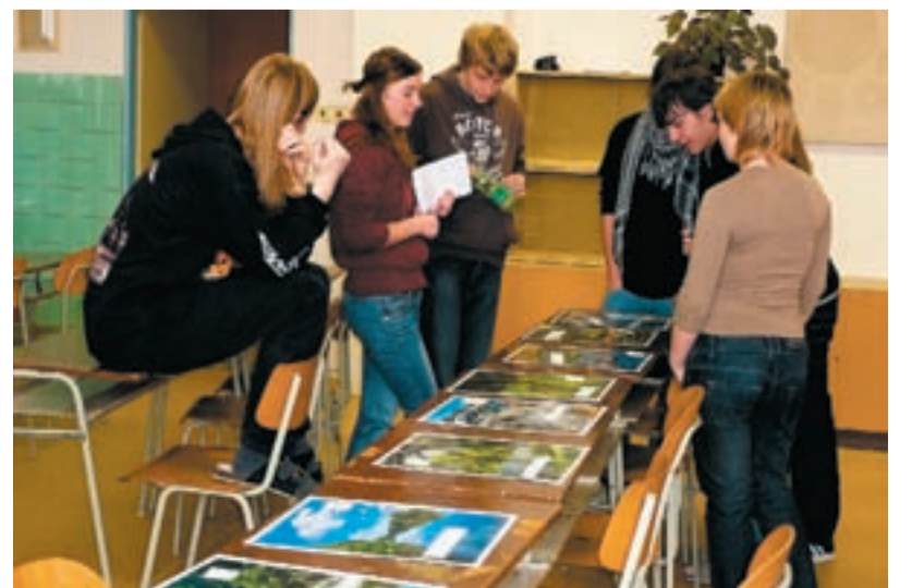
VÍTĚZOVÉ. Žáci Základní školy Pěší v Muglinově se zapojili na hladnovském gymnáziu do zajímavého soutěžení. A vyhráli.

A tak se „mistr dřevař“, jak mu hoši říkají, ani nemusel ptát, zda chtějí docházet pravidelně. Domluva byla okamžitá. (pm)