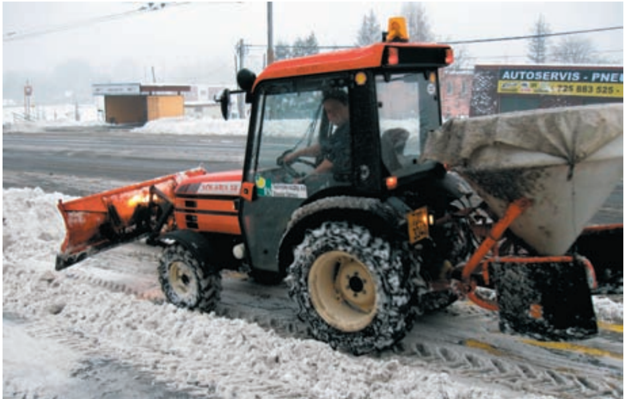
V AKCI. Letošní zimu zatím zvládá náš obvod bez větších problémů. Snímek zachycuje boj se sněhem v Muglinově.