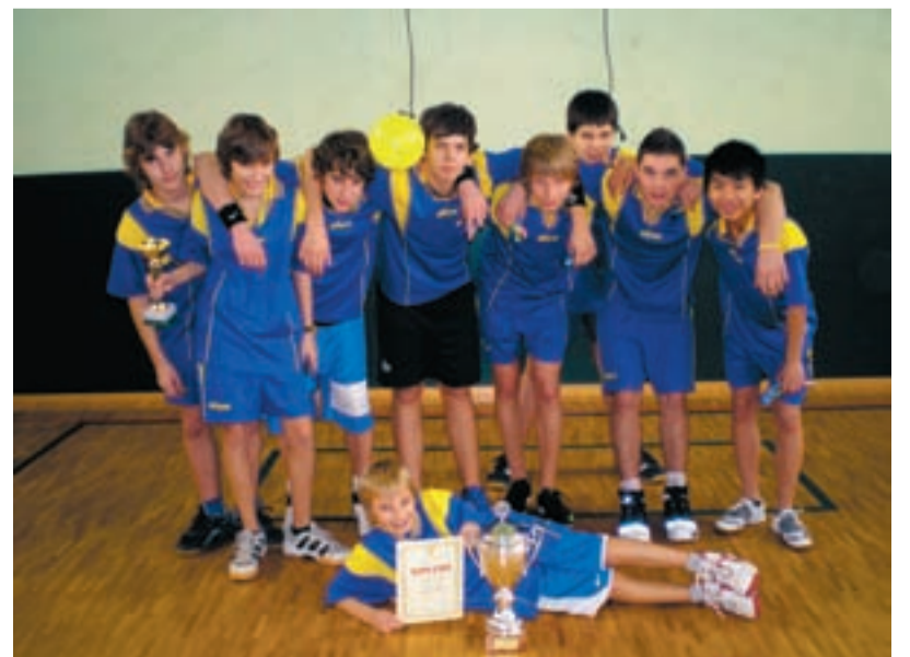
JAKO O ŽIVOT. Žáci základních škol předvedli za obrovské podpory diváků a fanoušků neuvěřitelné výkony.