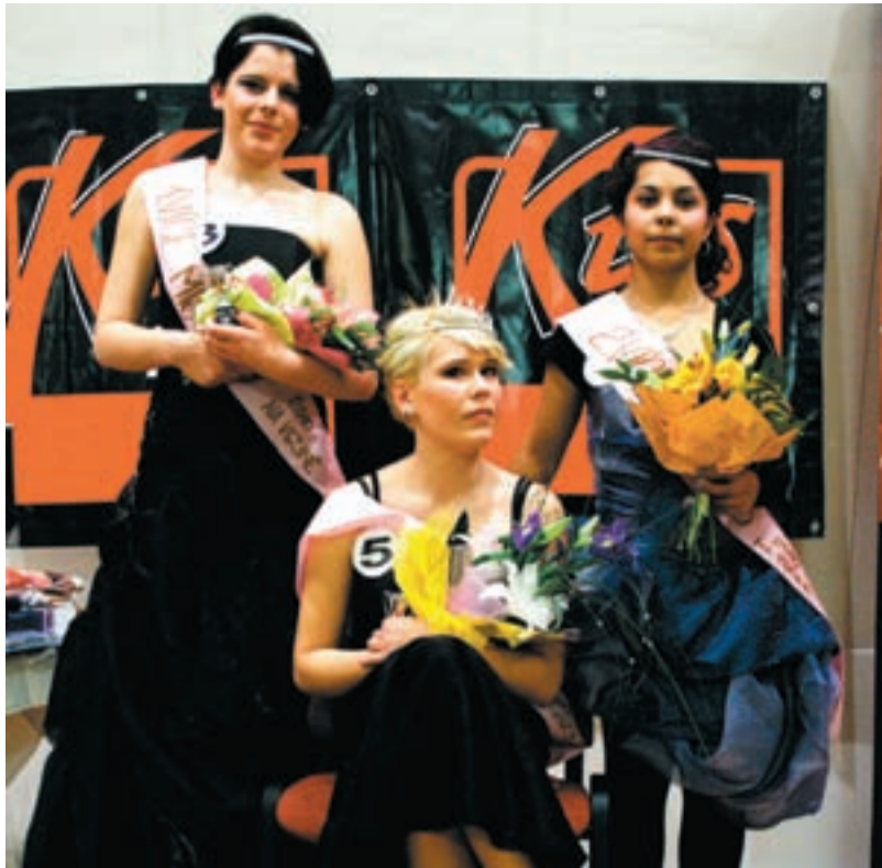
VÍTĚZKY. Snímek zachycuje vítězky soutěže Miss dětského domova.