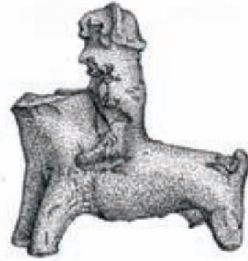
VZÁCNOST. Středověká keramická hračka - rytíř na koni, patrně z 13. - 15. století, naleziště z okolí hradu na Landeku (z publikace Landek - svědek dávné minulosti. Ostrava: Librex, 1996, str. 53).