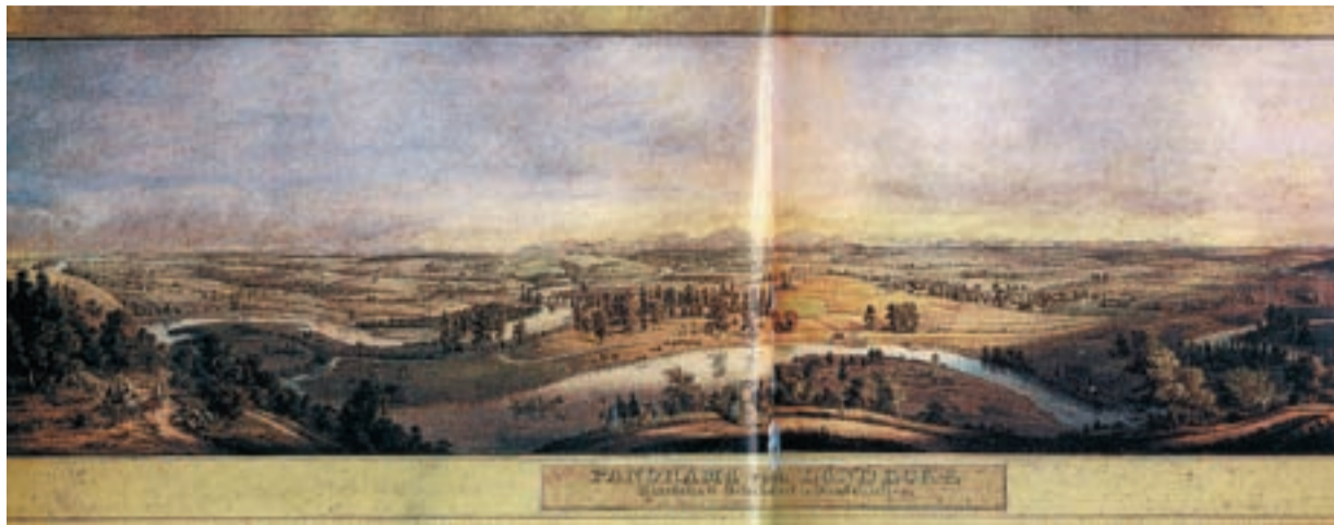
PANORAMA. Panorama von der Landecke - litografie W. E. Knippela z roku 1850 (z publikace Landek - svědek dávné minulosti. Ostrava: Librex, 1996, str. 8-9).

Kopec nad soutokem řeky Ostravice a Odry je plný tajemství