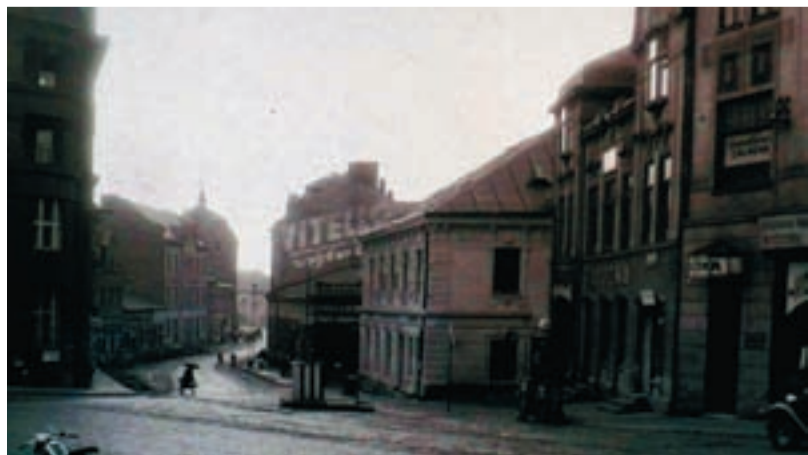
VZPOMÍNKY. Ulice, na kterou vzpomínají v článku jeho autorky a která lemovala dnešní Seidlerovo náměstí, je na snímku vlevo směrem dozadu hned za budovou bývalé spojitelný za Sýkorovým mostem. Ta stojí dodnes.