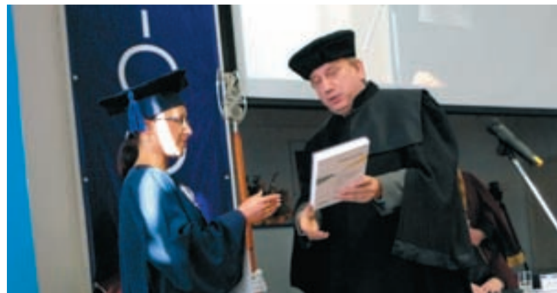
JUBILEJNÍ DIPLOM. Starosta Slezské Ostravy předal pamětní list studentce, která obdržela třítisící akademický titul na VŠP.