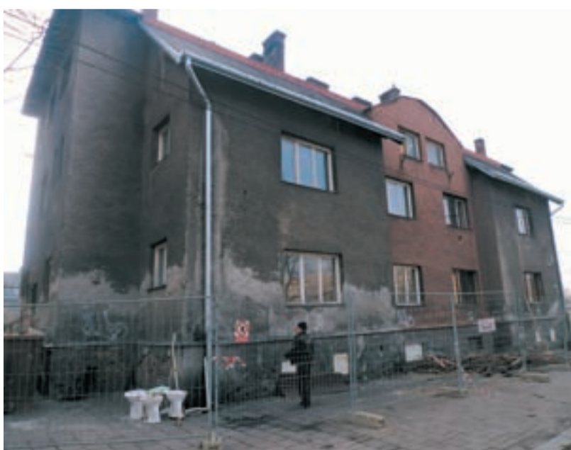
POMOC. Bytový dům na Liščině v Hrušově se začal měnit na moderní azylový dům. Staveniště hlídá bezpečnostní agentura.