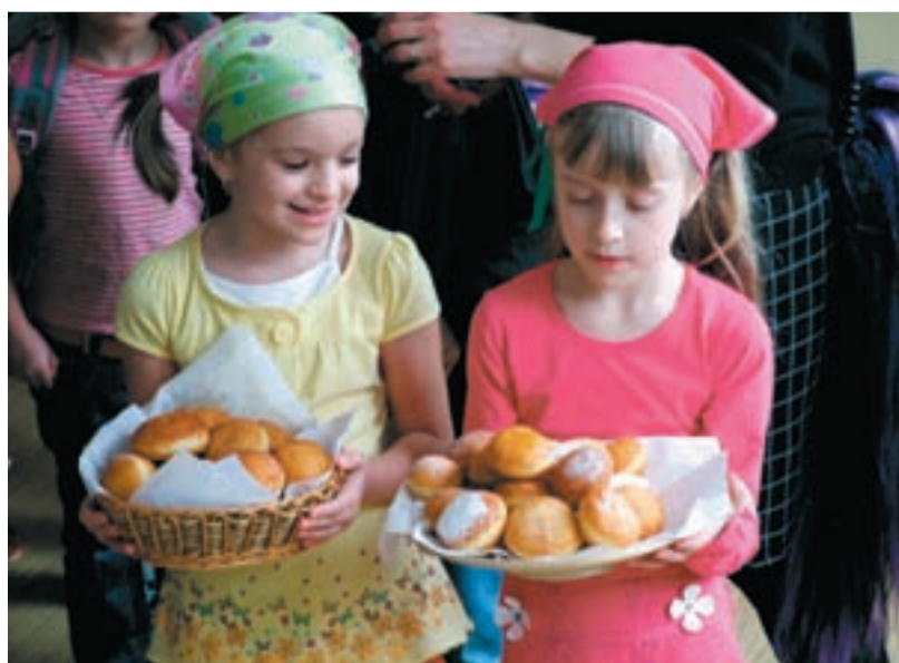
STÁLO TO ZA TO. Děti v ZŠ Chrustova si masopustního reje užily do sytosti.