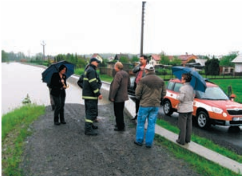
Vedení radnice mapovalo nepřetržitě aktuální situaci v terénu. Snímek je zachycuje v Koblově-Tabulkách na ulici U Štěrkovny.