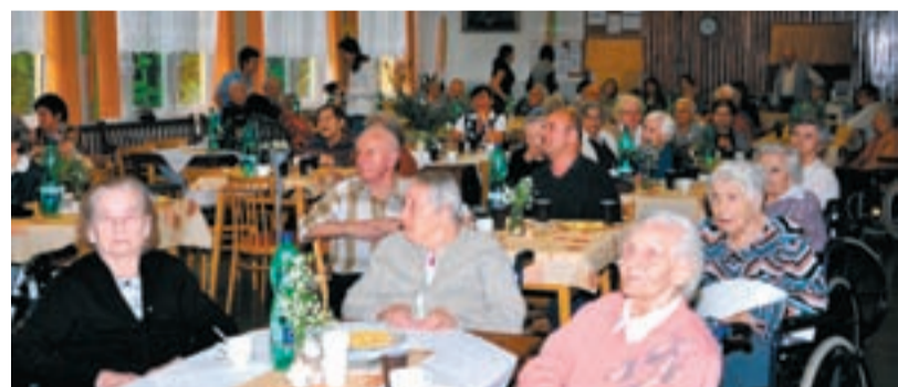
PŘÍJEMNÉ ODPOLEDNE. Babičky a dědečkové, kteří tráví podzim svého života v Domově seniorů na Kamenci ve Slezské Ostravě, strávili příjemné odpoledne.