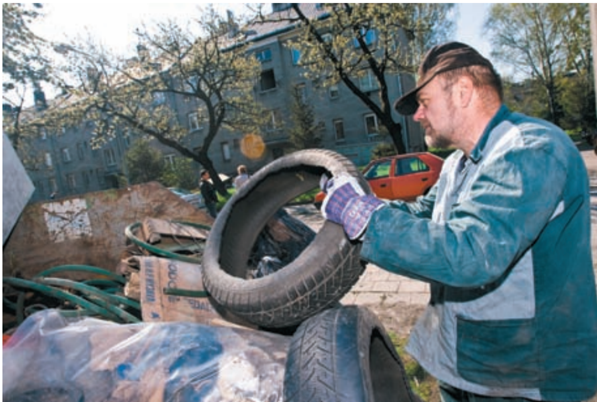
NADĚJE. Budou Kunčičky jednou místem, na který pamětníci vzpomínají s patřičnou nostalgií?