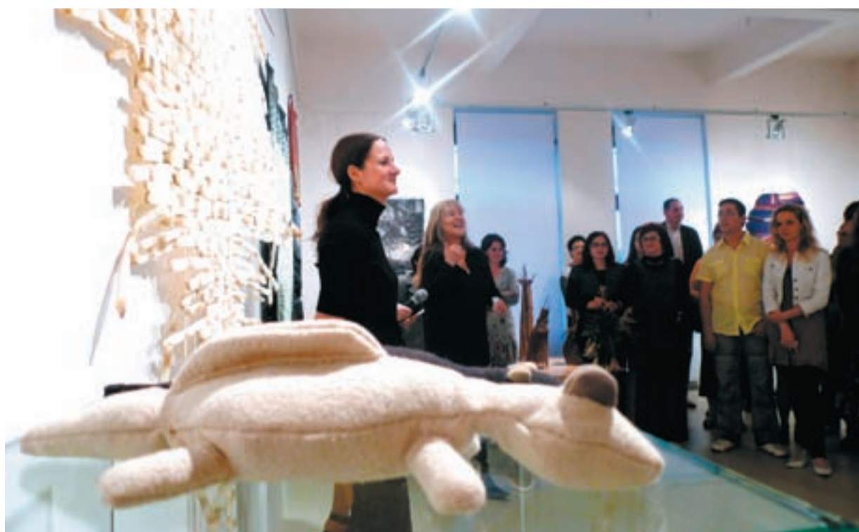
SPOLEČNĚ. Výstava byla zahájena slavnostní vernisáží, na které byli přítomni i studenti docentky Terčové.