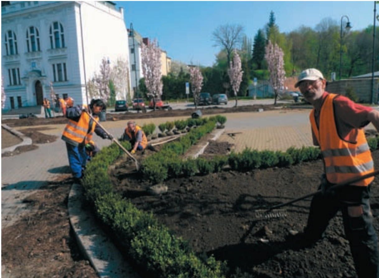
DO GALA. Pracovníci úřadu byli stejně jako pracovníci veřejné služby dnes a denně v terénu, aby zkrášlili okolí radnice.