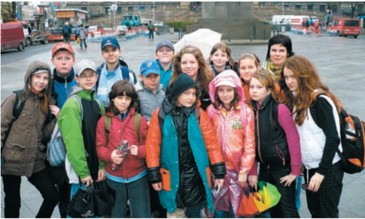
ZÁŽITEK. Pro žáky muglinovské základní školy byla návštěva Prahy velkým zážitkem.