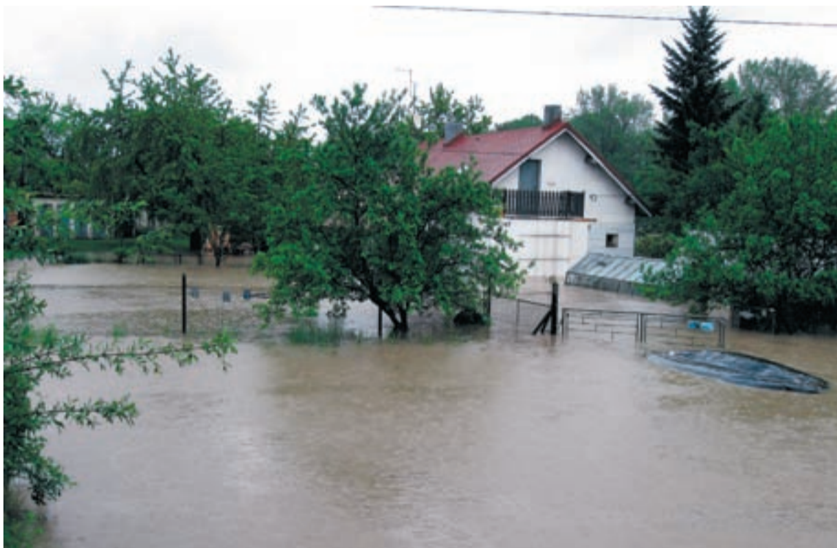
Z neděle na pondělí (17. 5.) zaplavila voda domy v Žabníku. Části povodňové hráze plavaly všude v okolí.