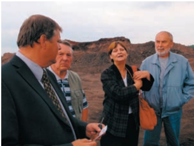
OJEDINĚLÁ VYCHÁZKA. Procházet se po hořící haldě se hned tak každému nepodaří.

HEŘMANICE/ Oáza klidu, pohody, odpočinku. Osada s lesoparkem, křovinami, zelení, cestičkami pro pěší i cyklisty, nebo lavičky. Toto je vize, jak by měla vypadat halda v Heřmanicích vedle rybníka po skončené rekultivaci tohoto území.