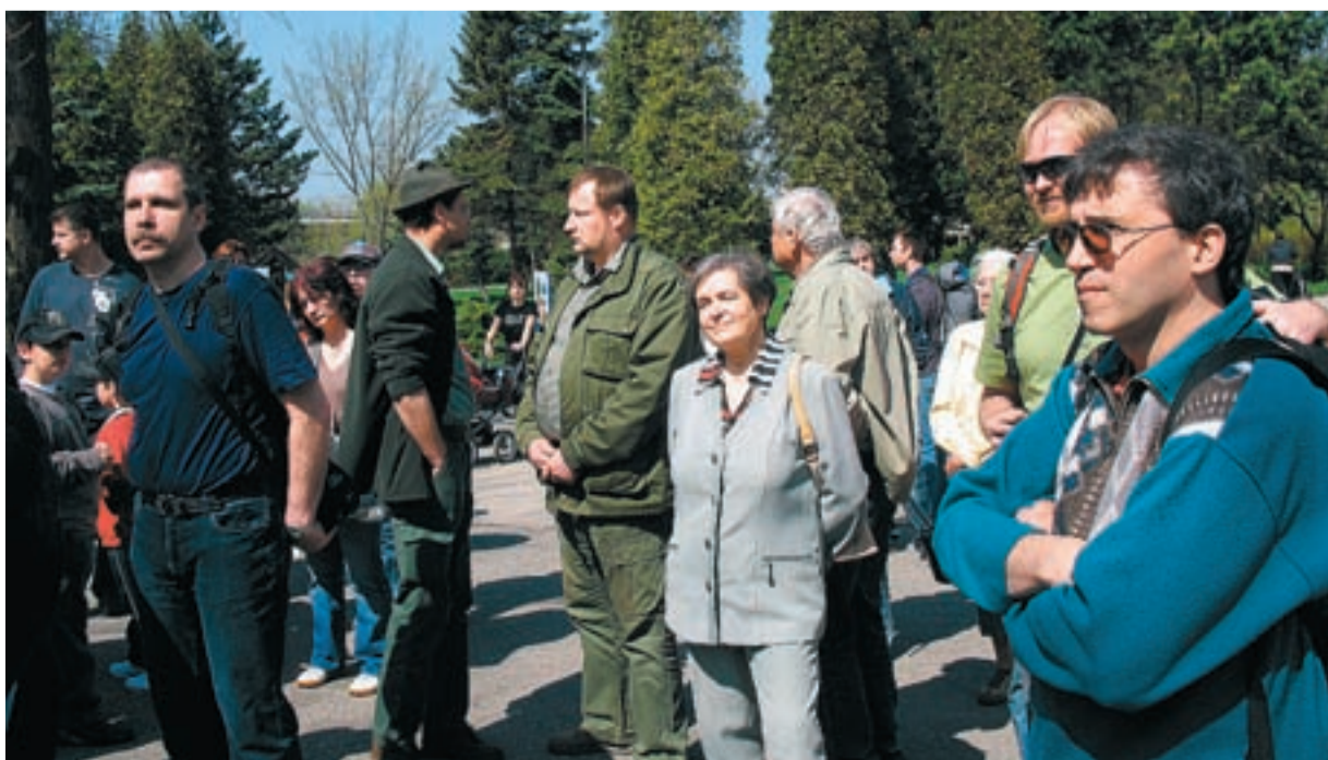
PROCHÁZKA S POUČENÍM. Slavnostního otevření naučné stezky se zúčastnilo na 500 turistů.