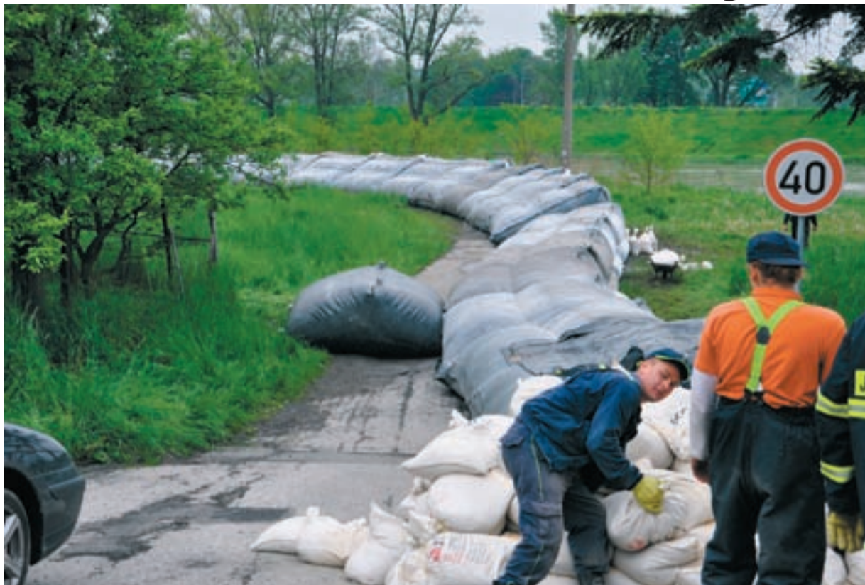
Provizorní protipovodňovou hráz začali hasiči stavět v pátek 14. června.