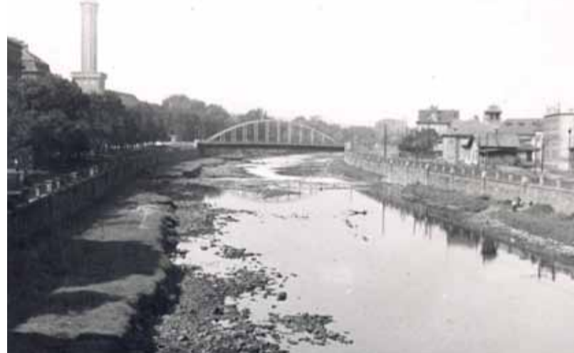
Most u Nové radnice z roku 1943. Jeho stavba byla dokončena v roce 1939. Později – před osvobozením Ostravy v roce 1945 – byl zničen Němci. Na nábřeží vpravo stojí budova fy Kofránek, okolí kina Palace a vila fy Špaček.