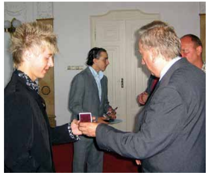
Pamatuje i na žáky čtyř slezskoostravských základních škol, s nimiž se vždy na konci školního roku loučí.