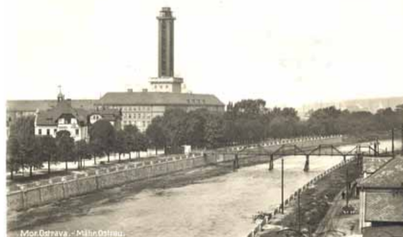
Dřevěná lávka pro pěší postavena po roce 1919. Byla součástí investic vložených do výstavby a obnovy ostravských komunikací v letech 1918 až 1925, tedy v době, kdy byl starostou Moravské Ostravy Janem Prokešem. Na jeho místě dnes stojí most Pionýrů.