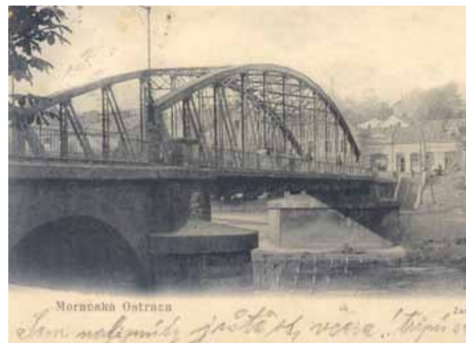
Takto vypadal ostravský Říšský most. Už v roce 1886 nahradil zřícený řetězový most. V provozu byl jen 27 let, poté byl zbourán a nahrazen mostem novým. Nový most z roku 1914, dnes známý jako Sýkorův most, patří svým technickým provedením k nejslavnějším evropským mostům.

Osudy spojovacích cest mezi moravskou a slezskou částí Ostravska nejsou nijak radostné.