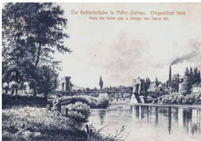
Málo reprodukováný pohled vídeňského litografa Jacoba Alta na řetězový most v Ostravě, postavený v letech 1851 – 1886. 20. října 1880 přešel most císař František Josef I., aby zhlédl následky povodně, které postihly Ostravu v srpnu téhož roku. Tento den pak připomínaly pamětní desky s českým a německým nápisem. Byly umístěny na pilířích řetězového mostu.