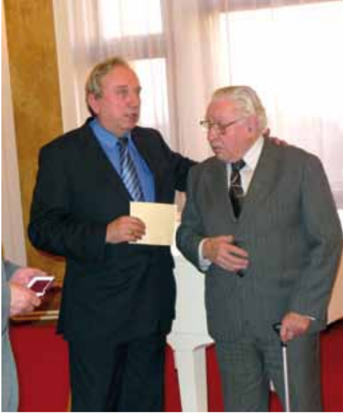
Každoročně před Vánoce oceňuje ty, kteří pro obvod nezištně pracují a pomáhají mu.