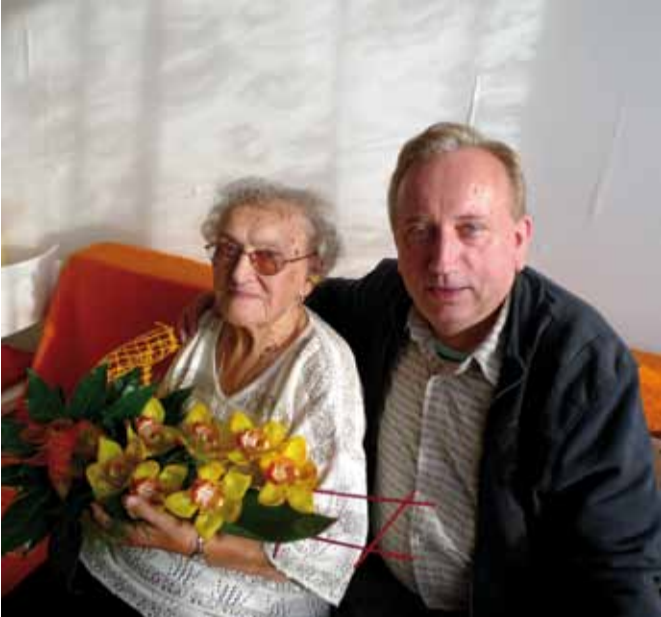
Velice rád se setkává s občany. I stoleté babičky dokáže rozesmát.