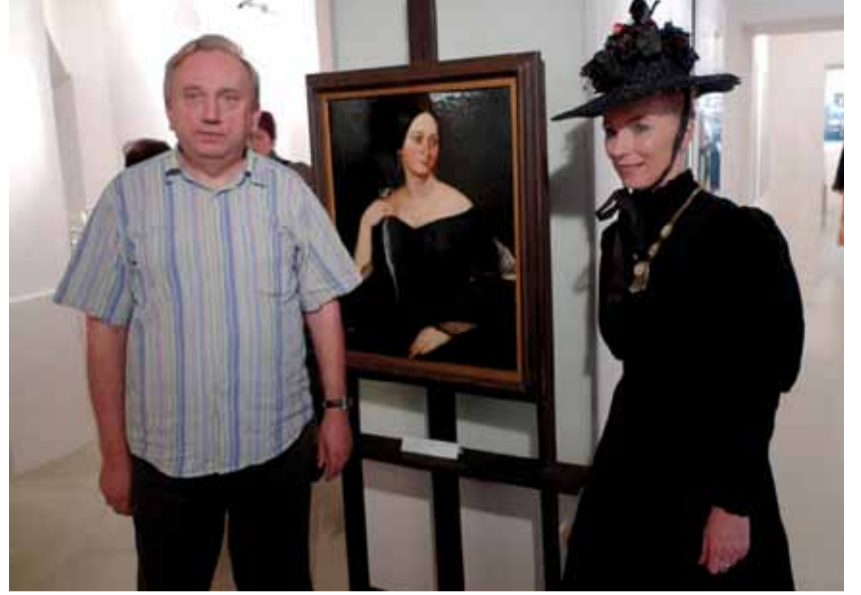
Je hrdý na to, že ve slezskoostravské radnici vznikla nádherná galerie, v níž se konají pravidelné výstavy. Tou nejuspěšnější zatím byla výstava o Boženě Němcové.