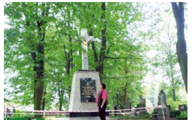
Nezapomínáme ani na naše hřbitovy, v Kunčičkách byl opraven kříž.