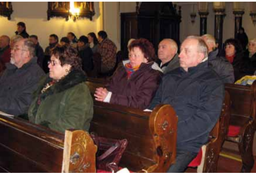
Není mu lhostejný osud historických památek, například hrušovského kostela, který zoufale volá o pomoc.