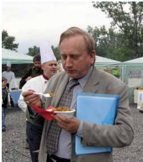
Každoročně pořádaný Den Slezské je už tradičně spojen se soutěží ve vaření slezského bigosu.