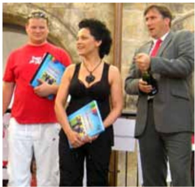
ÚSPĚCHY. Základní umělecká škola v Muglinově se může pochlubit vskutku nebyvalými úspěchy. Na snímku Lucie Bílá, která pokřtila knihu, v níž jsou i malby a kresby žáků této školy.