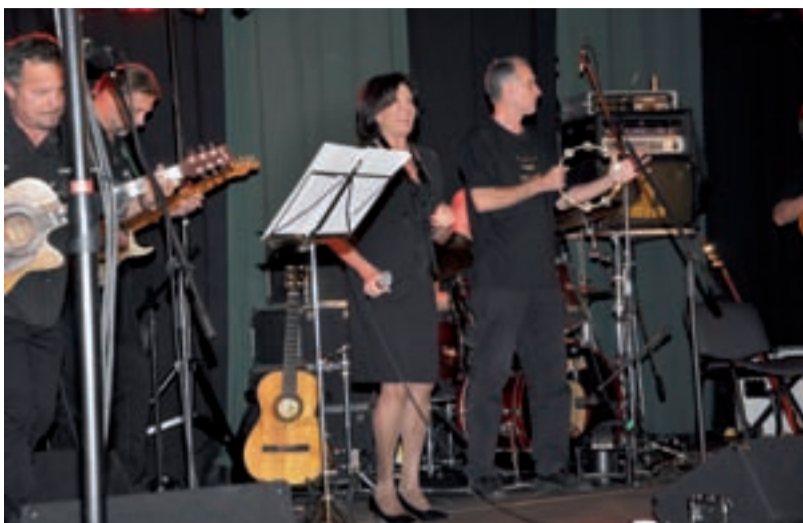
PODPORA. Benefiční koncert na záchranu kostela sv. Františka a Viktora uspořádala v říjnu 2010 zpěvačka Marie Rottrová.

Svým krásným hlasem a milým vystupováním vytvořila neopakovatelnou příjemnou a domácí atmosféru, která v závěru koncertu zvedla všechny přítomné ze židlí a odměnila rodačku z Hrušova bouřlivým potleskem.