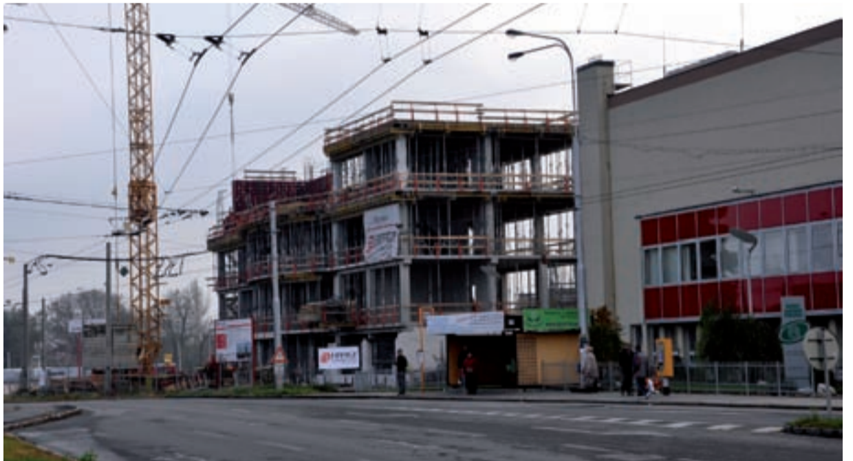
CO TAM BUDE? Na Michálkovické ulici je stavba nové administrativní budovy Revírní bratrské pokladny v plném proudu.