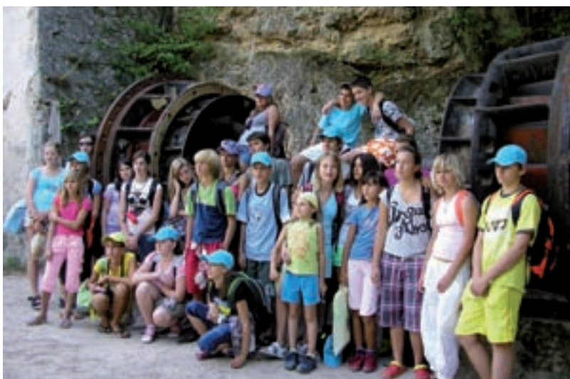
PŘÍJEMNÉ S UŽITEČNÝM. Vybraní žáci Základní školy Bohumínská navštívili v září chorvatský Murter.

a sluníčka, nafotili spoustu krásných fotografií, odvezli si suvenýry, kontakty na chorvatské kamarády a snad i plno krásných vzpomínek. (zšb)