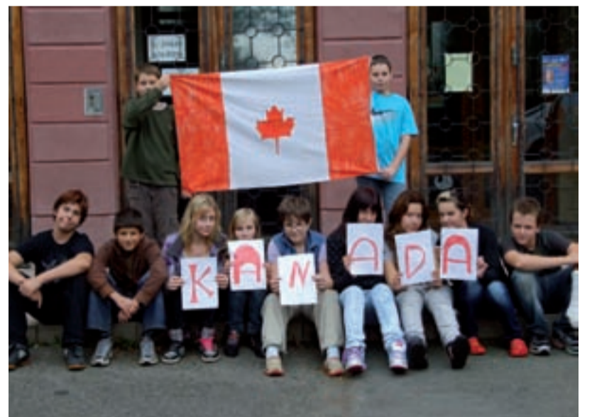
FANDOVÉ. Žáci Základní školy Chrystova prožívali mistrovství světa v basketbalu žen naplno.

HEŘMANICE/ Sportovní fanoušci, obzvláště pak ti basketbaloví, měli nedávno o zvýšenou dávku adrenalinu postaráno. Těžko někdo mohl nepostřehnout mistrovství světa v basketbalu žen 2010, jehož hostitelem byla Česká republika po dlouhých 43 letech.