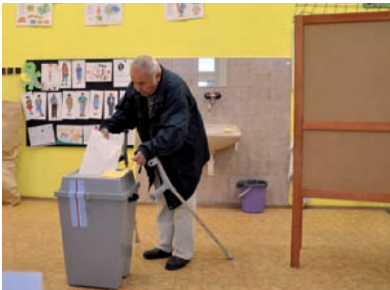
ROZHODNUTO. Slezsko-ostravští občané volili stejně jako v květnu při volbách do Parlamentu České republiky v celkem 27 volebních místech městského obvodu.

Občané všech osmi katastrálních území Slezské Ostravy volili ve 27 volebních místech. Nejnižší účast zaznamenaly už tradičně volební okrsky na Liščině v Hrušově (19,48 %), na Riegrově ulici v Hrušově (20,60%) a v Základní škole Škrobálkova v Kunčičkách (22,24%).