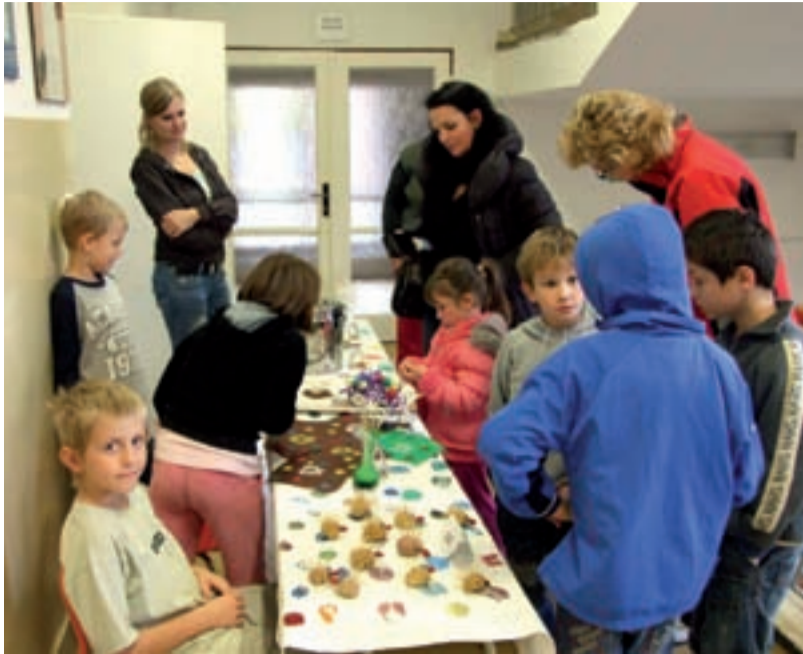
ZMĚNA. Zatímco v minulých letech se konaly v ZŠ Chrustova jablečné dny, letos je nahradily dny bramborové.

Tyto a mnohé další pochutiny si mohli žáci, učitelé i rodiče a příbuzní nakoupit ve stáncích od třetí hodiny odpo-