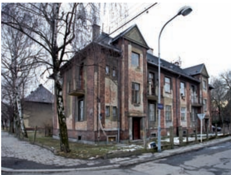
PŘED A PO. RPG se v posledním roce pustila do rozsáhlých rekonstrukcí svých domů. Snímky nahoře zachycují jeden z domů před rekonstrukcí a po ní.