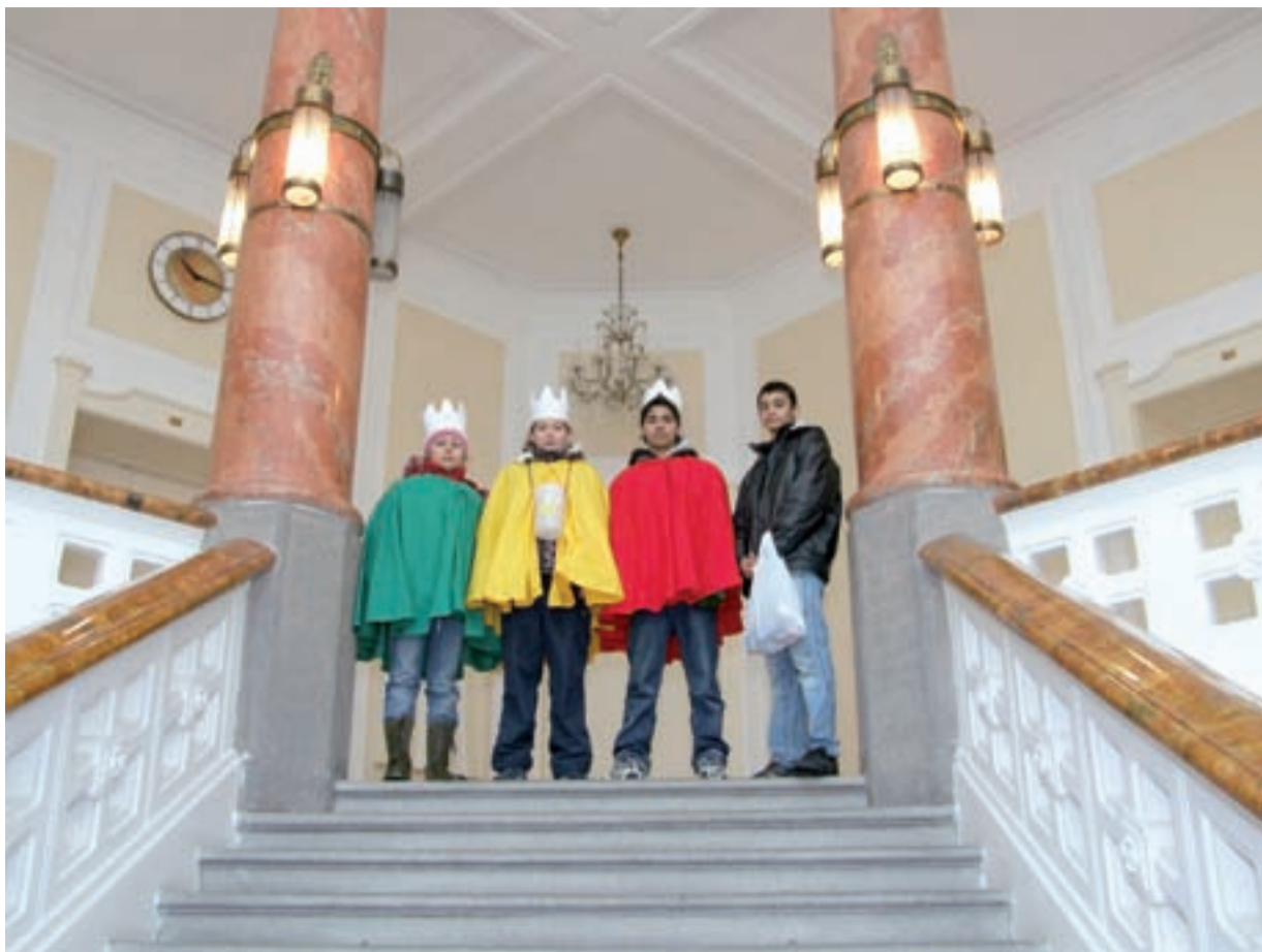
MY TŘI KRÁLOVÉ. Malí koledníci navštívili loni i slezskoostravskou radnici na těšínské ulici.