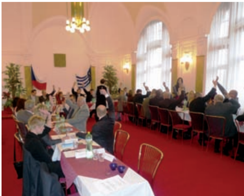
ZASEDÁNÍ. Ustavující zastupitelstvo pro volební období 2010 – 2014 se konalo v obřadní síni slezskoostrovské radnice.