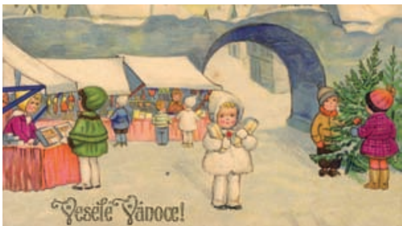
VÁNOCE. Vánoční stromečky jsou neodmyslitelným symbolem Vánoc do dneška.