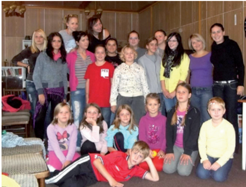
Soustředění. Zpěváčci ladili hlasivky v horské chatě Svoboda.