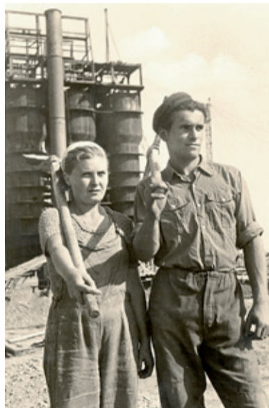
Mladí budovatelé socialismu