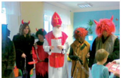
MIKULÁŠ. Děti dostaly nejen sladkosti.

V dopoledních hodinách dne 5. prosince se v mateřských školách Jaklovecká, Keramická a Komerční objevil v doprovodu čertů a andělů Mikuláš. Příchod této pohádkové družiny a zejména přítomnost čertů vyvolal v některých dětech obavy a pocit strachu, který se ovšem velice brzy vylítl. Čerti si totiž žádné z dětí