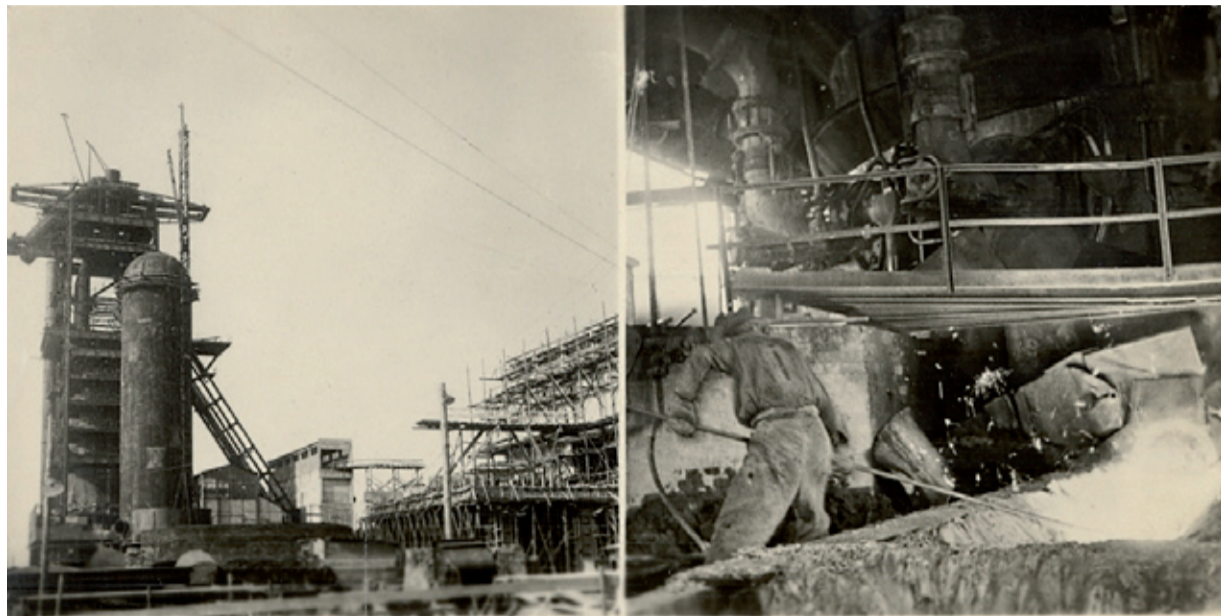
Sběrem šrotu, zvýšenou výrobou železa a oceli zajistíme úspěch pětiletky