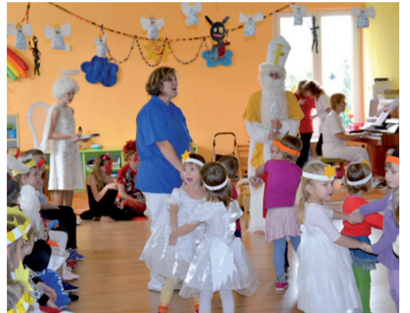
KAMENEC. Vlídná tvář Mikuláše všechno zvládla.