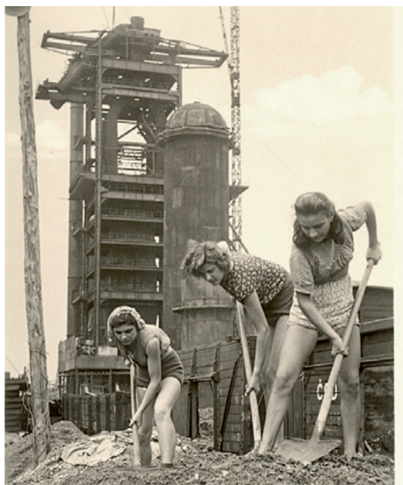
Na Směně míru