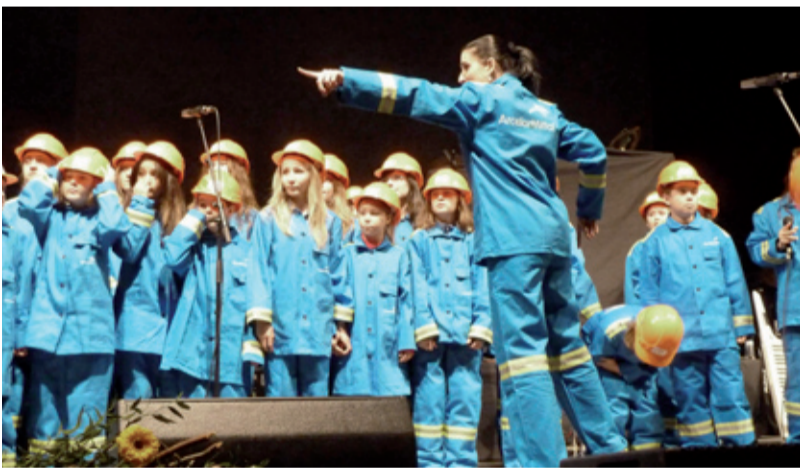
MEGAKONCERT. Děti ze ZŠ Chrustova obohatily posluchače.

„Byla to dlouhá cesta.“ Tak hodnotí děti úspěšně zakončený projekt, který byl doprovázen nevidaným úspěchem. Tato cesta začala přizváním do projektu AMgospel. Nikdo netušil, co od tohoto pozvání očekávat a především, kolik práce bude třeba udělat. Po poctivém nacvičování na soustředění v místě Ostravice – chata Svoboda, které bylo umožněno díky grantovému příspěvku města Ostravy, měli žáci „našlápnuto“ na dobrý výkon. Jak ale víme, děti se slůvkem „dobrý“ leckdy nespokojí, proto cvičily a zpívaly dále. Společně zkoušky se