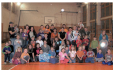
OLYMPIÁDA. Příjemné a veselé odpoledne v ZŠ Pěší.

sladké odměny. Po zdárném zvládnutí všech sedmi soutěžních dis-