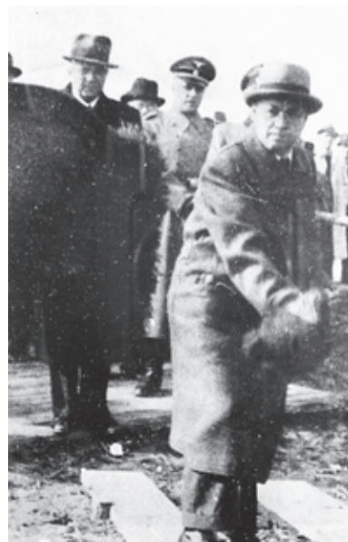
Doposud nikdy nepublikovaná fotografie. Kdo je muž se smrtihlavem na čepici?

v areálu probíhaly nepřetržitě. Podle slov pamětníků prý byla bezpečnost práce na tak nízké úrovni, že nikdo již nespočítá, kolik lidí zůstalo zabetonováno v mohutných základech vysokých pecí nebo ocelárny.