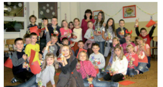
BESÍDKA. Dárečky čekaly za dveřmi.

V pondělí 5. prosince se uskutečnila ve školní družině na ZŠ Pěší Mikulášská besídka pro žáky školní družiny. Zúčastnilo se jí třicet žáků, kteří zábavné odpoledne zahájili tanečky za doprovodu šmolich písniček a pohybovými soutěživými hrami. Děti pak soutěžily ve skupinách o nejděší vánoční řetěz a obdobných disciplínách. Bohužel Mikuláš ani čerti osobně za dětmi nedorazili, ale dárečky děti našly i s dopisem za dveřmi. Musely