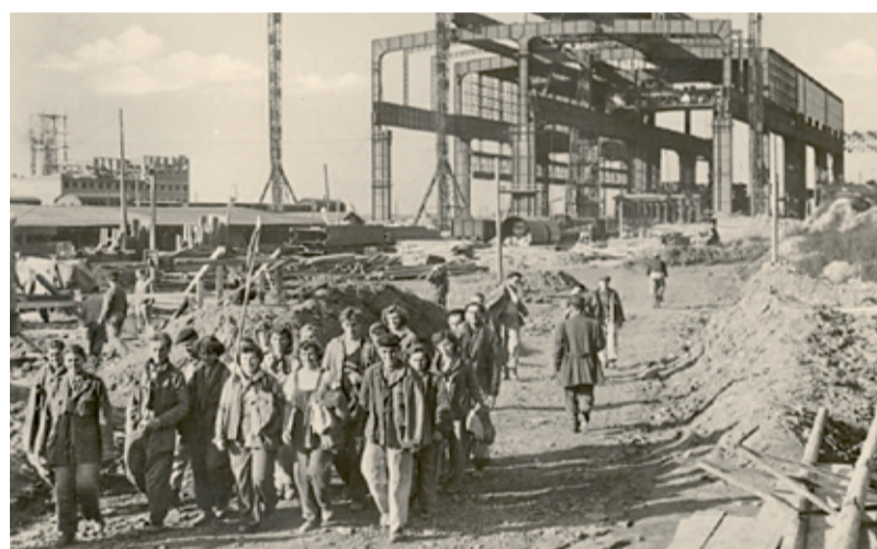
Odchod brigádníků ze směny