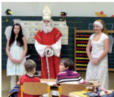
CHRUSTOVA. Mikuláš s doprovodem obešel všechny třídy.

Svátek svatého Mikuláše je pro děti jedna z nejoblíbenějších tradic. Proto jsme ji nesměli opomenout ani letošní rok. Mikulášské nadílky se ujali žáci 9. A, kteří v klasickém seskupení Mikuláš, čert a anděl obdarovali 5. prosince svou přítomností postupně všechny třídy na naší škole. Nebyla opomenuta ani mateřská škola Chrustova, na kterou kostýmy slavného tria udělaly snad největší dojem. Mikulášův pomocník anděl, představitel dobra, naděloval hodným dětem