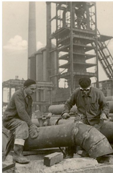
Sváření kolen pro čističe plynů