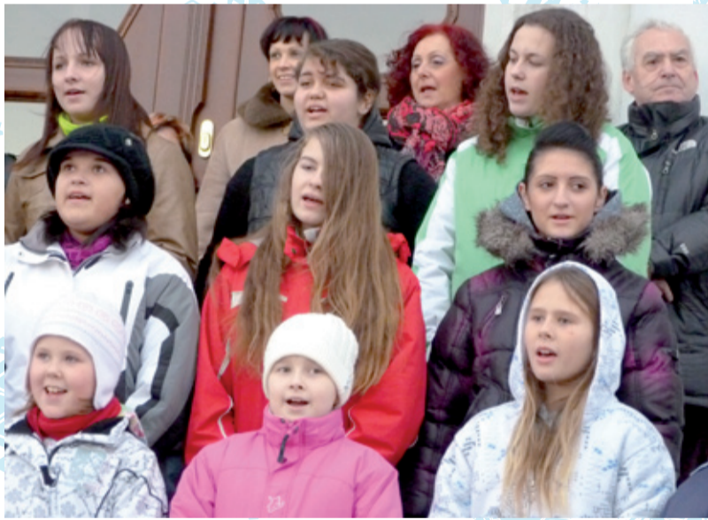
KOLEDY. Pěvecký sbor zpívá před radnicí.

„Rok utekl a člověku ani nepříjde, že jsme se tak dlouho neviděli,“ pozdravila všechny místostarostka MUDr. Hana Heráková. Popřála všem veselé a hezké Vánoce a také