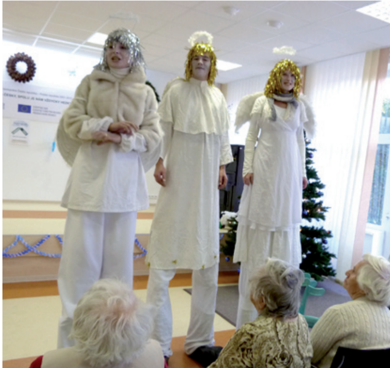
VÁNOCE. Senioři přišla navštívit trojice andělů.