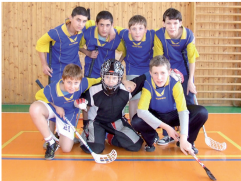
FINALISTÉ. Florbalisté ze ZŠ Pěší jsou v městském finále.