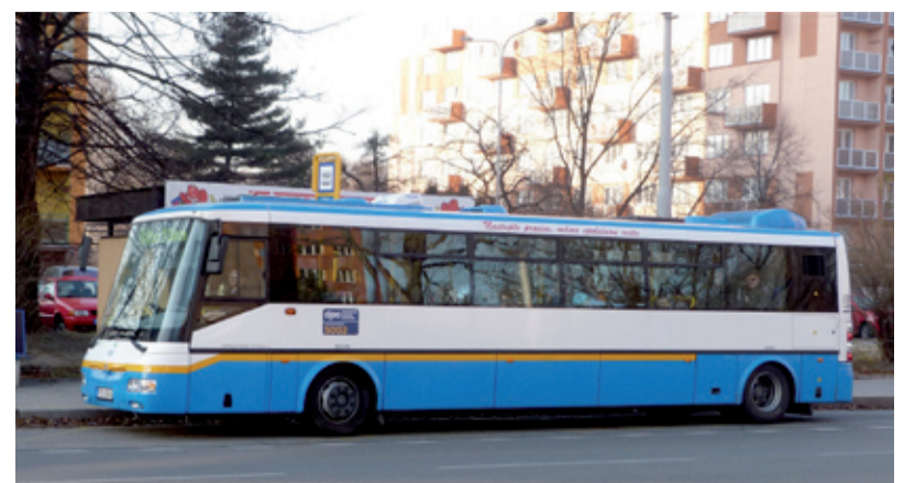
BEZ EMISÍ. Elektrobuses brázdí i Slezskou Ostravu.

statutárního města Ostravy,“ informuje Miroslav Albrecht a dodává, že vedení Dopravního podniku na základě provedených výzkumů předpokládá jejich trvalé nasazení do provozu právě na lince číslo 22. Ta jezdí z Hranečnicku přes Slezskou Ostravu až na zastávku Most Miloše Sýkory. „Je pravděpodobné, že se zvyšujícím se počtem pořízených elektrobuse se bude navyšovat také jejich počet v provozu na území Slezské Ostravy,“ uvádí mluvčí. /red/