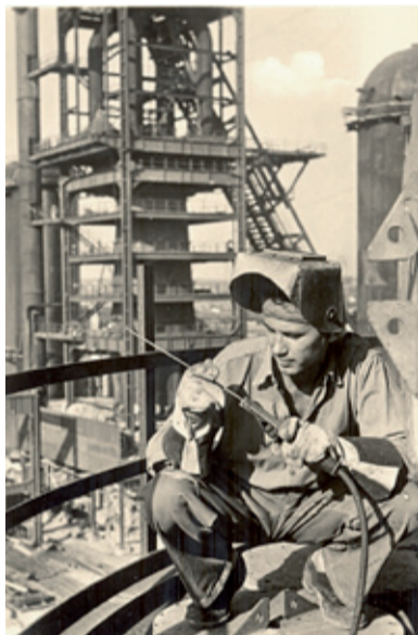
Svářeč na stavbě