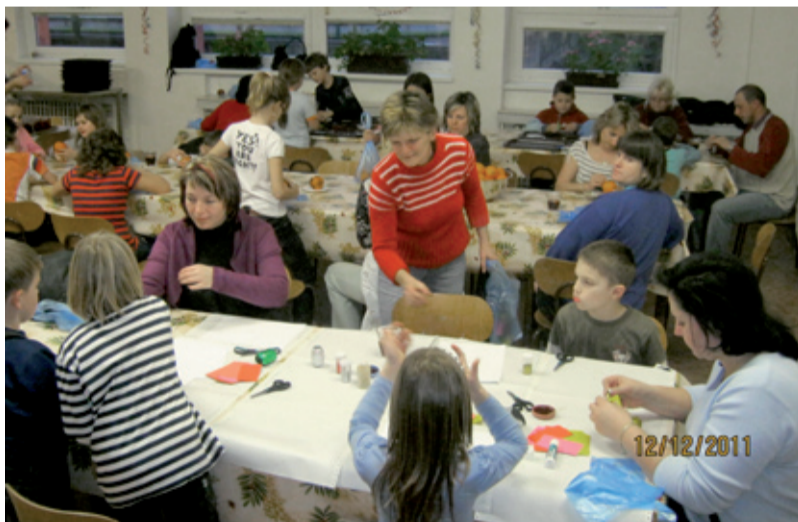
TVOŘENÍ. Děti s rodiči a předvánoční práce.