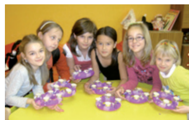
ADVENT. Děti připravily adventní věnce.