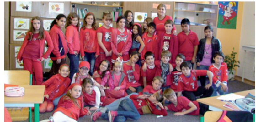
ZLATÁ MRKEV. Účastníci projektu přemýšleli, jak žít zdravě.

V týdnu od 9. do 15. listopadu se konal ve 4. třídě ZŠ Pěší projekt „Zlatá mrkev“.