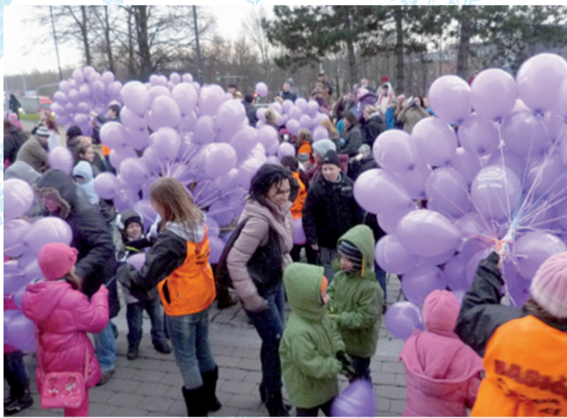
PŘED LETEM. K vypuštění připraveno 1100 balónků.

Mezitím mladí hasiči vynesli z chodby slezskostravské radnice přesně 1100 balónků a rozdali je přítomným dětem a také dospělým. Krátce po 15. hodině a 15. minutě nebe nad slezskostravskou radnicí zřivalovělo. To když všichni své balonky za velkého nadšení vypustili směrem vzhůru.