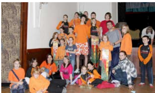
HASIČI. Mladí hasiči z Heřmanic v uzlování uspěli.