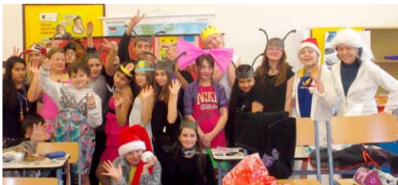
DIVADÉLKO. Na ZŠ Pěší se umění daří.