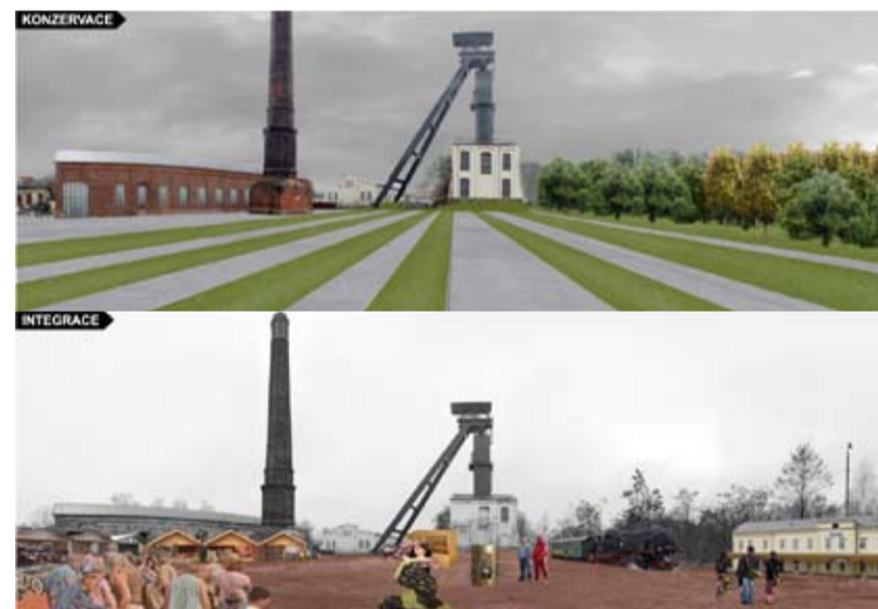
Workshop Alexander – konzervace/integrace

Pokládáte za možné, že některá z Vámi předložených studií se skutečně na Slezské dočká realizace?