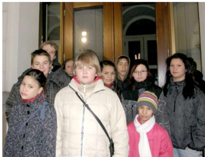
V DIVADLE. Děti ze Slezské si prohlédly ostravská divadla.