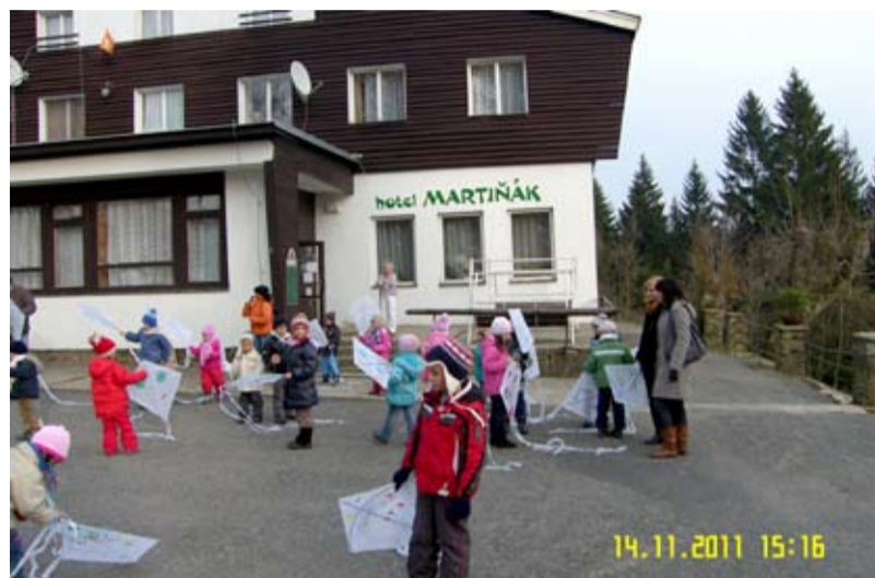
S DRAKY. Před chatou Martiňák nástup s draky.