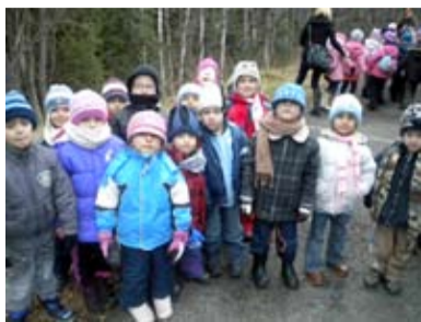
V BESKYDECH. České a polské děti vyrazily společně do hor.

SLEZSKÁ OSTRAVA/Vše začalo 15. září na Slezskoostravském hradě. Sešly se zde ředitelky mateřských škol z polských Gorzycek a Slezské Ostravy, aby zahájily společný česko-polský projekt.