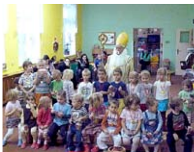
PORADA. Starší vysvětlují mladším, co je vlastně čeká.