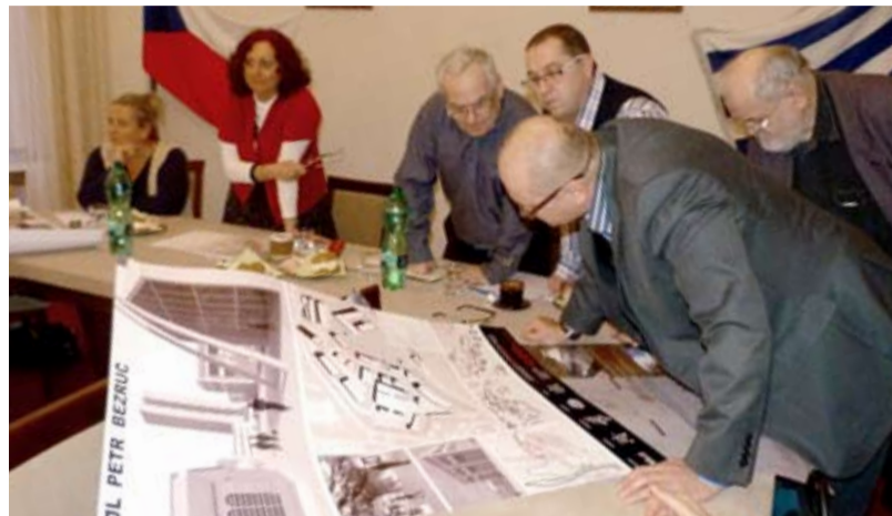
BUDOUCNOST SLEZSKÉ. Zástupci Slezské Ostravy si prohlížejí nápady architektů z VŠB-TU.