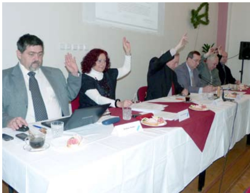
ROZPOČET. Zastupitelé městského obvodu schválili rozpočet pro Slezskou Ostravu.

zřízené městským obvodem Slezská Ostrava, a to mateřské a základní školy. Tak jako v roce 2011 je i v letošním roce pro každou