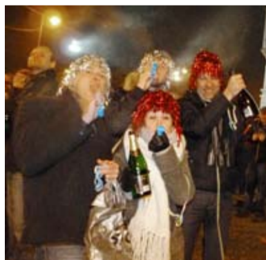
PŮLNOC. Oslavit Silvestra přišly na Slezskou stovky občanů.

Na příchozí čekalo skutečně silvestrovské překvapení. Pár desítek minut před půlnocí nechal starosta