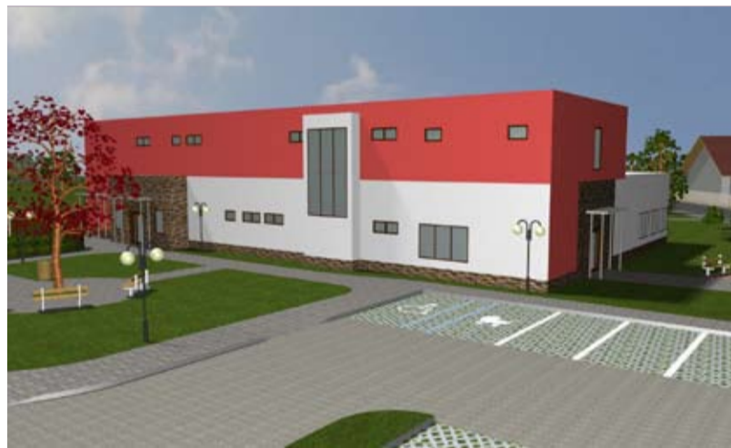
Návrh víceúčelového objektu na ul. Hladnovské, Slezská Ostrava