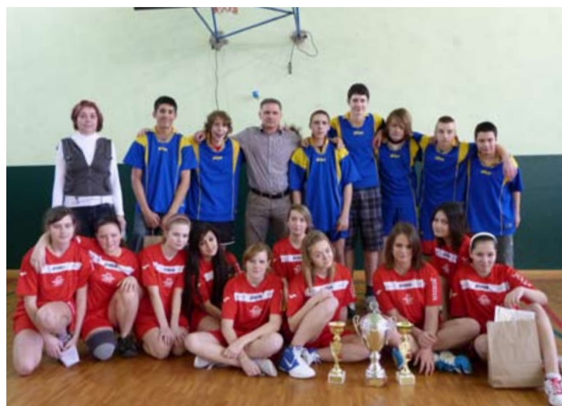
ZŠ BOHUMÍNSKÁ. Obě družstva školy tentokrát nejlepší.

Škrobálkova,“ hodnotila vývoj turnaje místostarostka Heráková. Vedení obvodu se postaralo o svačinky pro sportující, stejně jako o různé odměny, což byly většími sladkosti na doplnění kalorií.