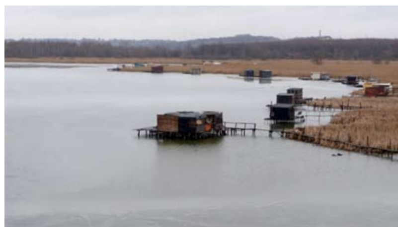
POHLED Z HALDY. Ze sousední haldy lze vidět rybník celý.

„Vedlejší halda je dlouhodobý problém, ale čolek velký si v rákosinách a tůňích kolem rybníku dokázal najít místo pro život,“ uvádí Jan Filgas. Velkým problémem jsou podle Filgase černé skládky, které kolem rybníku často vznikají. „Tím, že se kolem rybníku vytvoří stezky a zpřístupní se lidem, budou ta místa pod mnohem větší veřejnou kontrolou,“ slibuje si Filgas, že