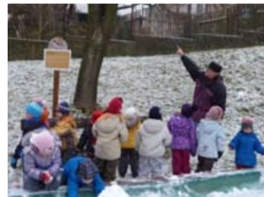
DĚTEM. Přednáška pro děti v MŠ Komerční aneb na co je ptačí budka.

takového mohl u Ostravice vidět. A stejně tak i různé druhy racků, kormorány, volavky nebo labutě. Vidět dřívě morčáka velkého, to byla velká rarita. Nyní je na Slezské u soutoku Lučiny a Ostravice často i celé hejno. Je to nádherně zbarvená kachna.