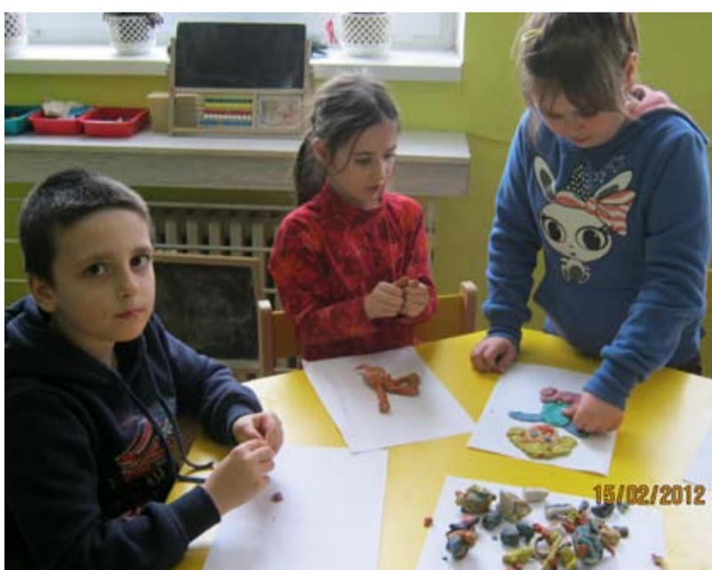
POHÁDKA. Děti modelovaly pohádkové postavičky z plastelíny.