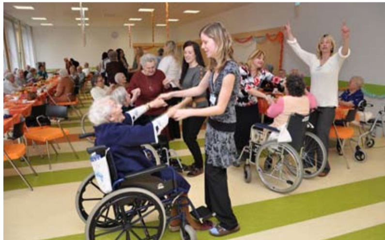
NA PLESE. Veselé chvíle zažívali obyvatelé Domova pro seniory Kamenec.

jsme při něm oslavili MDŽ a vzpomněli si tak na naše maminky i partnerky.