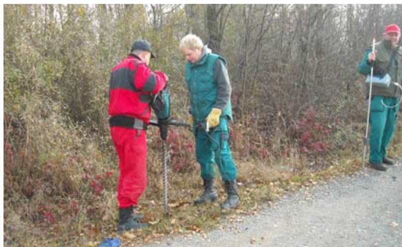
MĚŘIČI. Muži se speciální soupravou měří metan pod Slezskou Ostravou.