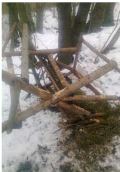
KRMELCE. Poničený krmelec museli opravovat heřmaničtí myslivci.