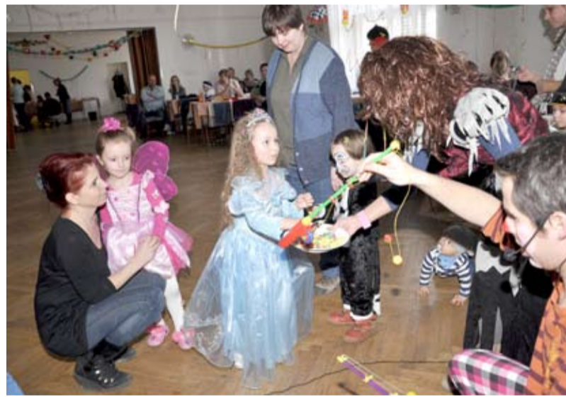
NAPŘÍČ POHÁDKAMI. Děti zažily zábavnou sobotu s čarodějnicí a popleteným Miloušem.