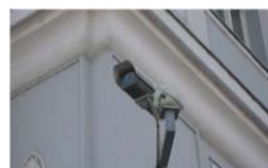
MONITORING. Nové kamery městské policie hlídají Kunčičky.

O čtyři nové kamery byl v uplynulých dnech rozšířen městský kamerový monitorovací systém. Kamery byly umístěny v městské části Kunčičky. Monitorují zde dění v lokalitách, kde ve větší míře dochází k narušování veřejného pořádku a páčání trestné činnosti. Vyhodnocovací pracoviště pro tyto kamery se nachází na pracovišti městské policie ve Slezské Ostravě