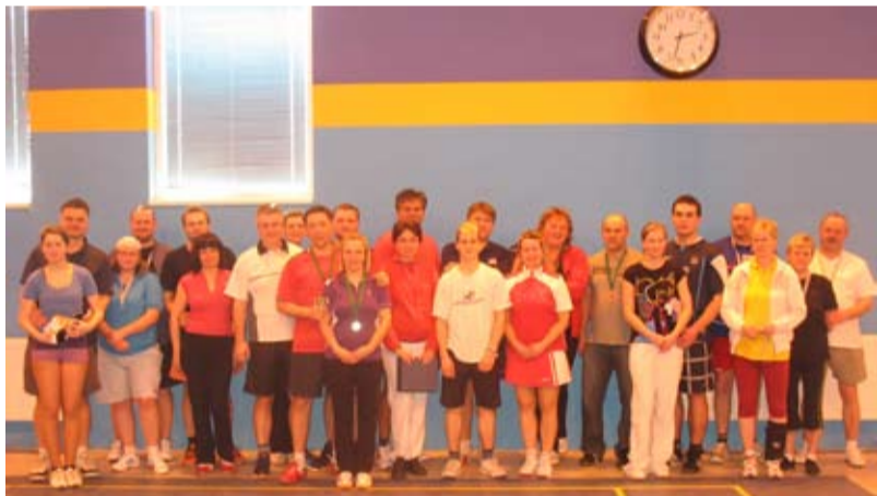
BADMINTON. Druhý ročník turnaje smíšených čtyřher v badmintonu uspořádal Tenisový klub Antošovice.

Tenisový klub Antošovice uspořádal třetí březnovou sobotu ve sportovním areálu Ridera v Ostravě-Vítkovicích již druhý ročník badmintonového turnaje smíšených