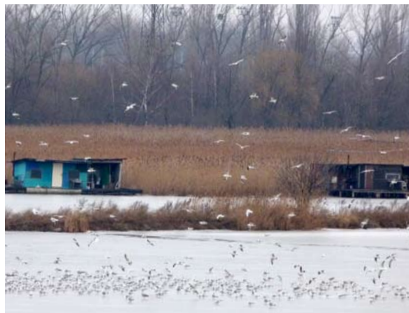
HEŘMANICKÝ RYBNÍK. Voda, rákosí a ptáci. Heřmanický rybník je vzácnou lokalitou.

Zasedání zastupitelstva městského obvodu se uskuteční 12. dubna 2012 od 9.00 hodin v KD Muglínov, ulice Na Druhém č. 4