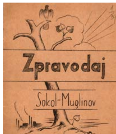
ZPRAVODAJ. Nález z muglinovské sokolovny. /jk/

Přestože válka byla už velmi blízko, dokázali se tehdy Sokolové v Muglinově bavit. Pod titulkem Divadlo hlásí se k životu zpravodaj informoval, že „režisér bratr Józsa Dobeš připravuje pro nejbližší dobu dvě divadla: dne 5. března veselohru o třech jednáních „Šťastní otcové“ a dne 30. dubna veselou operetu „Cestička k nebi“. Jestli se plánovaná představení odehrála, jasně není, ale komu pravděpodobně to není. Už 14. března 1939 začala německá vojska okupovat Ostravu. Muglinovští sokolové se také dle svého zpravodaje svědomitě chystali na oslavu dvaceti let založení zdejší jednoty, což se mělo odehrát 22. února 1940. Na oslavy už nedošlo. Sokol, stejně jako ostatní podobné organizace, byl okupanty úředně rozpuštěn.