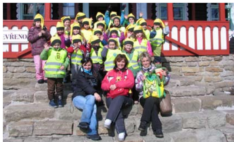
KOBLOVÁČCI. Skřítkci z Koblova navštívili Pustevny.