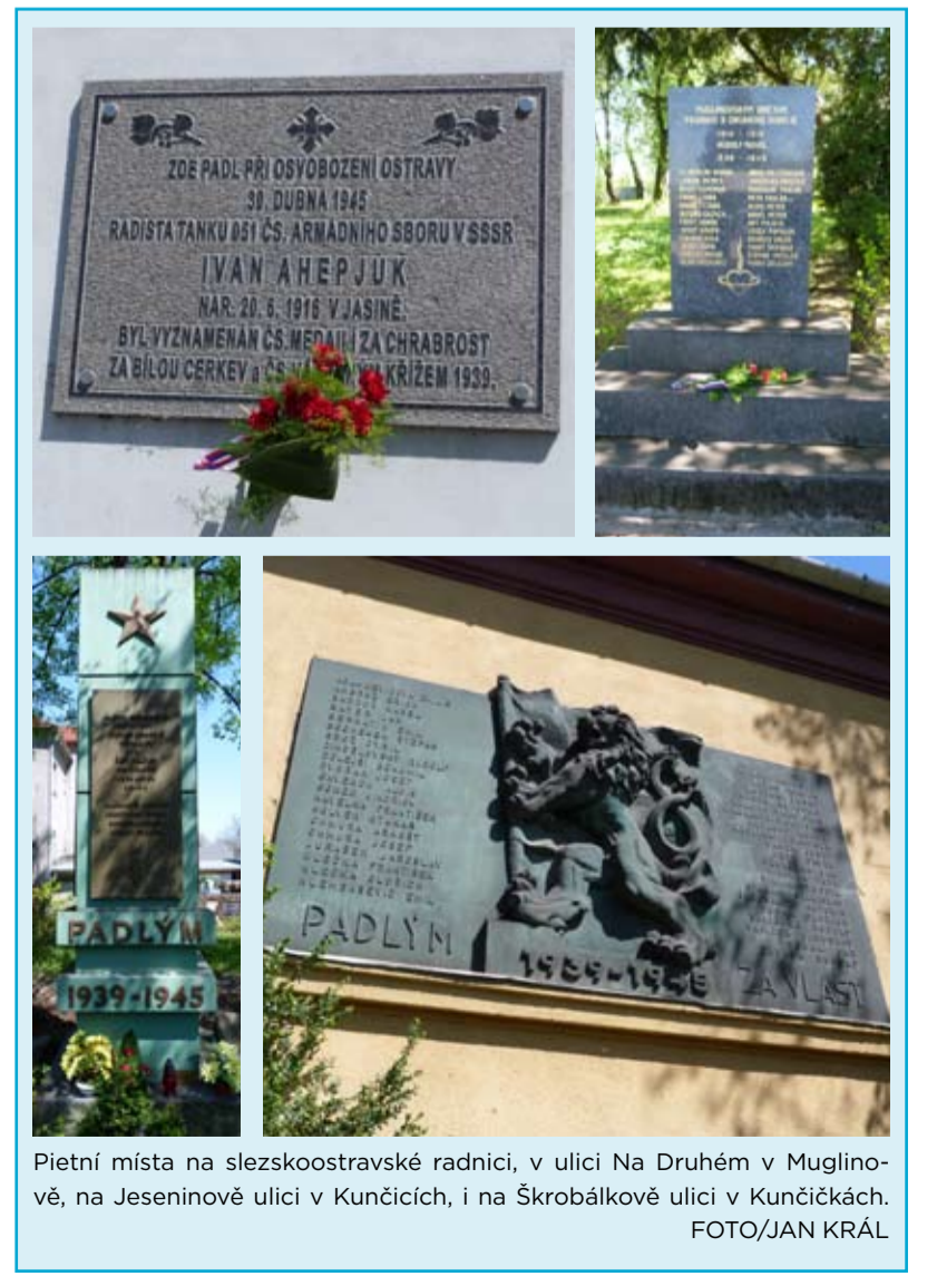
Pietní místa na slezskoostravské radnici, v ulici Na Druhém v Muglinově, na Jeseninově ulici v Kunčičkách, i na Škrobálově ulici v Kunčičkách.