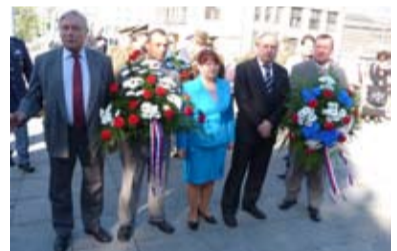
UCTILI PAMÁTKU. Zastupitelé Slezské Ostravy u Památníku 1. čsl. tankové brigády.