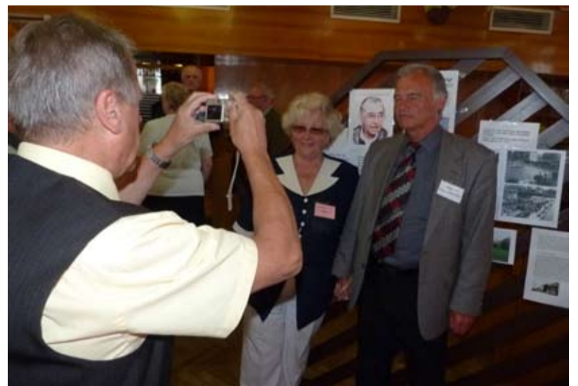
SETKÁNÍ. Každé tři toky se setkávají rodáci a přátelé Hrušova.