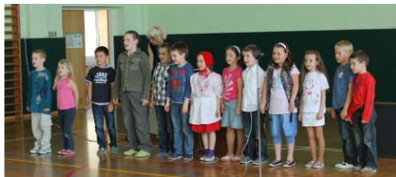
BESÍDKA. V tělocvičně ZŠ Bohumínská se konala besídka ke Dni matek.