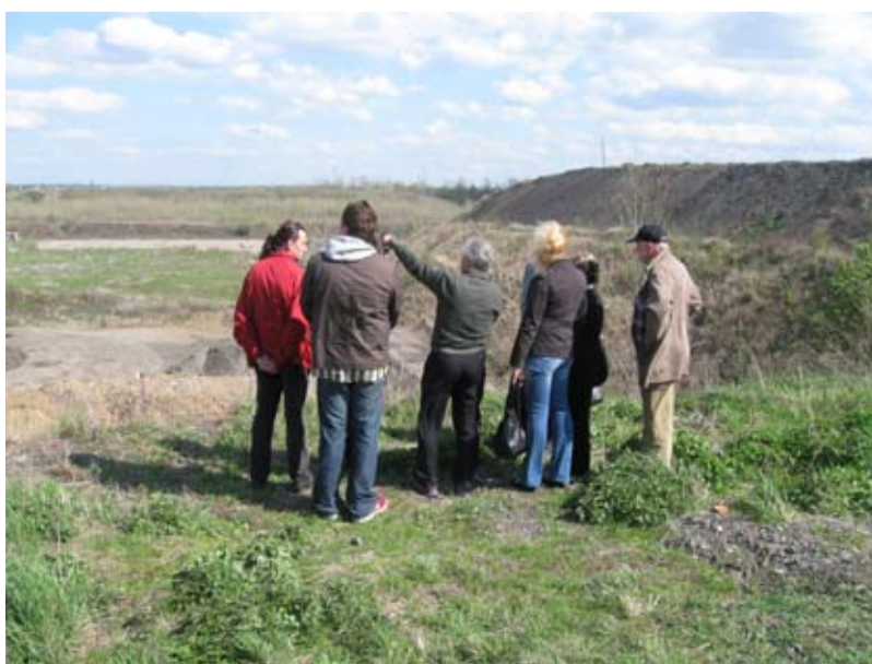
ZÁRUBEK. Členové komise životního prostředí na inspekci na Zárubku.