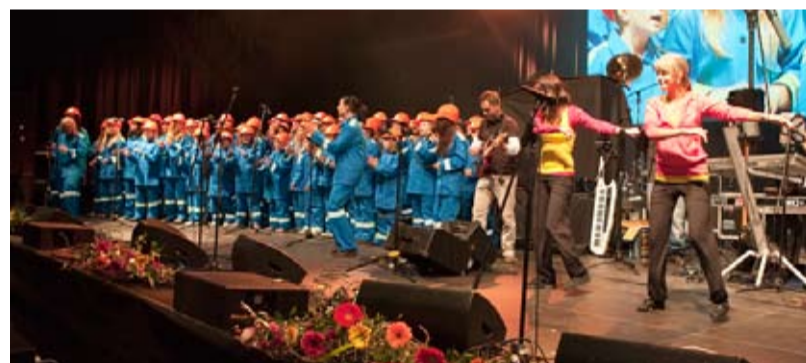
ARCELOR MITTAL GOSPEL. Vystoupení dětí ze ZŠ Chrustova.

Koncerty v Coolturu byly rozčleněny na dva dopolední, které byly určeny především pro školy a jeden večerní, kterého se účastnili rodiče