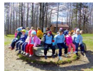
VÝLET NA PRAŠIVOU. České i polské děti hledaly sněženky v Beskydech.

Po výtečném obědě se louka na Prašivé proměnila v dětský ráj. Některé děti se točily na kolotoči, jiné na lavičkách před chatou vybarvovaly pracovní sešity plné jarních