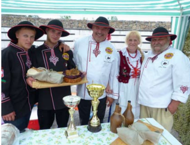
VÍTĚZOVÉ. První cenu ve vaření bigosu získali polští kuchaři.