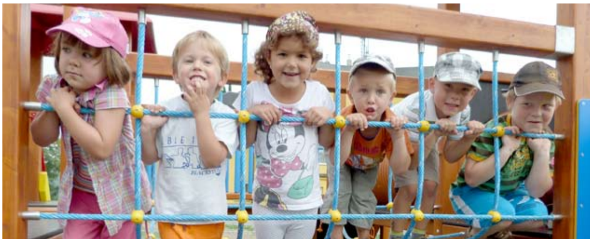
NA NOVÉM. Děti se na hřišti na Keltičkově ulici zjevně nenudí.