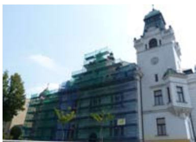
Radnice s lešením.