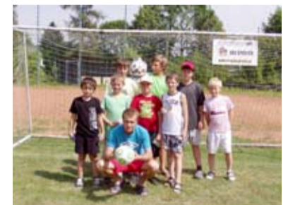
Domácí tým TJ Sokol Koblov.

TJ Sokol Koblov pořádal 30. června za podpory Úřadu městského obvodu Slezská Ostrava fotbalový turnaj mladších žáků spojený s dětským dnem. Turnaje se celkem zúčastnilo 7 týmů, a to pořádající TJ Sokol Koblov, dále FC Odra Petřkovice, TJ Sokol Pustkovec, TJ Heřmanice, TJ Lokomotiva Suchdol nad Odrou, FC Slavia Michálkovic a SK Ostrava Lhotka. Turnaj se odehrál za nádherného slunečného počasí a za hojně účasti obecního úřadu, které si odneslo nezapomenutelný sportovní zážitek. Všichni hráči i přes tropická vedra šli do soubojů naplno se srdečným nasazením a touhou po vítězství. Vítězem turnaje se stal tým TJ Heřmanice, který tak zopakoval