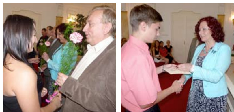
SLAVNOST. Absolventi základních škol obdrželi od vedení slezskoostravské radnice pamětní listy, které jim připomenou školní léta ve Slezské Ostravě.

V pondělí 25. června se naplnily prostory Obřadní síně slezskoostravské radnice žáky základních škol městského obvodu, kteří ukončili školní docházku.