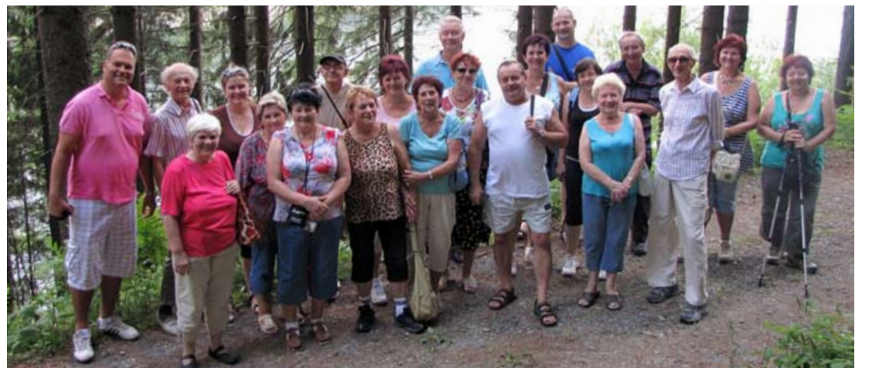
BESKYDY. Senioři ze Slezské na dvoudenním pobytu ve Starých Hamrech.