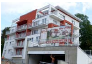
PŘED KOLAUDACÍ. Většina nových bytů v novém domě už má majitele.