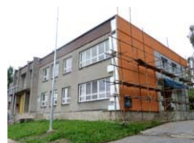
Oprava Mateřské školy Komerční.

Jsou ještě prázdniny, tak určitě změny na našich školkách, pro naše nejmenší a jejich rodiče. Nový kabát a opravy na MŠ na Komerční ulici v Muglínově. Vnitřní úpravy by měly následovat napřesrok. Úpravy a opravy jsou i v MŠ v Koblůvě. Vzhledem k tomu, že v budoucnu chceme vybudovat dům pro seniory v Antošovicích, stěhuje se třída školky z Antošovic do Koblůva. V Koblůvě se tak kapacita mateřské školy rozšiřuje a v souvislosti s tím i ta část zatepluje.