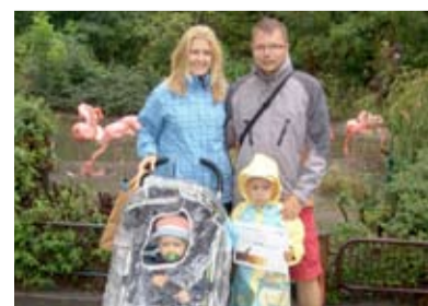
NÁVŠTĚVNÍCI. Letošní návštěva č. 300 000.

vysvětlila paní Feilhauerová, proč s rodinou vyrazila tentokrát do Slezské Ostravy. „Vybaveni pláštěnkami a deštníky věříme, že si prohlídku i přes nepřízeň počasí užijeme,“ podotkla s úsměvem. Rodina obdržela pamětní list a tašku s upomínkovými předměty zoo. /red/