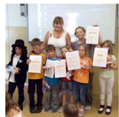
TRADIČNÍ MISS. Vybrat vítěze v soutěži Miss jednoduché nebylo.