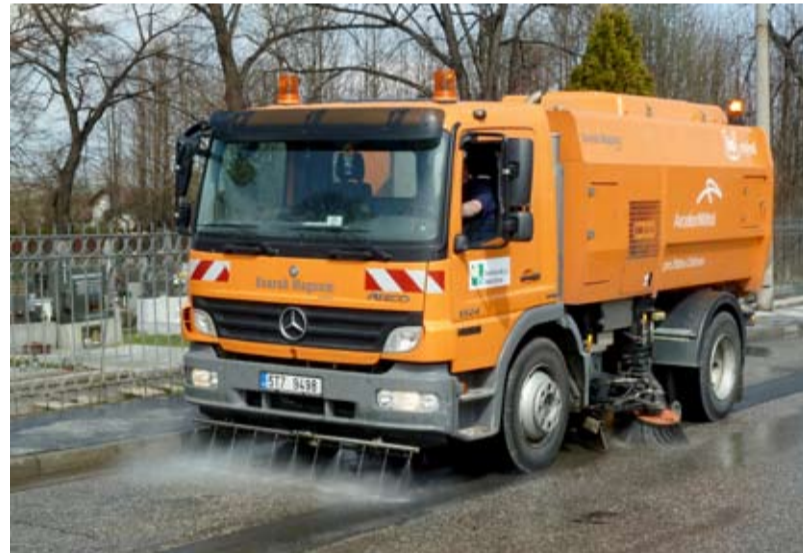
ČISTOTA. Speciální vůz brázdil ulice Slezské Ostravy.

Čištění bylo provedeno nejmodernějším zametacím vozem Mercedes – Scarab, zvaným „Mýval“, vybaveným vysokotlakou mycí lištou a schopným zachytit i drobné prachové částice PM10. V uvedených lokalitách bylo vyčištěno celkem 409 km místních komunikací.