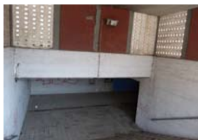
Podchod na Bohumínské před a po opravě.