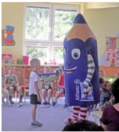
LOUČENÍ. V MŠ Komerční se loučili s dětmi, které odešly do základní školy.

Stalo se již tradicí, že se naše Mateřská škola Komerční slavnostně loučí s dětmi, které po prázdninách odcházejí do 1. třídy základní školy. V letošním roce bylo rozloučení spojeno se slavností na nově upravené školní zahradě, která byla v rámci projektu Nadace OKD vybudována i novými herními prvky. Akce proběhla ve středu 20. června. Nejdříve jsme se rozloučili se školáky za účasti maskota Pastelky, která k nám zavítala a dětem předala drobné dárky pro vzpomínku na mateřskou školu. Každé dítě obdrželo i pamětní knížku věnovanou občanským sdružením Mláďata.