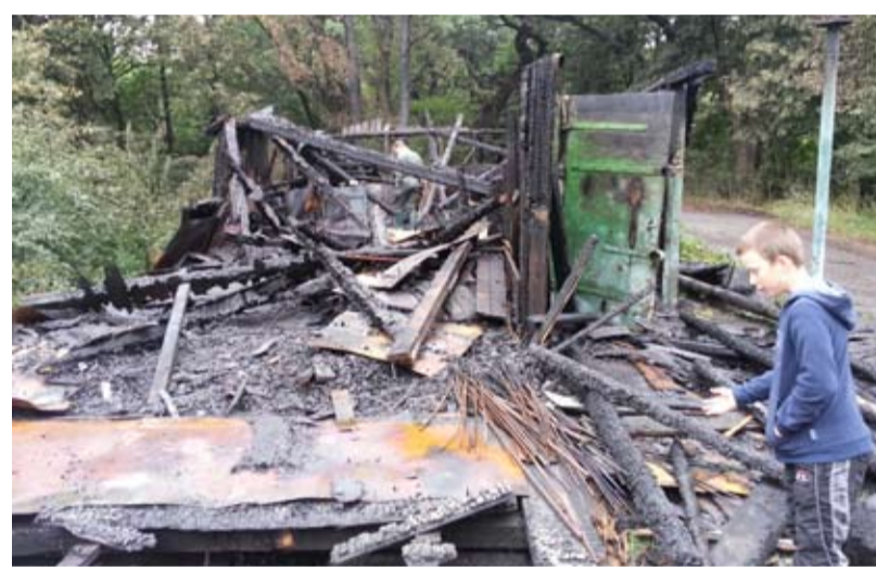
POŽÁR. Zbytky myslivecké chaty v Heřmanicích.