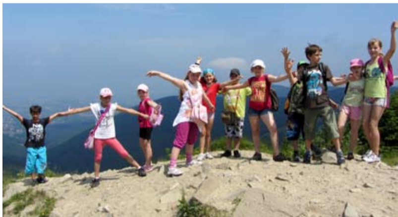
PREMIÉRA. Děti z muglinovské školy objevovaly Beskydy.