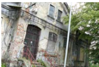
MINULOST. Administrativní budova před opravou.

dobrodružství. Dvanáct milionů na opravu se podařilo získat z fondů EU, přestavovat se začalo loni v květnu. „Několikrát stavbu vykradli. První firma, provádějící opravu, to po několika týdnech vzdala, když jejím pracovníkům zmizelo nářadí. „Aby se mohlo