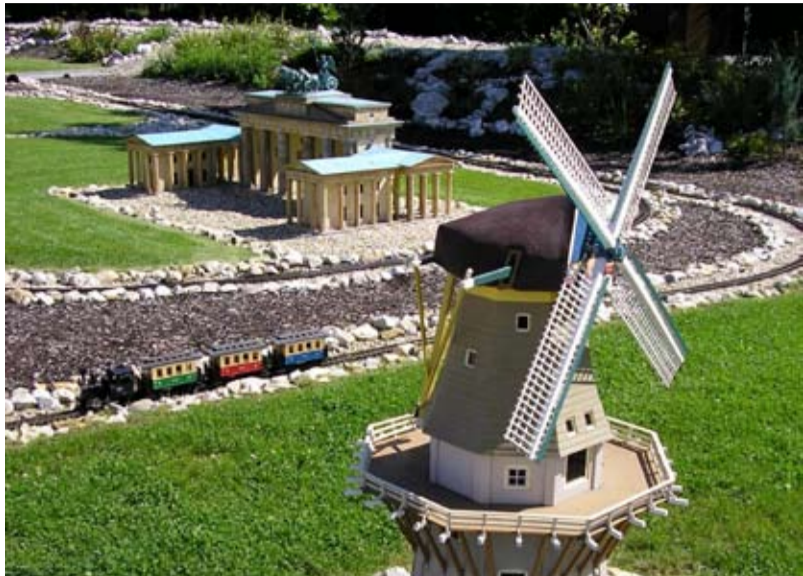
PROMĚNA. Slezská Ostrava bude mít na svém území další hojně navštěvovanou atrakci.

SLEZKÁ OSTRAVA/Okolí Slezskoostravského hradu čeká v příštích měsících zásadní proměna.