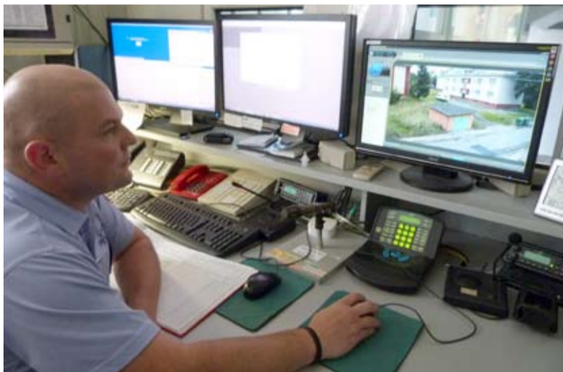
MONITORING. Strážníci monitorují Kunčičky.

Kontaktní místo: Pstruží 6, otevřeno každé úterý 9–11 a 14–17 hodin. Do schránky na Pstruží 6 mohou občané dávat své podněty. Telefon: linka 156, linka 950 735 011 (IVC Slezská Ostrava).