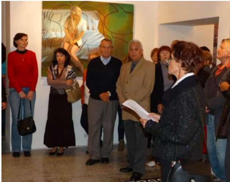
OSTRAVA ART. Návštěvníci zaplnili 19. září Slezskoostravskou galerii.