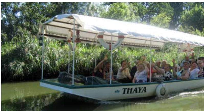
VÝLET. Čtyřicet slezskoostravských seniorů odjelo na třídenní zájezd do Lednicko-valtického areálu.