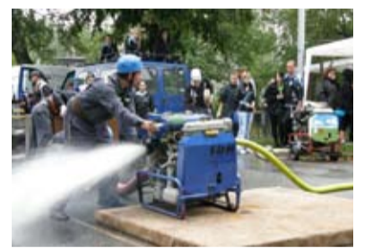
HASIČSKÁ SOUTĚŽ. V Muglinově bylo na co se dívat.

Pomalou každou akci, pořádanou v poslední době muglinovskými hasiči, doprovází nepřízeň počasí. Nejinak tomu bylo i v sobotu 1. září, kdy se u hasičské zbrojnice uskutečnil další ročník soutěže o putovní pohár sboru dobrovolných hasičů. Účast soutěžních družstev a diváků byla i přesto velmi silná a rozhodně se bylo na co dívat. Pět družstev žen, třináct družstev mužů a veteránů včetně jednoho družstva z družebního hasičského sboru polského města Grodisko se utkalo v netradičním požárním útoku zvaném „Muglinovské schody“. V soutěži o putovní pohár a peněžní dary zvítězily ženy z Plesné a muži