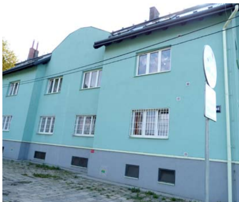
JEDINÝ. Azylový dům ve Slezské Ostravě je jediným svého druhu v Ostravě.

jsou i návštěvy ZOO, kina, loutkového divadla či interaktivních výstav. Velký úspěch měla spolupráce se skupinou prevence městské policie, která v rámci projektu „Druhá šance“ v loňském roce zařídila nejen spoustu besed, ale také dvoudenní pobyt maminek s dětmi na horách.