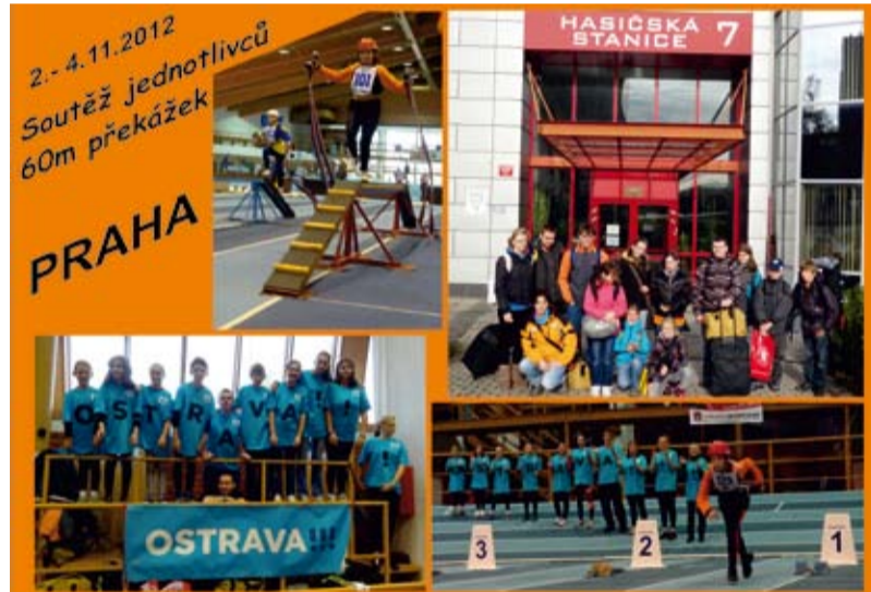
V PRAZE. Za své výkony se hasiči nestyděli.

Dne 3. listopadu reprezentovali Slezskou Ostravu v Praze mladí heřmaničtí hasiči na soutěži jednotlivců na 60 metrů překážek. Na akci jsme odjeli vlakem už v pátek a ubytování jsme měli zajištěno u profesionálních hasičů na Smíchově. V sobotu mladí hasiči