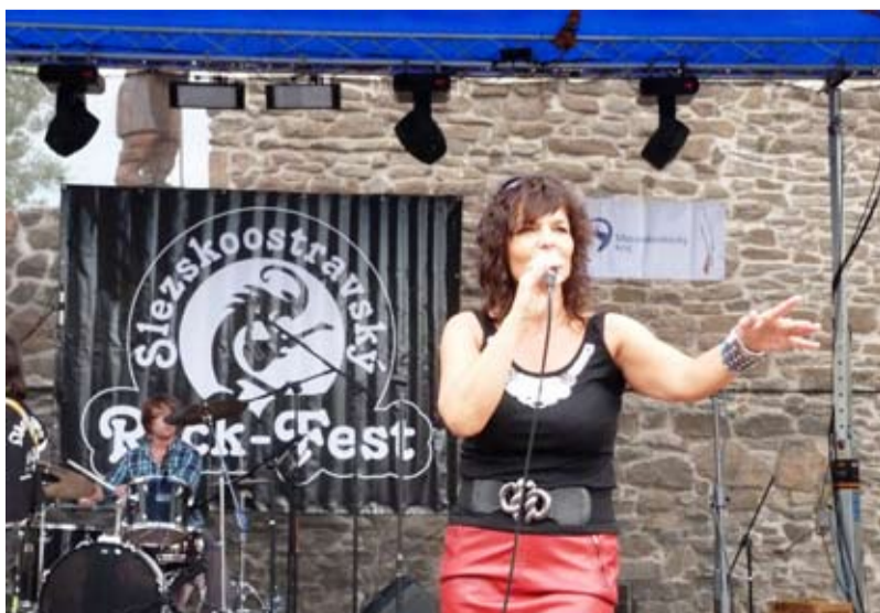
ROCK-FEST. V srpnu 2013 opět na Slezskoostravském hradě.

GreenGas DPB a.s. VVUÚ a.s. Unigeo a.s. Ferrmon s.r.o. Skatyl s.r.o. Satjam s.r.o. Votek Slezská s.r.o. Cond Klima s.r.o. Grattis s.r.o. Profiterm holding Manpower s.r.o. Ac plus s.r.o. Hydor s.r.o. KV Kaš s.r.o. Klučka Norbert Ing. Dvořák