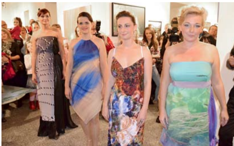
MODELKY. Nevšední zpestření vernisáže.