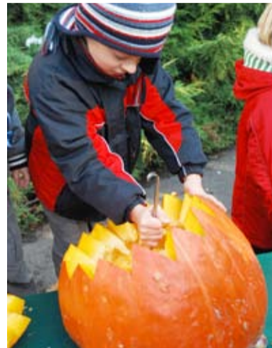
ZOO. Jak dlabat dýně.