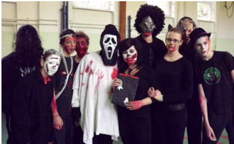
CHRUSTOVA. Žáci slaví Halloween.

dílnu, která byla naplněna zvláštní atmosférou očekávání. Společně jsme se sešli s rodiči, prarodiči i sourozenci dětí, abychom si vyrobili dýňáčky-strašáčky nebo jiné podzimníčky z předem shromáždě-