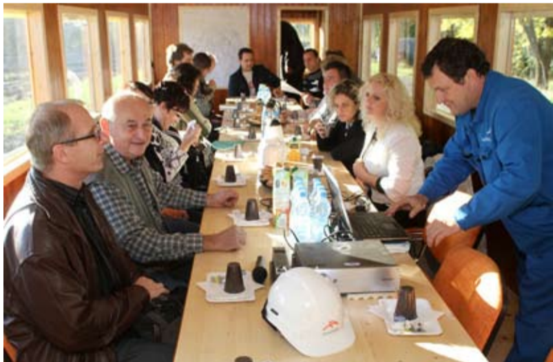
VAGÓN. Komise životního prostředí zasedá ve vagonu společnosti ArcelorMittal.