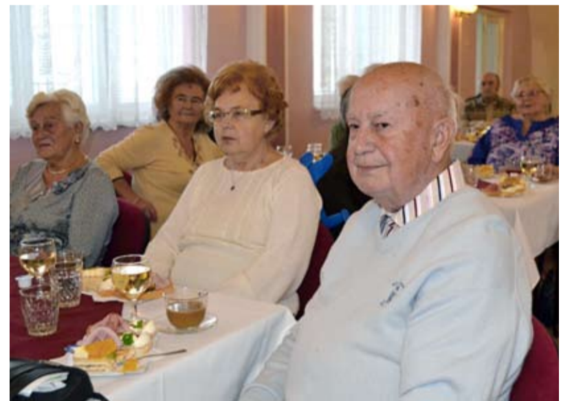
JUBILANTI. Senioři Slezské Ostravy na oslavách v kulturním domě.

V prostorách muglinovského kulturního domu se již tradičně sešli jubilanti, kteří v těchto měsících oslavili 80 a 85 let. Oslavy, které se konaly 25. října, pro ně už tradičně připravil Úřad městského obvodu Slezská Ostrava.