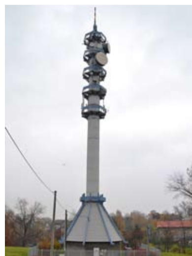
VYSÍLAČ. Nový vysílač stojí na hladnovském kopci na ulici Lanová.

Vysílání multiplexu 4 si mohou naladit diváci i na Ostravsku. Ve čtvrtek 11. října byl uveden do provozu nový vysílač Ostrava – Lanová, který nahradil původní nevyhovující vysílač Máj. Nový vysílač zabezpečuje kvalitním signálem multiplexu 4 celé Ostravsko. DVB-T multiplex 4 obsahuje programy TV Fanda, TV Pohoda a test Inzert TV. Dále provozovatel multiplexu šíří dva programy v MPEG-4/HD – ČT HD / ČT1 HD / a Nova HD. Oba je možné přijímat pouze na moderních televizorech nebo set top boxech s podporou formátu MPEG-4/HD. /red/