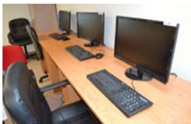
MOŽNOSTI. Centrum nabízí mnoho míst k zábavě i poučení.

Středisko již nyní navštěvují děti, které se v různých kroužcích učí například vařit, fotografovat, tančit nebo vytvářet časopisy. Funguje zde i fotbalový oddíl. „Denně do centra dochází nejméně čtyři desítky dětí,“ vysvětlil Bc. Filip Habrman z Diecézní charity ostravsko-opavské.