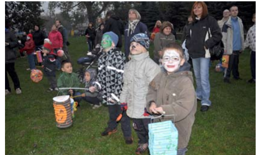
KUNČICE. Tradiční svícení.