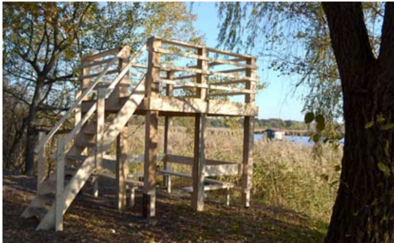
POZOROVATELNA. Speciální konstrukce vyrostla u Heřmanického rybníku.

Ptačí pozorovatelna, kterou ochránci u rybníku postavili, je teprve druhou takovou stavbou v Ostravě. „Ta první stojí blízko Rudné ulice u řeky Odry v lokalitě Rezavka,“ říká Roman Barták. Oblast Heřmanického rybníku včetně pozorovatelny budou podle jeho mínění dále navštěvovat častěji spíše odborníci a školní exkurze než veřejnost. „Málo Ostravanů vůbec o Heřmanickém rybníku něco ví.