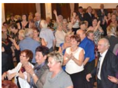
TRADICE. Senioři Slezské Ostravy na svém tradičním plesu.

Celým večerem hudebně provázela kapela Mirabel. Program plesu byl slavnostně zahájen baletním vystoupením dětí ze Základní