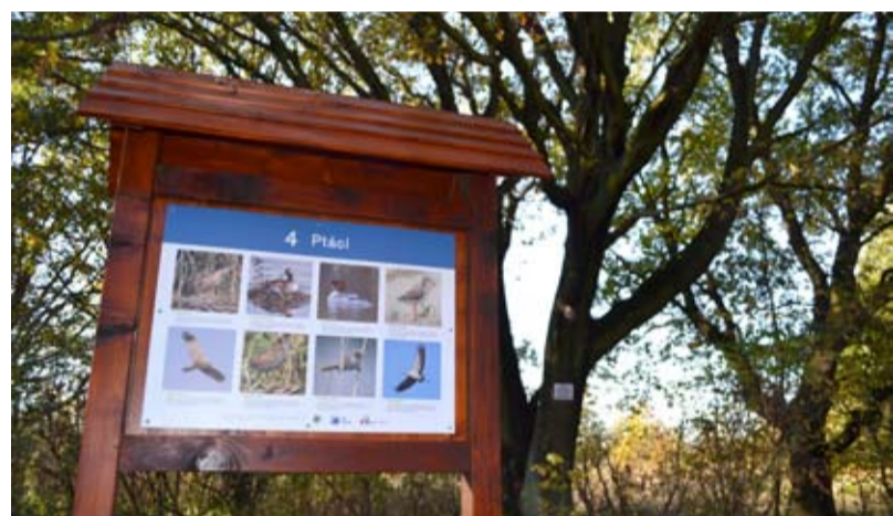
STEZKA. Nová naučná stezka obsahuje pět panelů.

Už přístup k rybníku je komplikovaný. Z ulice Orlovské pod viadukt je vjezd povolen jen dopravní obsluze. „Přáním do budoucna je, aby lidé mohli někde v blízkosti viaduktu zaparkovat, případně se i občerstvit a pak se vydat k rybníku po upravených stezkách,“ konstatuje Jiří Šárek. /jk/