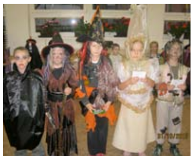
PĚŠÍ. Rej strašidel i s diskotékou.

Ve středu 31. října proběhl ve školní družině na Pěší Halloweenský rej strašidel pro děti školní družiny a prvňáčky. V 16 hodin se sešlo 53 různých strašidel, aby si užila