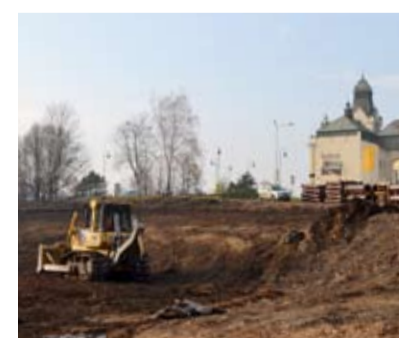
TĚŠÍNSKÁ. Blízko radnice roste kruhový objezd.

Z tohoto důvodu nyní probíhá kácení stromů v území staveniště. Celkem bude odstraněno zhruba sto stromů, za něž správní orgán předepsal náhradní výsadbu jako kompenzaci ekologické újmy. Výsadba nových dřevin bude provedena kolem nové stavby křižovatky a kolem nového dětského hřiště na ulici Keltičkové. Vysazeny tak budou tři stovky stromů. Součástí výsadby jsou i keřové skupiny. Přes okružní křižovatku bude vedena trolejbusová trať na