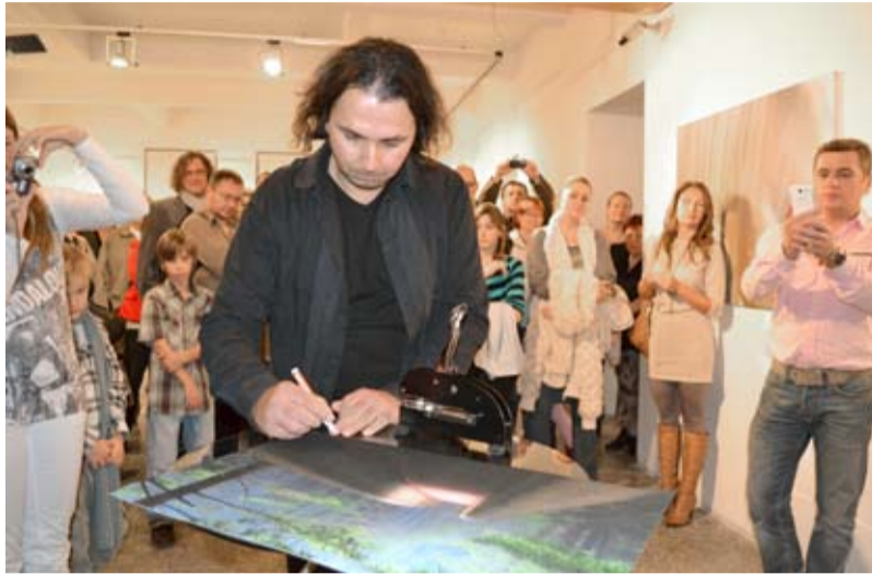
FOTOGRAF. Autor Josef Kotas podepisuje své fotografie.

Během vernisáže mohli návštěvníci sledovat i modelky, které se oblékly do šatů vzniklých z motivů vašich