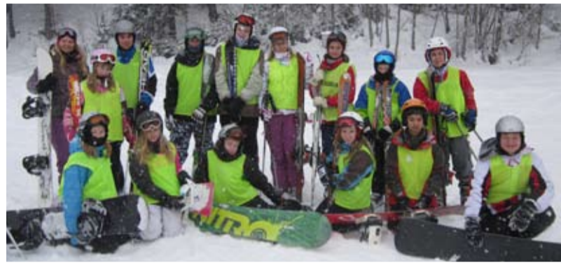
NA BÍLÉ. V Beskydech byly ideální podmínky na lyžování. FOTO/ARCHIV

Bc. Radovan Řehulka, učitel ZŠ Chrustova