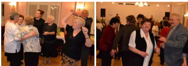
VESELÍ. Slezskoostravští senioři na slavnosti.

Slezskoostravští senioři oslavili příchod jara v muglinovském kulturním domě ve čtvrtek 21. března. Na akci nazvané Velikonoční veselí seniorů hrála k tanci skupina Mirabel, představil se také folklórní soubor Odra, který si do Muglinova připravil vystoupení dětí i seniorů. Nechyběla ani přehlídka lidových krojů.