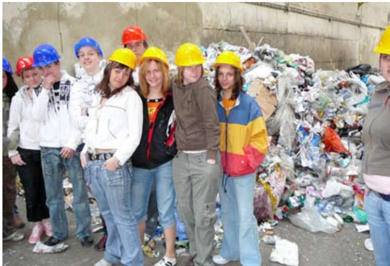
75 000. Takový je zhruba počet dětí, které navštívily středisko OZO v Kunčicích.

Jak připomíná Vladimíra Karasová, Centrum odpadové výchovy