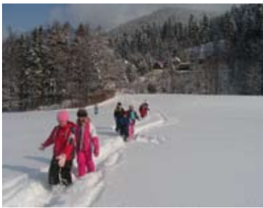
NA OSTRAVICI. Žáci heřmanické školy si užívali sněhové nadílky v Beskydech.

Přivítala nás zasněžená Ostravice a milá paní vedoucí hotelu Liptov.