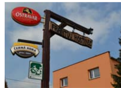
FRANTŮV HOSTINEC. V místě bývalého statku vznikl hostinec.

upravený chodník a malé parkoviště pro hosty tohoto hostince. V teplém počasí můžete posedět na dřevěných venkovních lavičkách v příjemné atmosféře, připomínající, že tady býval kdysi statek. Majitelé totiž prostředí obohatili také ve smyslu historickém. Vidíte zde také mnohé z předmětů a starých selských nástrojů, a to jak ve vnitřní výzdobě hostince, tak také ve venkovním prostředí. A jídlo je zde vynikající. Takže, až půjdete kolem, zkuste se zastavit v malém pohostinném světě, který připomíná nejen minulost