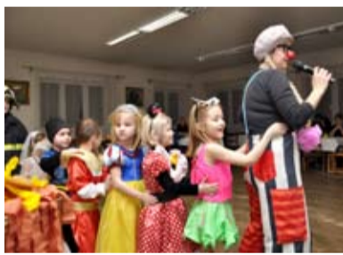
MAŠKARNÍ. Roli klaunů si tentokrát vyzkoušely samy učitelky.