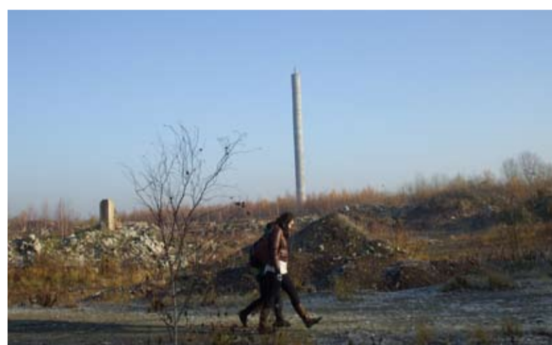
HRUŠOV. Výstava potrvá na radnici do 30. dubna.