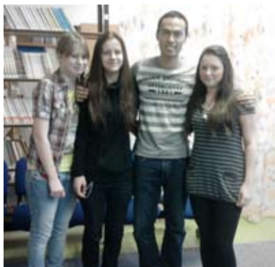
EDISON. Bohumínskou navštívili studenti z Brazílie a Ukrajiny.

V týdnu od 25. února do 1. března se naše škola zúčastnila projektu Edison, zaměřeného na mezikulturní vzdělávání ZŠ a SŠ, to celé pod záštitou MŠMT a pořádající mezinárodní organizace AIESEC. Naši školu tak díky tomuto projektu