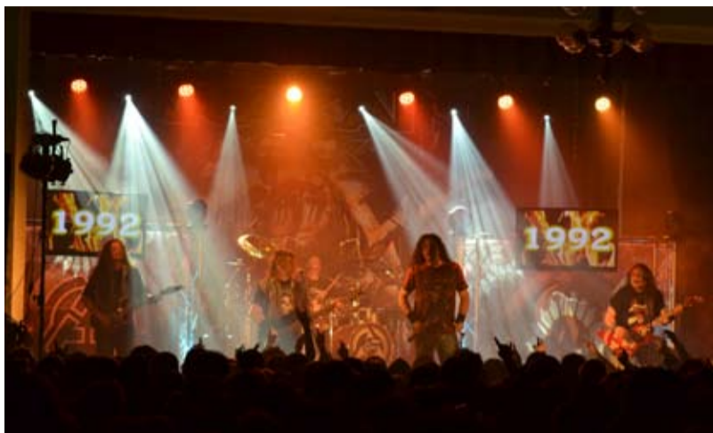
ARAKAIN. Populární kapela přijede na hrad.

„Festival se opět bude odehrávat na dvou pódii – Nádvoří stage a Aréna stage,“ říká za pořadatele slezskoostravský zastupitel Bc. Marcel Pažický. Rock-Fest pořádá každoročně občanské sdružení Kultura pro Slezskou Ostravu. Před šesti lety festival skromně začínal v restauraci Stará kuželna, letos se již potěší uskutečnění v celém areálu Slezskoostravského hradu.