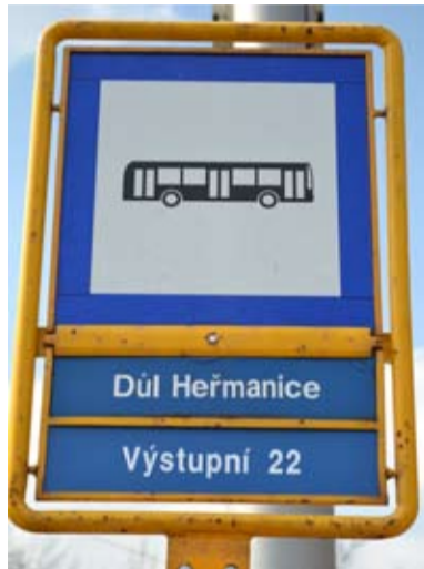
LINKA 22. Ukončení linky na Dole Heřmanice vyvolalo nesouhlas.