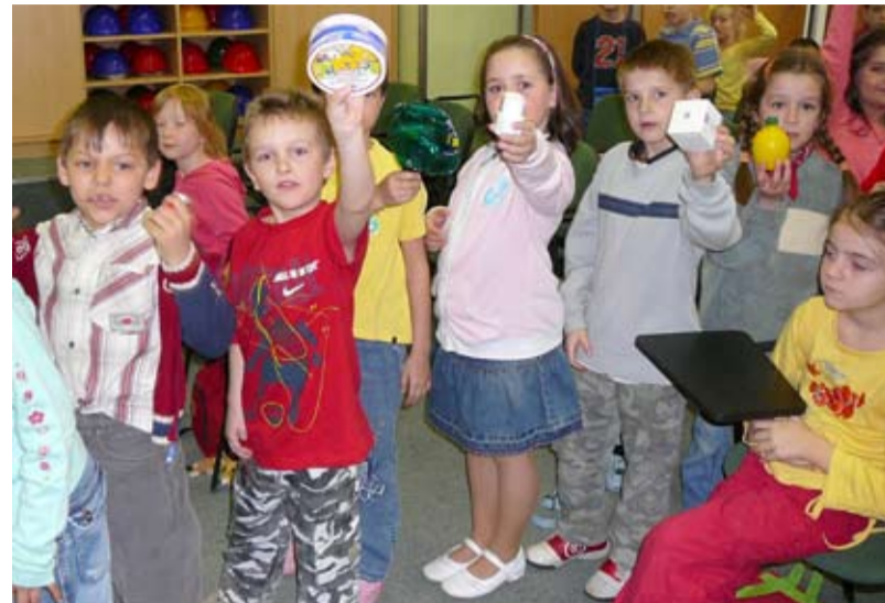
PROGRAMY. Podrobnosti o odpadech se v Kunčicích dozvídají děti různých věkových kategorií.

Programy probíhají od pondělí do pátku, trvají zhruba dvě až tři hodiny a konají se v areálu OZO v Kunčicích. Vyučující mohou své třídy na programy objednat