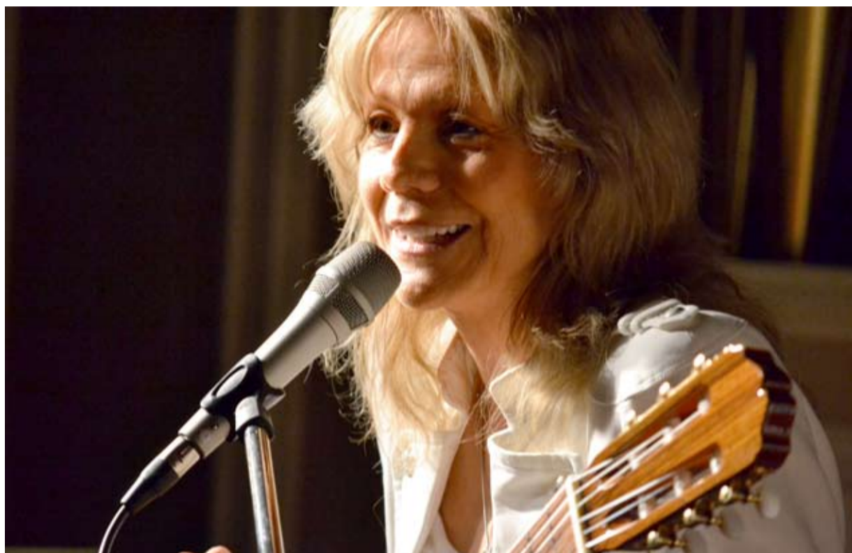
LENKA FILIPOVÁ. První dva koncerty, veliký úspěch.