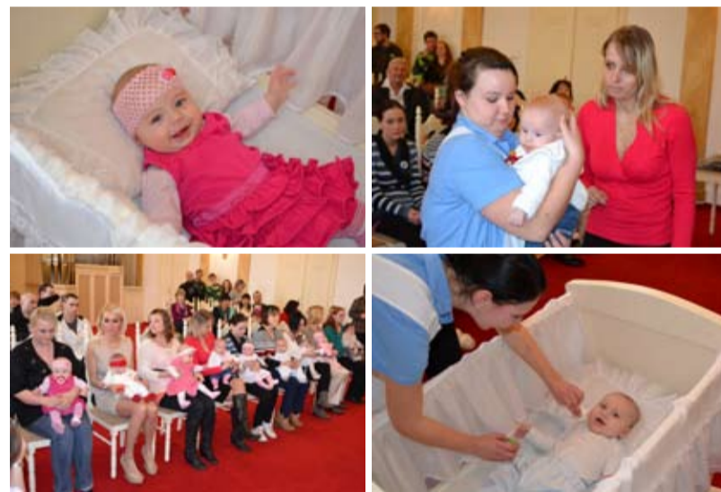
OBČANCI. Kolébka, zápis do kroniky, přivítání. Takový program čeká na děti a jejich rodiče na tradičním vítání občánků.

Během obřadu si přítomní vyslechli i básničky už starších dětí, rodiče se zapsali do kroniky městského