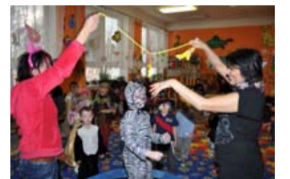
KARNEVAL. Na Liščině zněl i Gangnam Style.