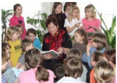
S ANDERSEMEM. Ve škole se četlo i spalo.

Letošní Noc s Andersenem připadla na 5. dubna a stejně jako v těch předešlých nás čekala spousta zábavy, čtení a her. V naší