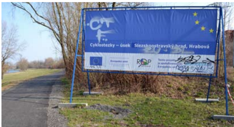
ROSTOU. Další úsek cyklostezky v Kunčicích směrem ke Slezskoostravskému hradu je hotov.