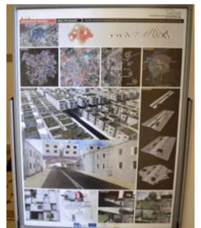
HRUŠOV. Nápady studentů na radnici.