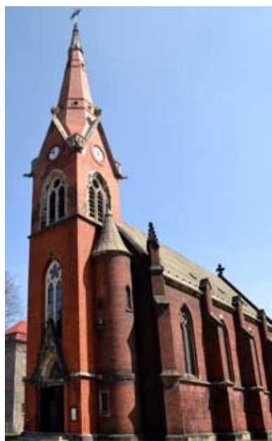
KOSTEL. Hrušovská památka slaví jubileum. FOTO/JAN KRÁL

záchranu; a to především o opravu vzácné cihlové věže a vitrážových oken (tzv. bucny, kterými se mohou