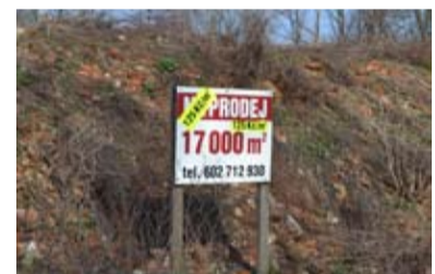
NA PRODEJ. Společnost Technoprojekt nabízí pozemek v Kunčicích.

ležící pozemek adekvátní využití. Kosmák připomíná, že pozemek plný sutí se stává zdrojem stížností občanů žijících v Kunčicích. „Současného vlastníka jsme vyzvali, aby zbylou suť z pozemku odstranil do 31. 8. 2013,“ informuje Kosmák. „To místo má svoji hodnotu. Nechceme tedy odvážet úplně všechno. Pokud se nám nepodaří najít kupce, odstraníme alespoň přední val starého zdíva a vše urovnáme tak, aby současný