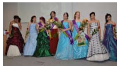
MISS. Dětský domov Na Vizině má svoji královnu krásy.