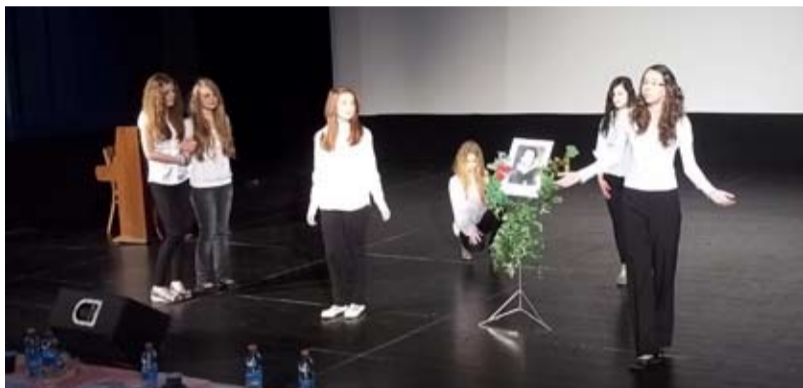
ČESTNÉ UZNÁNÍ. ZŠ Bohumínská na Puškinově památníku.

Dne 5. dubna se v bohumínském kině K3 uskutečnil již v pořadí 47. ročník krajské přehlídky festivalu ARS POETICA Puškinův