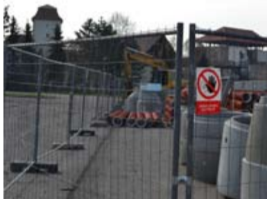
ZMĚNY. Okolí Slezskoostravského hradu se proměnilo ve velké stavební místo.