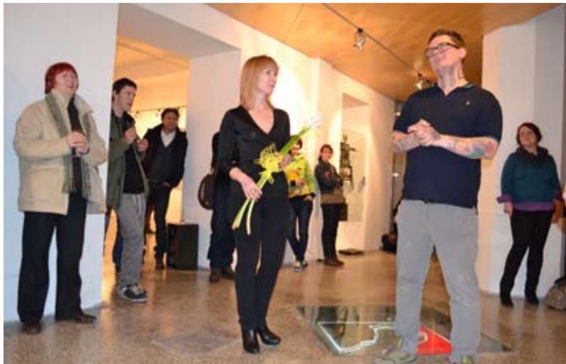
ARTPOKALYPSA. Openmindz 360° zahajuje výstavu.

Výstava dostala jednoznačný název: ArtPokalypsa. Návštěvníci galerie mohli vidět kromě Nenutilových nových obrazů, vzniklých převážně v letošním roce, i nejrůznější vitríny plné posbíraných kostí či velkou hromadu věcí, nejvíce připomínající skládku. V galerii byly staré barely, pneumatiky či tlející listy. „Vše je inspirováno okolními opuštěnými ostravskými doly,“ vysvětloval Nenutil význam svých objektů. „Bývalé doly často navštěvují a sbírájí artefakty, které pak vystavují v boxech. Zrezivělé věci, dřívka i kosti. Pocházejí z Ostrava, Dolu Petr Bezruč nebo také z Dolu Heřmanice,“ svěřil se autor. Za své zvláště oblíbené místo označil právě Důl Petr Bezruč ve Slezské Ostravě. „Je to ale bohužel místo, které je kvůli sběračům kovů i bezdomovcům hodně zpusťované. Budu