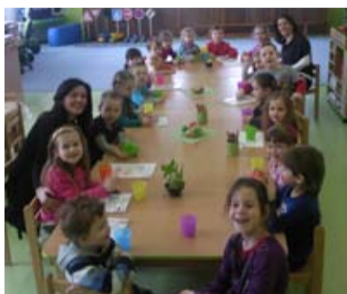
VELIKONOCE. Tentokrát včetně chorvatských učitelek.

Ve středu 27. března se MŠ Komerční opět proměnila v jednu velkou velikonoční dílnu. Sešlo se tady mnoho dětí se svými rodiči a sourozenci, aby společně přivítali blížící se svátky jara – Velikonoce. Všichni se s chutí pustili do vyrábění velikonočních ozdob. Různými technikami zdobili velikonoční vajíčka, obrázky, zajičky nebo si vyrobili věnečky z proutí, které si potom odnesli domů. Rodiče i děti byli až nečekaně zruční a práce jim šla přímo od ruky. Proto i nálada