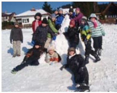
NA BEČVĚ. Žáci vyrazili za sněhem do Beskyd.

Ve dnech 11. až 25. března se uskutečnil organizovaný pobyt dětí ozdravného charakteru za podpory účelové dotace z rozpočtu statutárního města Ostravy v krásném prostředí Horní Bečvy v hotelu Mesit. Akce se účastnili žáci I. až V. ročníku ZŠ Pěší spolu se svými pedagogy a vychovateli, převážně z řad studentů Ostravské univerzity. Děti byly ubytovány ve velmi pěkných pokojích a k dispozici měly po celou dobu pobytu bazén, saunu, malou tělocvičnu i hernu. Již tak náročnou práci ztěžovalo pedagogům i vychovatelkám nepříznivé