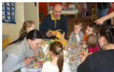
MAŠKARNÍ. Děti v MŠ Slívova se nenuřily.