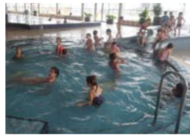
AGUAPARK. Vodní zábava v Kravařích.

Dne 14. března vyrazily děti z Mateřské školy Keramické a Komerční na celodenní výlet do Kravař. Děti