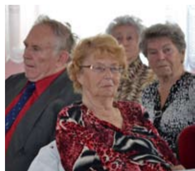
OSLAVA. Jubilanti Slezské Ostravy oslavili svá výročí.

„Rádi bychom, abyste dnešní den prožili v pohodě, ve štěstí a klidu. Bavte se dobře,“ dodala. /red/