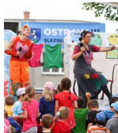
PRO DĚTI. Dětské odpoledne v Muglinově přilákalo spoustu návštěvníků.