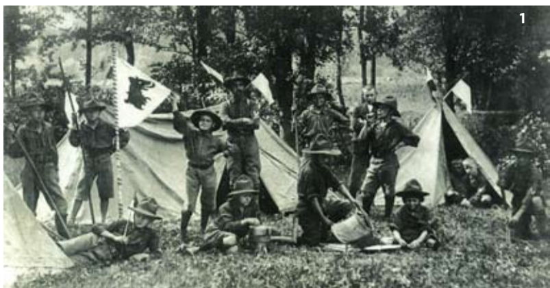
1) Na snímku, který byl vydán u příležitosti oslav devadesátiletého trvání ostravského skautingu, jsou členové 1. oddílu na výpravě do přírody v roce 1920.

2) Do dnešních dnů se z činnosti FČ-KMH dochoval pouze otisk původního klubovního razítka, který nám pro naše účely ochotně poskytl známý ostravský tramp a šéfredaktor časopisu tramp v jedné osobě pan Zdeněk Vašíček – Dáblík z Heřmanic.