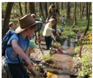
DO PŘÍRODY. V Heřmanicích funguje Lesní školka.

Úspěšný půlrok má za sebou první Lesní školka Heřmánkov v Ostravě-Heřmanicích. V Moravskoslezském kraji je zatím první školkou, kde děti tráví většinu času v přírodě. Hlavní myšlenkou založení Heřmánkova bylo navázat na waldorfskou školku. Velký důraz je kladen na ekologický aspekt školky. „Domníváme se, že právě v našem regionu je třeba intenzivně pracovat a podporovat děti i rodiče ve vybudování silného