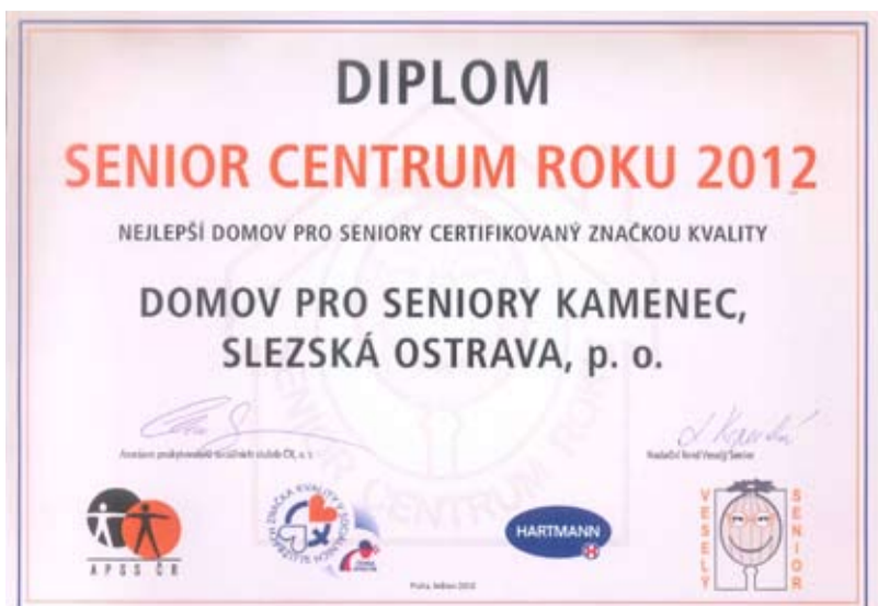
DIPLOM. Ocenění Domovu pro seniory Kamenec.

Kamenec od Asociace poskytovatelů sociálních služeb ČR nejvyšší hodnocení kvality a také dosáhl vůbec nejvyššího bodového ohodnocení ze všech domovů pro seniory v České republice. /red/