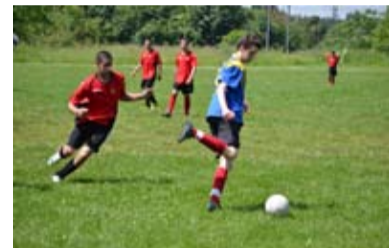
FOTBAL. Družstva žáků soupeřila ve fotbale.