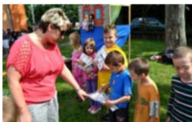
60 LET. Mateřská škola v Kunčičkách slavila jubileum.