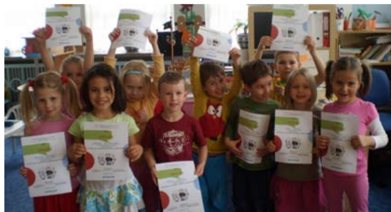
VÍTĚZSTVÍ. Děti z MŠ Záměstní vyhrály soutěž.