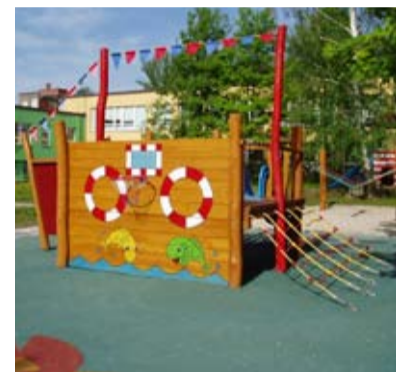
MŠ KOBLOV. Další z upravených školních zahrad.