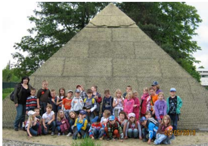
U PYRAMIDY. Děti ze ZŠ Pěší navštívily Miniuni.