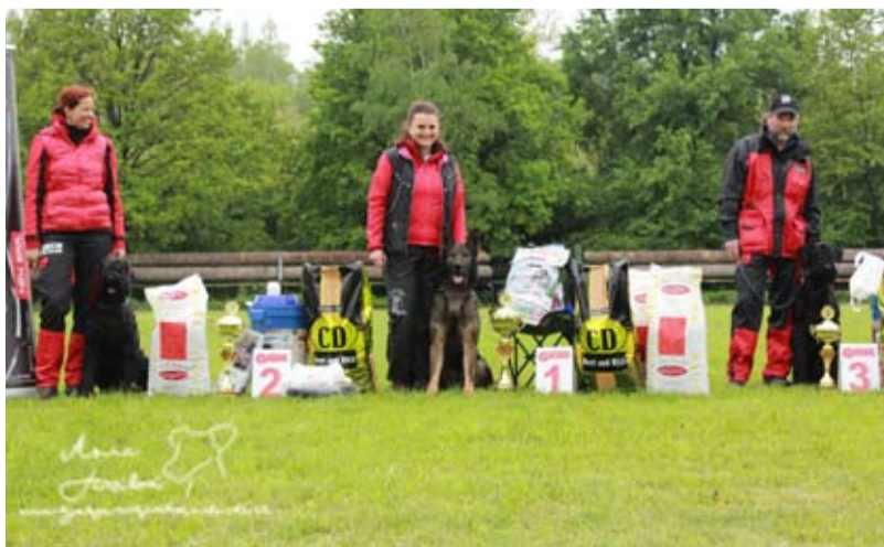
VZSMKSK - KUNČICE. Kynologové z celé ČR se sjeli na hřiště do Kunčiček.