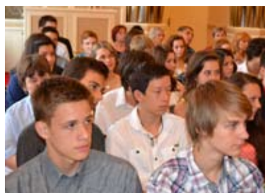
LOUČENÍ. Devátáci si přišli na radnici pro pamětní listy.

práci ve školní samosprávě odměněni volnou vstupenkou do kina