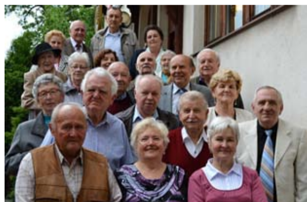
PO 60 LETECH. Žáci hladnovské školy v roce 1953 a v roce 2013.