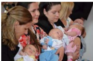
VÍTÁNÍ. Jedna z tradičních akcí pořádaných městským obvodem.

varhany,“ říká referentka agendy matriky Pavlína Volná. V roce 2012 zemřelo ve Slezské Ostravě 260 občanů, matrika rovněž eviduje 212 novorozenců. Jedno z nich se narodilo přímo ve Slezské Ostravě. Jednalo se o domácí porod.