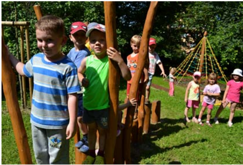
MŠ BOHUMÍNSKÁ. Děti si užívají nově upravené zahrady.

Každá ze zahrad měla připraven svůj vlastní projekt, který byl zpracován odborem školství a kultury ve spolupráci s odborem investičním. V rámci projektu byla vždy provedena úprava školní zahrady, regenerace zeleně, došlo k vybudování „živého“ centra a instalaci prvků pro výuku, pohyb a hry na zahradě. Chceme tak podpořit pěstování kladného vztahu dětí k péči o životní prostředí, umožnit jim venkovní teoretickou i praktickou výuku environmentální výchovy prostřednictvím učebních altánů z akátového dřeva. Děti se budou přímo na zahradě věnovat