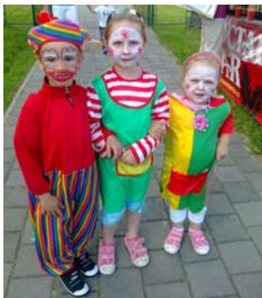
S KLAUNEM. Spousta zábavy v MŠ Koblov. FOTO/ARCHIV

Klauni, skákací hrad, kolo štěstí, spousta zábavy – to vše a mnoho dalšího provázelo jedno květnové odpoledne děti z MŠ Koblov a okolí na multifunkčním hřišti. O zábavu se postaral klaun Hopsalín. Děti nadšeně tancovaly i soutěžily.