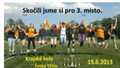
HASIČI. Velké úspěchy v soutěži Plamen.