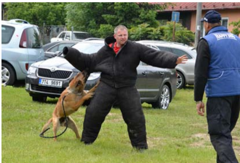
HRUŠOV. Kynologové v Hrušově soutěžili O Pohár starosty Slezské Ostravy.

Kynologové ze ZKO Ostrava-Muglinov a ZKS Poodří pořádali v sobotu 25. května soutěž záchraných a obranných prací O Pohár starosty Slezské Ostravy.