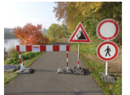
Uzavřená stezka k Hornickému muzeu.