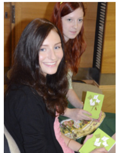
ALMANACH. Mladé básničky při křtu almanachu.