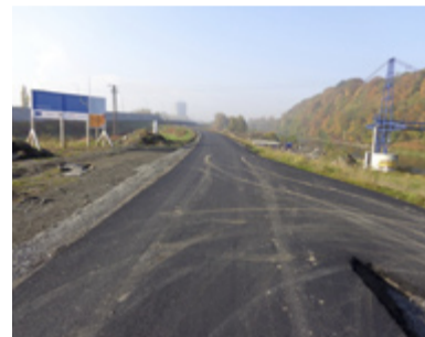
U Koblavského mostu.

I v roce 2014 bude výstavba nových cyklostezek na území Slezské Ostravy pokračovat.