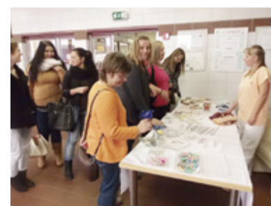
OTEVŘENO. Návštěvníky Domova Barevný svět zaujala nejen výstava rukodělných prací zdejších klientů.

V rámci celostátního Týdne sociálních služeb, který každoročně pořádá počátkem října Asociace poskytovatelů sociálních služeb České republiky ve spolupráci s ministerstvem práce a sociálních věcí, se 9. října uskutečnil podzimní Den otevřených dveří také v zařízeních Čtyřlístku – centra pro osoby se zdravotním postižením v Ostravě, patřícího k největším poskytovatelům sociálních služeb v našem kraji. Na území městského obvodu Slezská Ostrava působí dvě pobytové služby Čtyřlístku, Domov Barevný svět a Domov na Liščině. Včerejšího Dne otevřených dveří využilo k prohlídce obou domovů celkem 48 návštěvníků z řad veřejnosti, odborných škol, ale také zaměstnanci jiných zařízení v našem kraji. V Domově Barevný svět navíc