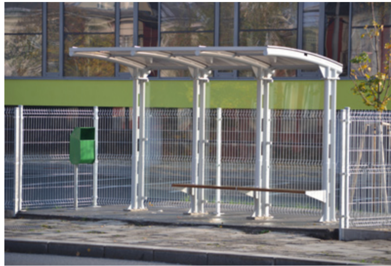
ZASTÁVKA. Novinka na Vratimovské ulici.