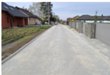
K MALIŇÁKU. V Heřmanicích je opraveno.