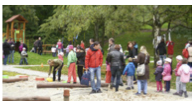
SLAVNOST. Rodiče s dětmi na nově zrekonstruované zahradě. FOTO/ARCHIV

Nový školní rok přivítali děti a rodiče mateřských škol Bohumínská, Frýdecká, Nástupní a Slívova Zahradní slavností. A to mimo jiné i u příležitosti otevření nově vybavené zahrady. V odpoledních hodinách 20. září si přišly děti užít skákací hrad a hlavně splnit úkoly na stanovištích. Největší radost měly z nové trampolíny a všechny průlezky byly