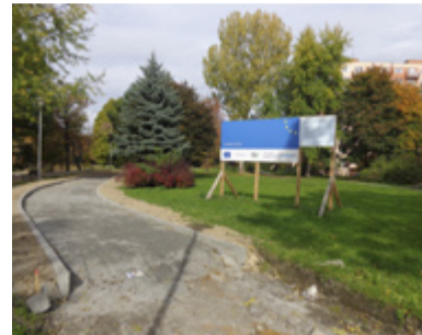
Cyklostezka na sídlišti.