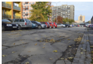
KAMENEC. Parkoviště čeká rekonstrukce.