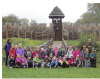
CHOTĚBUZ. Žáci z Muglinova se vypravili do Těšínského Slezska.

Poslední zářijový pátek se 70 dětí z 1. stupně ZŠ Pěší vydalo poznávat život našich slovanských předků