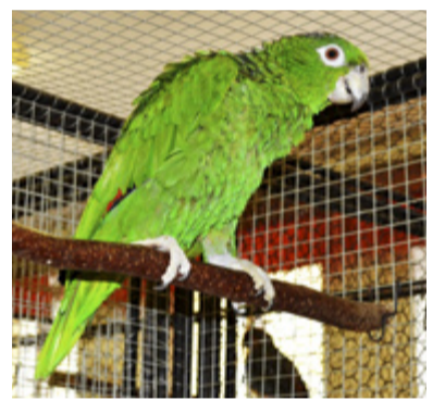
AMAZOŇAN. Exotika na Hladnově.