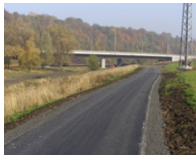
Úsek vedoucí do Koblava.

Na cyklostezku je nyní zákaz vjezdu i vstupu a dodržování zákazu hlídají městští policisté