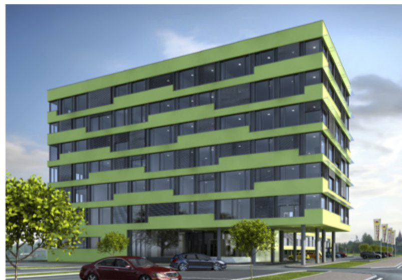
BUDOUCNOST. Administrativní budova v plánech architektů.