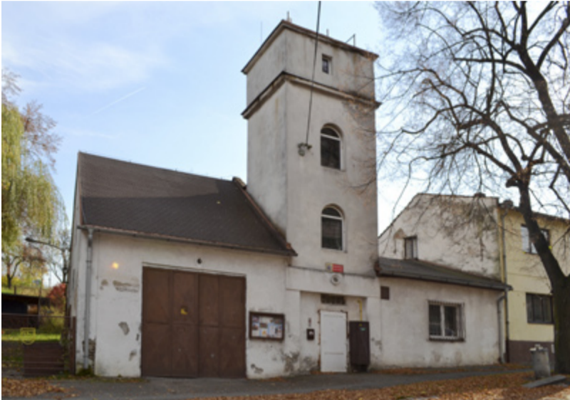
NEVYHOVUJE. Stará zbrojnice v Muglinově dosluhuje.