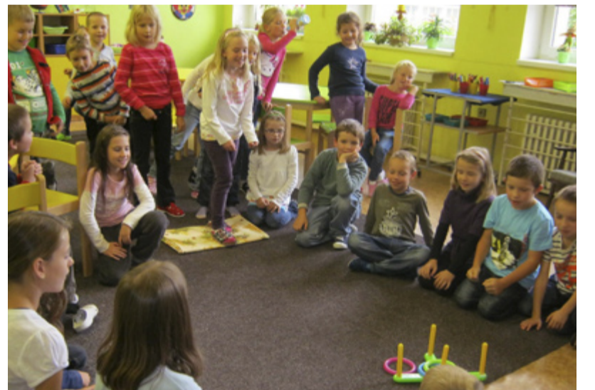
SPORTU. ZŠ Pěší žila týden sportem.