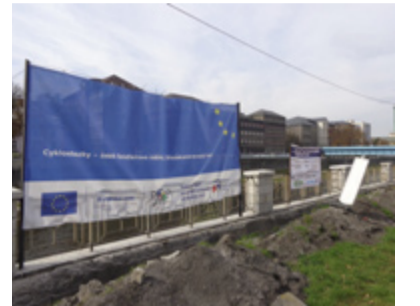
Ze Seidlerova nábřeží na hrad.