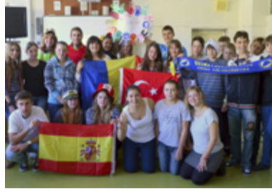
EDISON. Žáci z Bohumínské se svými zahraničními kolegy během unikátního projektu.