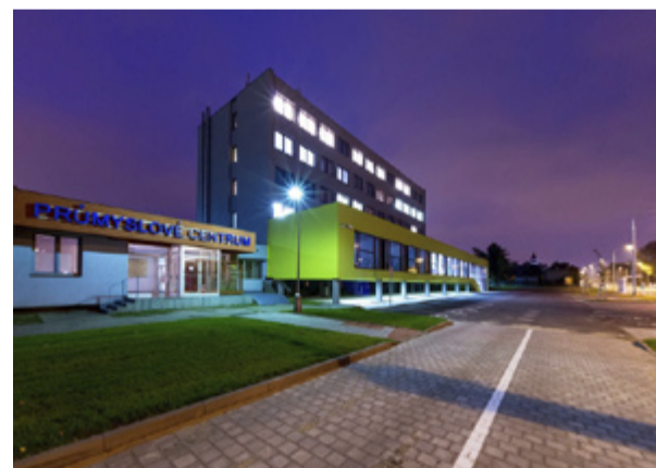
VEČER. Průmyslové centrum po setmění.