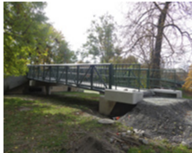
Nájezd na lávku.