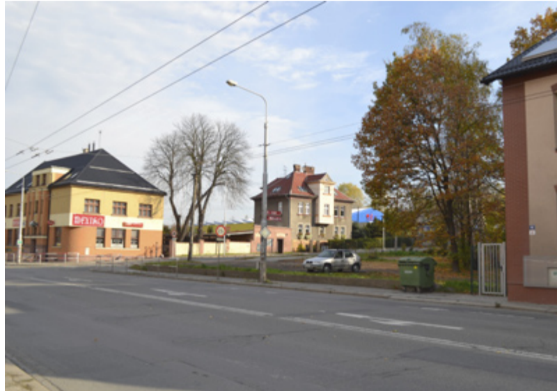
MÍSTO PRO ZBROJNICI. Hasiči se budou stěhovat na roh Bohumínské a Hladnovské ulice.

MUGLINOV / Nová hasičská zbrojnice má vyrůst u restaurace Mexiko na rohu ulic Bohumínské a Hladnovské.