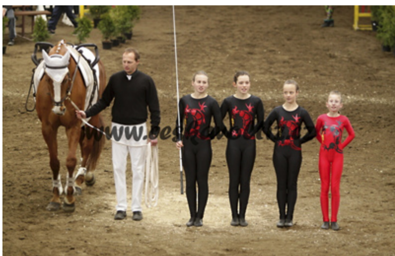
MISTROVSTVÍ. Voltížní oddíl Drago úspěšně reprezentoval Slezskou Ostravu na mistrovství republiky.