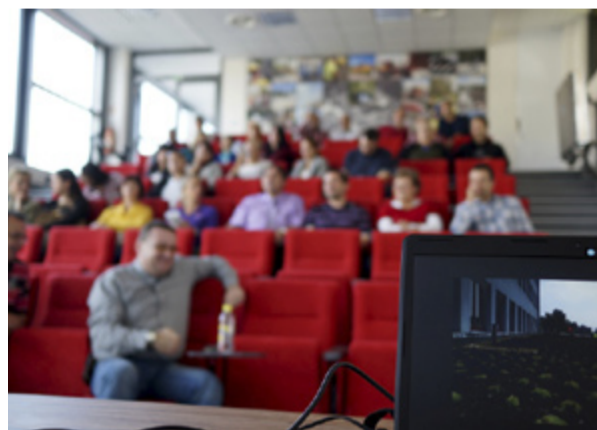
ŠKOLENÍ. Uvnitř auditoria.