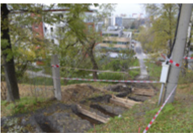
DOBROVOLSKÉHO. Stavbaři pracují na nových schodech.