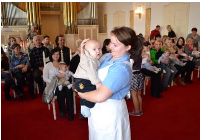
VÍTÁNÍ. Při obřadu na radnici se dětem věnují i budoucí zdravotní sestry.