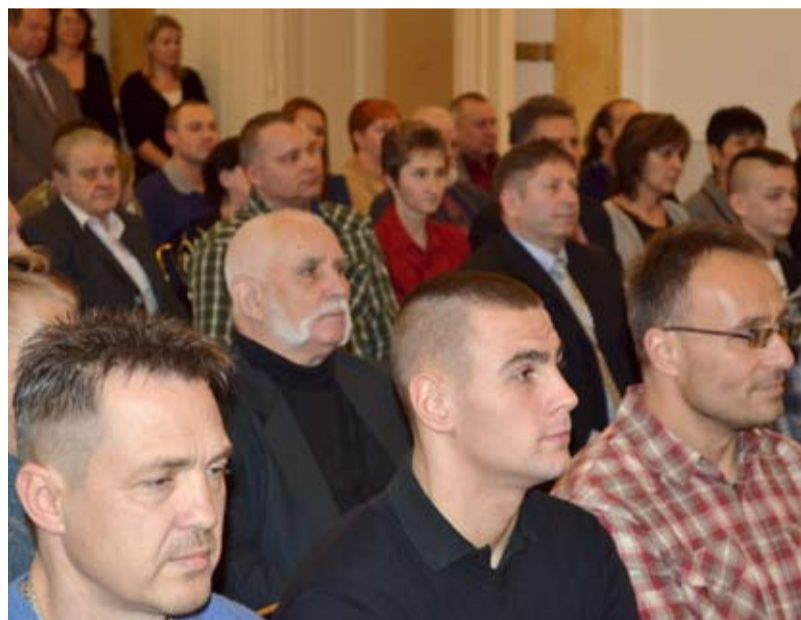
SLAVNOST. Ocenění i jejich příbuzní a známí zaplnili obřadní síň radnice.

Došlo i na fotbalisty. A to zejména z oddílu TJ Jiskra Hrušov, který