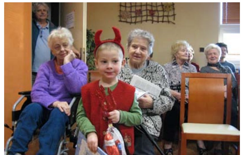
BESÍDKA. Děti z MŠ Požární vystoupily v DPS Hladnovská. FOTO/ARCHIV