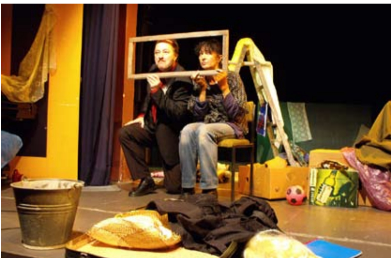
SILESIA. Jediný divadelní profesionální soubor ve Slezské Ostravě chystá nový projekt.