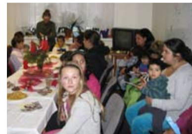
MIKULÁŠ. Mikulášská besídka v Azylovém domě.

Dne 6. prosince připravili pracovníci Azylového domu pro děti a jejich rodiče mikulášskou besídku. Čtvrteční