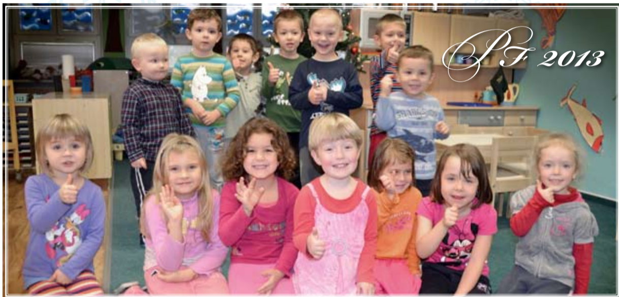
PF 2013! Děti z Mateřské školy Požární přejí všem občanům Slezské Ostravy šťastný Nový rok.