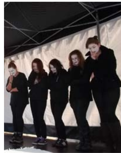
NA TRZÍCH. Během vánočních trhů nechyběla pantomima ani koledy.