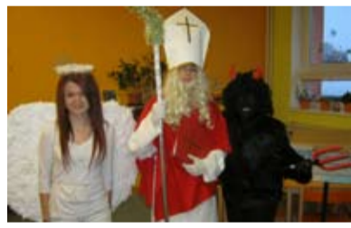
BESÍDKA. Tři desítky malých čertů a čertic na Pěší.