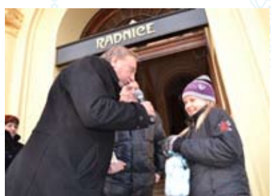
ČESKÝ JEŽÍŠEK. Zazpívat si, dostat balonek, vypustit, vyhrát hračku. To vše šlo před radnicí.