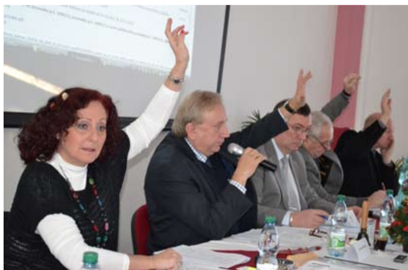
SCHVÁLENO. Představitelé Slezské Ostravy schválili rozpočet obvodu pro rok 2013.

odborů pro zabezpečení jejich činností. Výdaje všech odborů byly rozpočtovány ve výši schváleného