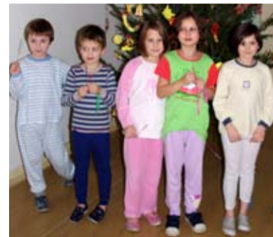
SPANÍ. Kvůli Vánočnímu čtení děti ve škole dokonce i spaly.