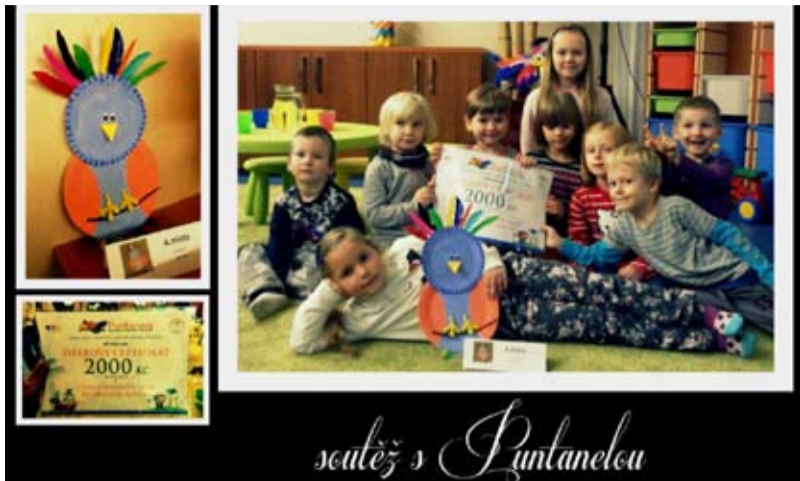
PUNTANELA. Děti vyrazily do nového nákupního centra.

Děti z MŠ Jaklovecká se zúčastnily výtvarné soutěže o nejhezčího papouška Puntanáška, kterou vyhlásilo rodinné centrum Puntanela z OC Nová Karolina. Úkolem bylo vyrobit originálního papouška, odevzdat v rodinném centru a čekat, zda se právě jejich papoušek bude porotě líbit.