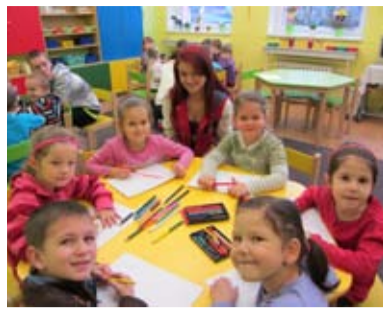
VE ŠKOLE. Předškoláci si vyzkoušeli velikost školních lavic.