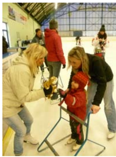
BRUSLENÍ. Děti z Bohumínské se v Bohumíně rozjely.