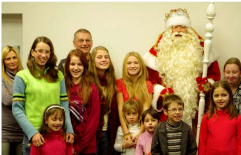
DĚDA MRÁZ. S žáky studujícími ruštinu na ZŠ Bohumínská se sešel Děda Mráz.

Před Vánocemi se děti ve škole učily, které tradice se k tomuto svátku váží. Žáci 7. a 8. třídy, kteří se učí ruský jazyk, projeví zájem dovědět se, jak tyto vánoční svátky a vítání nového roku probíhají