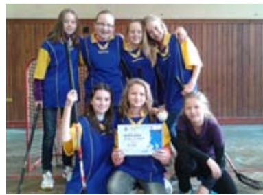
FLORBAL. Zástupci ZŠ Peší se probojovali do dalšího kola.