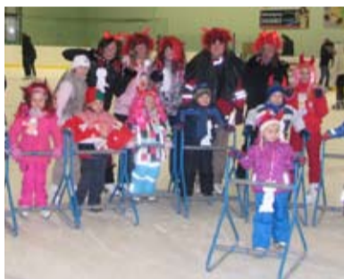
NA BRUSLÍCH. Děti z Koblova bruslily v Bohumíně i s čerty.

MŠ Koblov pořádá každý rok na zimním stadionu v Bohumíně několik sobotních bruslení pro děti, jejich rodiče a známé. Ani tento rok nechybělo Mikulášské bruslení s čerty. Děti musely projet „pekelnou dráhu“ a za odvahu dostaly malou pozornost. Všichni měli dobrou náladu a rádi jsme viděli i děti, které navštěvovaly naši školku v minulých letech.