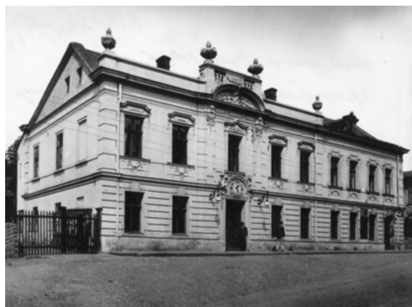
2. 12. 1898. Již neexistující budova, kde sídlila obecní spořitelna.

Později spořitelna změnila několikrát své působiště a teprve v roce 1929, již jako Městská spořitelna ve Slezské Ostravě (přejmenována byla v roce 1918), otevřela na Záměstí v blízkosti říšského mostu nové reprezentativní sídlo. Dodnes stojící budova s Šalounovými sochami a moderně prostorově řešenými interiéry tehdy byla nejvýstavnější stavbou v obci.