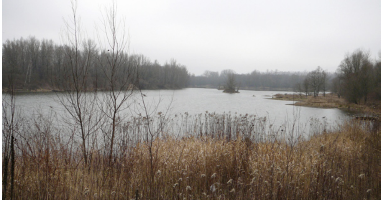
KOBLOVSKÁ JEZERA. Vznikne zde naučná stezka pojmenovaná po místním kronikáři?