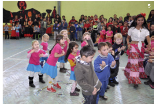
MIKULÁŠ. Nejrůznější návštěvy Mikulášů, andělů i čertů čekaly děti v ZŠ Chrustova /1/, v MŠ Jaklovecká a Komerční /2/, v ZŠ Pěší /3/ v KD Heřmanice /4/ i v ZŠ Na Vizině /5/.

Pěší, aby si užily svou Mikulášskou noc s pohádkou. „Na příběhu pohádkové knihy A. Lindgrenové Petr a Petra předvedly, že již jsou čtenáři. Tohoto úkolu se děti zhostily zodpovědně, a poté byly pohádkovou vílou pasovány na čtenáře. V tento večer však rozhodně nemohl chybět ani Mikuláš, anděl a čert. Jejich návštěva byla sice strašidelná, přesto však milá a všechny děti dostaly zaslouženou nadílku. Noc ve spacáku byla pro