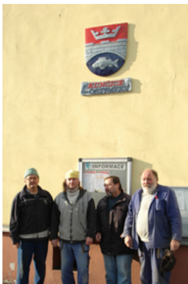
KUNČICE. Nový keramický znak místní části zdobí budovu pošty v Kunčicích.