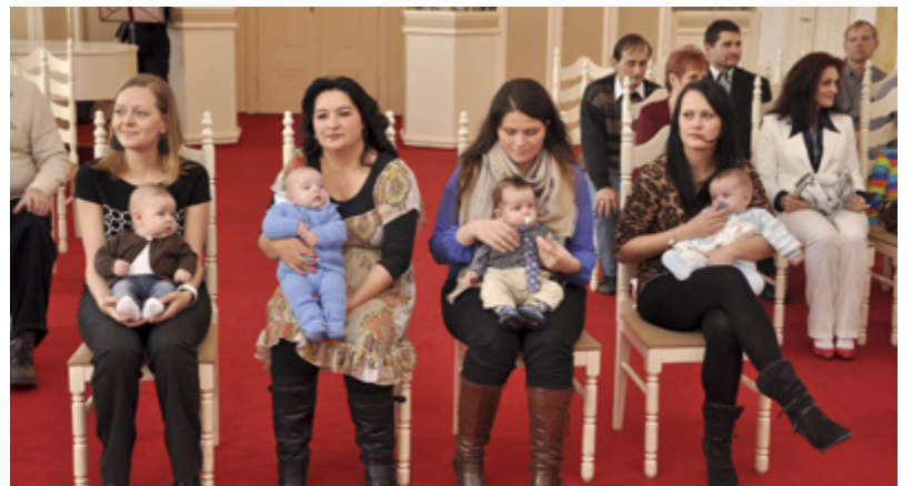
VÍTÁNÍ. Občánky čekalo vítání na slezskoostravské radnici.

Další vítání občánků se na radnici uskuteční 1. února. Na řadu přijdou děti, které se narodily ve druhé půli října, v listopadu a v prosinci. /red/