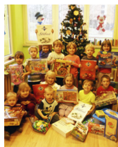
NADÍLKA. Ježíšek naděloval v MŠ Bohumínská.

Předvánoční veselí pokračovalo 2. prosince zhlédnutím divadelního představení O zlaté rybce. Mikuláš přišel do mateřské školy 5. prosince a nadělil dětem nejen balíček dobrot, ale i spoustu her. Následující den přiletěli andělé ze základní školy Bohumínská a společně si