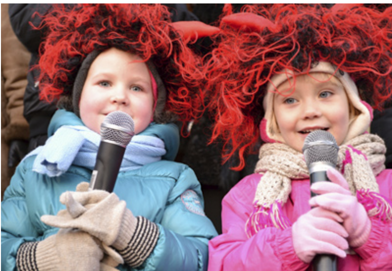
ČERTÍ ROJENÍ. Děti zpívaly a přednášely před radnicí.

dětí odměnili zástupci obvodu malými vánočními dárečky. Starosta Antonín Maštališ všechny pozval na oslavu Silvestra před radnicí, místostarostka Hana Heráková popřála všem zúčastněným šťastné Vánoce. Na závěr, když už nebe potemnělo, byl na znamení přicházejících Vánoc rozsvícen vánoční strom a nebe nad slezskostravskou radnicí prozářil mohutný ohňostroj. /jk/