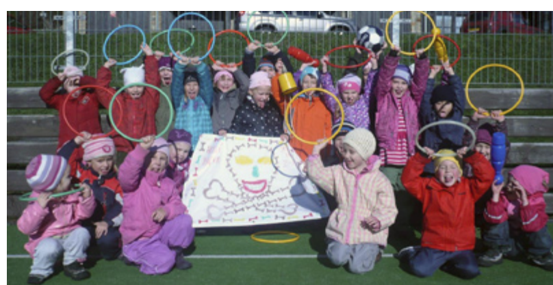
POBYT. Děti ze slezskoostravských mateřských škol na ozdravném pobytu v Beskydech.