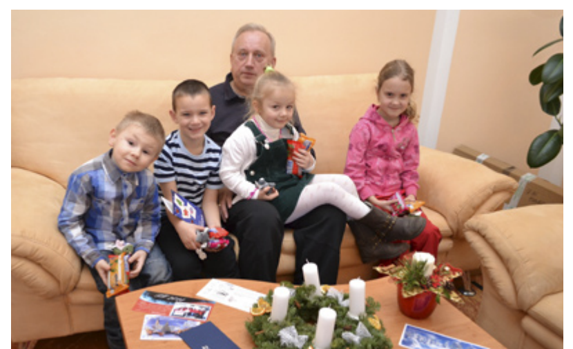
NÁVŠTĚVA. Děti navštívily také kancelář starosty.