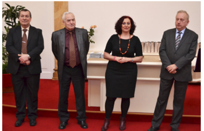
TRADICE. Vedení městského obvodu Slezská Ostrava oceňuje občany každý rok.

kteří jako občané dělají pro Slezskou něco navíc,“ řekl.