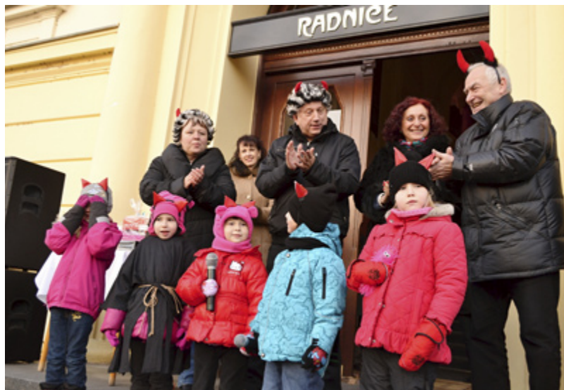
POTLESK. Výkony dětí oceňovalo vedení městského obvodu.