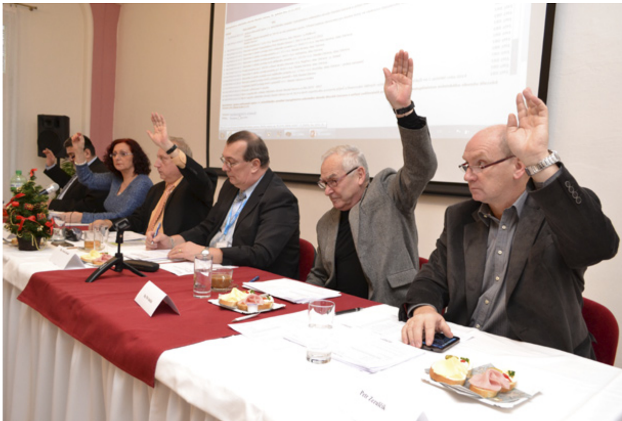
SCHVÁLENO. Rozpočet Slezské Ostravy pro rok 2014 schválili zastupitelé 12. prosince.

Celkové příjmy roku 2014 jsou cca o 12 mil. Kč vyšší než v roce 2013. Toto zvýšení je způsobeno zapojením předpokládaného přebytku z roku 2013 ve výši 15 mil. Kč a navýšením příjmové položky daně z nemovitosti. Jinak předpokládáme ostatní příjmy přibližně ve stejné výši jako v roce 2013. Nejsou zde však uvedeny příjmy