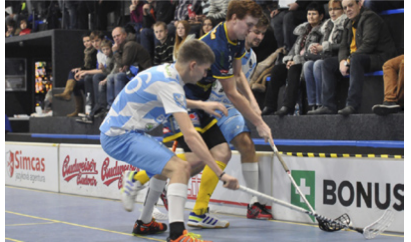
EXTRALIGA. Florbal má stále větší hráčskou základnu i diváckou obec.

Fanoušci podporují i ženský a juniorský extraligový tým. Málokdy jich přijde na zápas méně než dvě stovky. „Vstupné je symbolické. Na zápasy mužů se platí 30, za vstupné na utkání žen a juniorů dají návštěv-