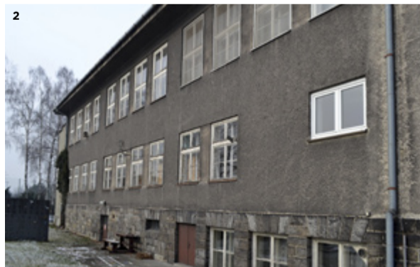
2) ANTOŠOVICE. Z bývalé mateřské školy bude domov pro seniory.