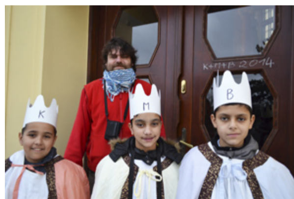
JDEME K VÁM. Tři králové před radnicí a v kanceláři starosty.