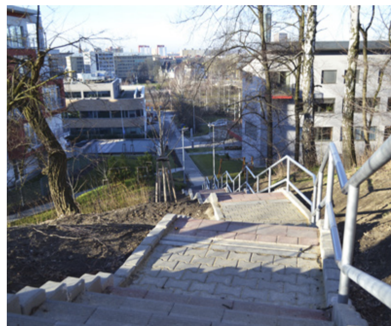
DOBROVOLSKÉHO. Nové schody ve Slezské Ostravě.