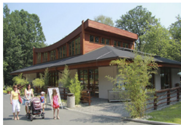
NÁVŠTĚVNICKÉ CENTRUM. Po dlouhých letech funguje v zoo opět restaurace.