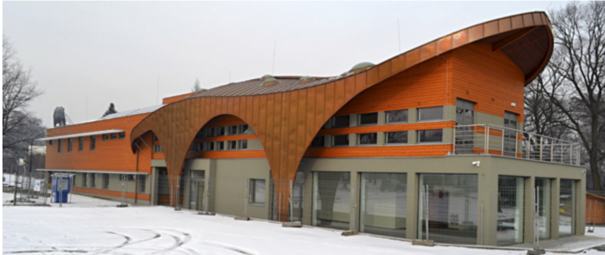
VSTUPNÍ BUDOVA. Již brzy projdou návštěvníci ostravské zoo novým vchodem.

V roce 2013 pokračovala stavba několika velkých projektů, které byly zahájeny už v roce 2012. Jednalo se zejména o Pavilon evoluce, kam se přestěhuje skupina šimpanzů nebo unikátní skupina vzácných kočkodanů Dianiných a nově zde přibudou zcela noví zástupci řady druhů ptáků, plazů, ryb i bezobratlých živočichů. Za všechny jmenujme například vousáka senegalského, scinka ohnivého, kraju královskou či veleštira císařského. Pokračovala i stavba Safari asijských kopytníků a vstupního areálu spojeného s administrativní budovou i novým parkovištěm pro návštěvníky. Všechny tyto rozsáhlé stavební komplexy byly ke konci roku takřka dokončeny a budou uvedeny do plného provozu