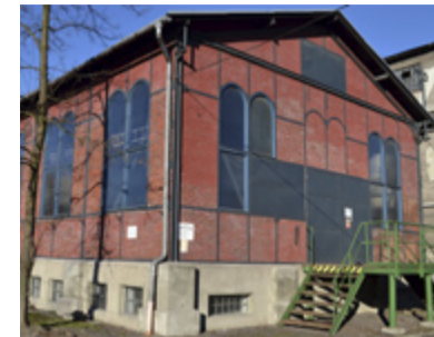
OPRAVENO 2011. Tuto budovu opravili již v roce 2011.