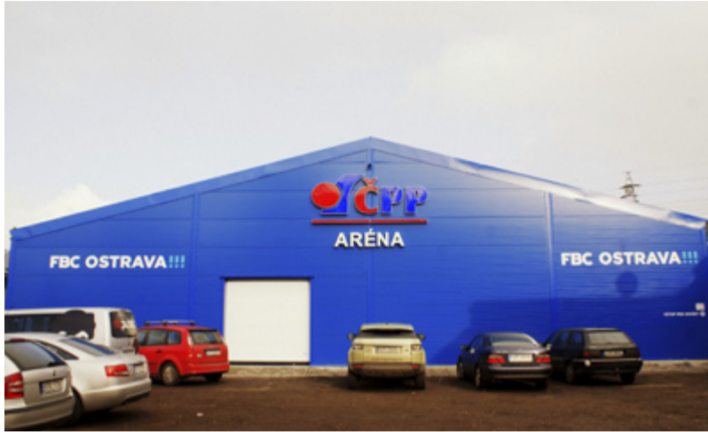
ČPP ARÉNA. Nová sportovní hala v Muglinově.

„Máme dohromady šestnáct florbalových družstev. Kromě extraligy mužů, žen a dětí hrajeme i různé místní soutěže. Ty hrají děti nebo