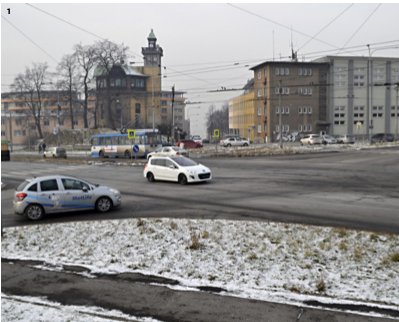
1) HLADNOV. Nebezpečná křižovatka u bývalého Dolu Petr Bezruč.