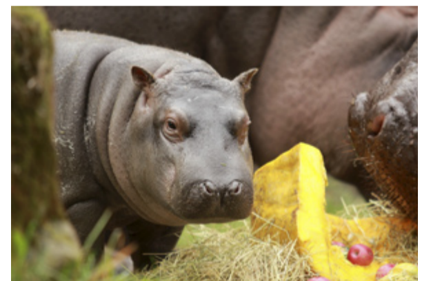
HROCH KVIDO. Hroší sameček se ve Slezské Ostravě narodil loni v červnu.