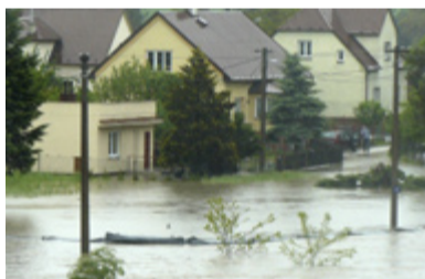
KVĚTEN 2010. Poslední povodeň zasáhla Žabník před více než třemi lety.