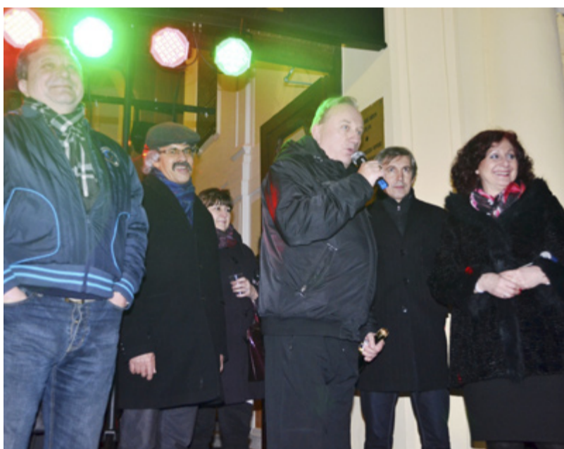
SILVESTR 2013. Stovky občanů přišly před slezskoostravskou radnicí přivítat Nový rok.

„Vím, že se na naše silvestrovské oslavy lidé těší už dlouho dopředu.