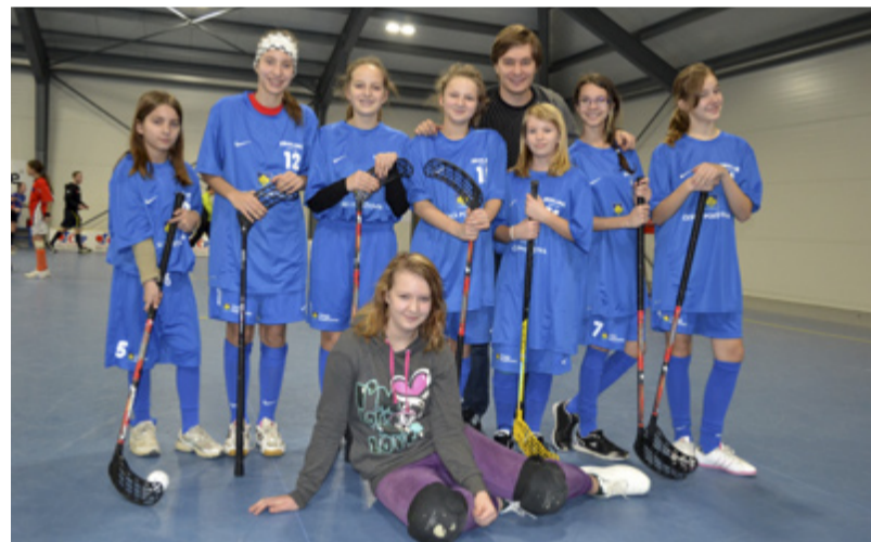
OKRESNÍ KOLO! Žákyňe ZŠ Pěší pokračují dále v turnaji.