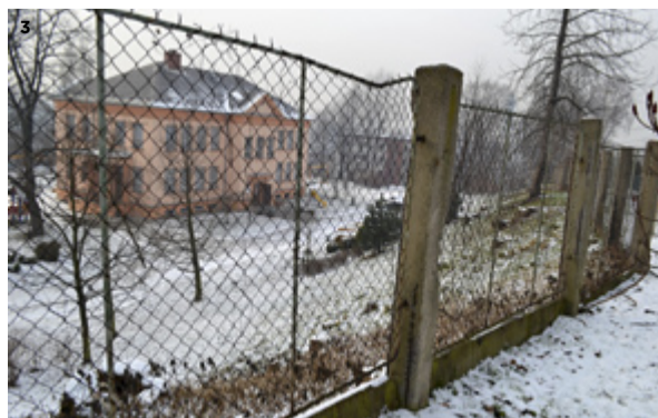
3) MŠ ZÁMOSTNÍ. Plot kolem mateřské školy potřebuje opravu.