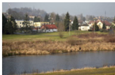
ŽABNÍK. Hráz povede po levém břehu řeky Odry.