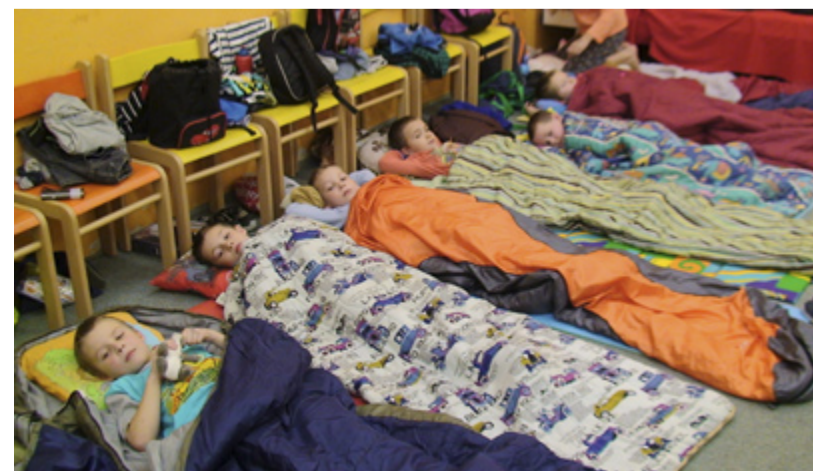
NOCOVÁNÍ. Prvňáčci spali ve škole.