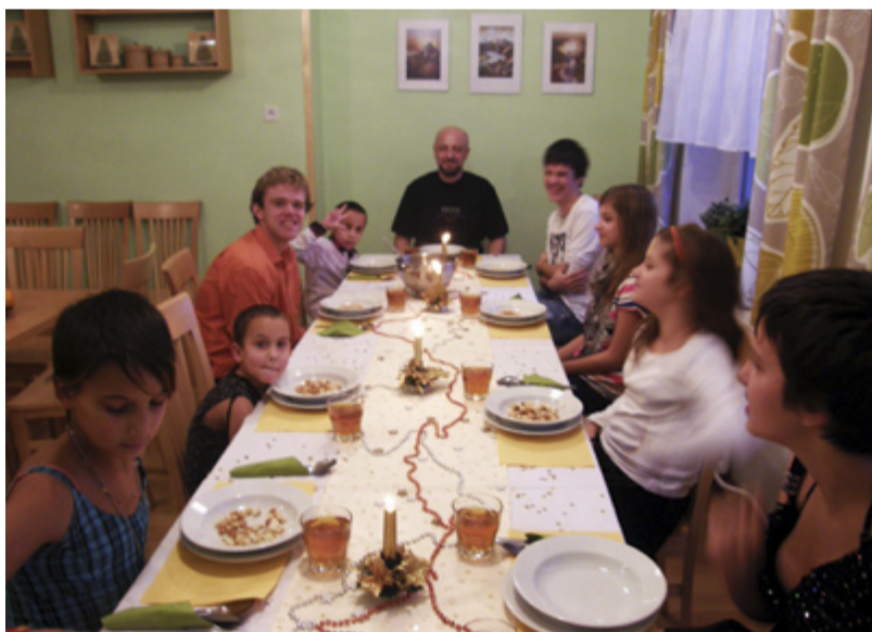
SLAVNOSTNÍ VEČEŘE. Oslava Vánoc v dětském domově.

Středa 18. prosince byla pro všechny děti z Dětského domova ve Slezské Ostravě, na ulici Bukovanského, ve znamení velkých očekávání. Každoročně slavíme Štědrý den o pár dnů dříve, abychom se sešli všichni dohromady a měli možnost prožít tento tradiční svátek společně. Děti i jejich tety a strejdy čekala slavnostní večeře, které dominoval bramborový salát a ryba.