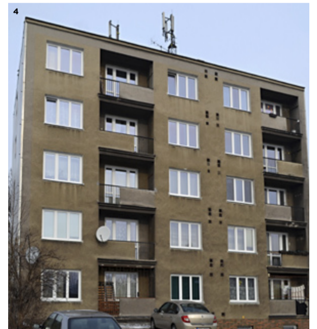
4) VANČUROVA 4. Dům se letos dočká zateplení.

Zasedání zastupitelstva městského obvodu se uskuteční 13. února 2014 od 9.00 hodin v KD Muglínov, ulice Na Druhém č. 4.