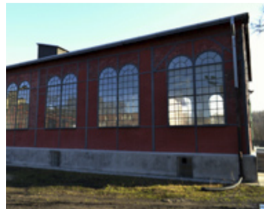
OPRAVENO 2013. Nově opravená budova.

Jaký bude další osud tří chráněných budov po jejich opravě, není zatím jasné. „Budovy mohou být buď prodány, nebo i bezúplatně převedeny například obci, kraji nebo také národnímu památkovému ústavu,“ uvádí Jalůvka. /jk/