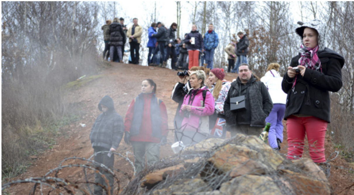
NA EMĚ. 1. ledna bylo na haldě už tradičně rušno.

Letos se konal již 9. ročník novoročního pochodu. Loni byl Schenker za svoji činnost odměněn nečekaných rekordem. Za krásného počasí 1. ledna 2013 přišlo na Emu 1 065 turistů, což