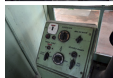
INTERIÉR. Památkově chráněna je rovněž technika ve strojovně.