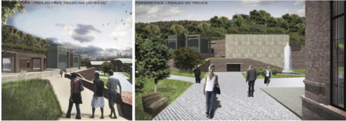
DŮL TROJICE. Studenti architektury předvedou svoji tvorbu také ze Slezské Ostravy.

SLEZSKÁ OSTRAVA / Výstava bakalářských a diplomových prací studentů katedry architektury, VŠB TU Ostrava, FAST prezentuje nejlepší oceněnou studentskou tvorbu posledních třech let, mimo jiné ze Slezské Ostravy a okolí. Ukazuje metody a výsledky, které pomáhají ke zpracování architektonicko-urbanistických témat, včetně problematiky rekonstrukcí. Nabízí 3D architektonické modely, které doprovázejí samotné návrhy.