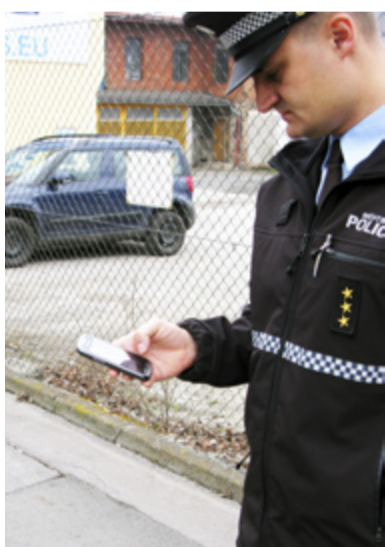
TECHNIKA. Strážníci městské policie testují nové telefony.

Mobilní telefony jsou výrazně lehčí (hmotnost o 330 gramů nižší) a také kvalitní spojení je podstatně lepší a to i v okrajových částech města, kde se při používání stávajících radiostanic potýkáme mnohdy se špatnou kvalitou signálu. Součástí mobilních telefonů je rovněž zařízení umožňující vyslat signál nouze, pokud se strážník dostane do potíží a bude potřebovat posily. Pro mobilní telefony hovoří také podstatná finanční úspora v řádech desítek tisíc korun u jednoho přístroje. Každý strážník má v mobilním telefonu k dispozici také mapu včetně navigace, což usnadní jednak jeho orientaci při výkonu služby a umožní snáze lokalizovat konkrétní místo. Strážníci poměrně často pomáhají občanům nalézt určitý objekt, firmu, dům, úřad. A tady se právě tato aplikace v mobilním telefonu jeví