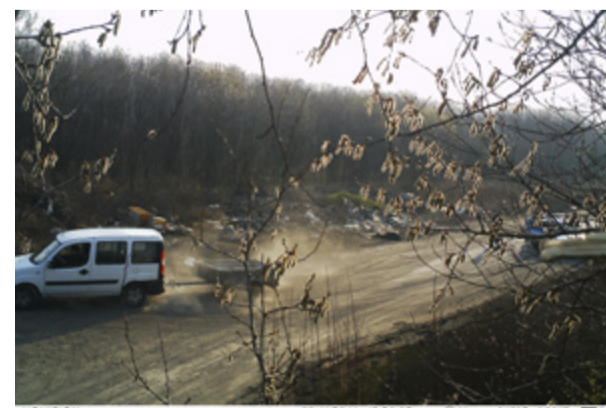
FOTOPAST. Dopadený hříšník zaplatil vysokou pokutu a svůj odpad si musel opět naložit a odvézt.