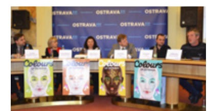
COLOURS OF OSTRAVA. Pořadatelé oznamují, že ve Slezské Ostravě vyrostě kemp.

Mnoho let se mezinárodní hudební festival Colours of Ostrava konal také na Slezskoostravském hradě, letos se na území Slezské Ostravy po dvouleté přestávce vrací. A to v podobě stanového městečka, které v areálu hradu vyrostě. „Již od pondělí 14. července bude otevřen kemp v areálu Slezskoostravského hradu, který na celý týden nabídne ubytování a veškeré zázemí zájemcům i bez vstupenky na Colours of Ostrava, například rodinám s dětmi, turistům či sportovcům,“ říká ředitelka festivalu Zlata Holušová. „Chceme, aby návštěvníci do Ostravy přijeli na celý týden, protože ve městě i okolí je co objevovat. Proto již od pondělí připravujeme zvláštní turistický a sportovní program, jehož přesnou podobu oznámíme