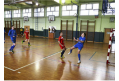
FOTBAL. ZŠ Bohumínská /v červeném/ proti ZŠ Pěší.