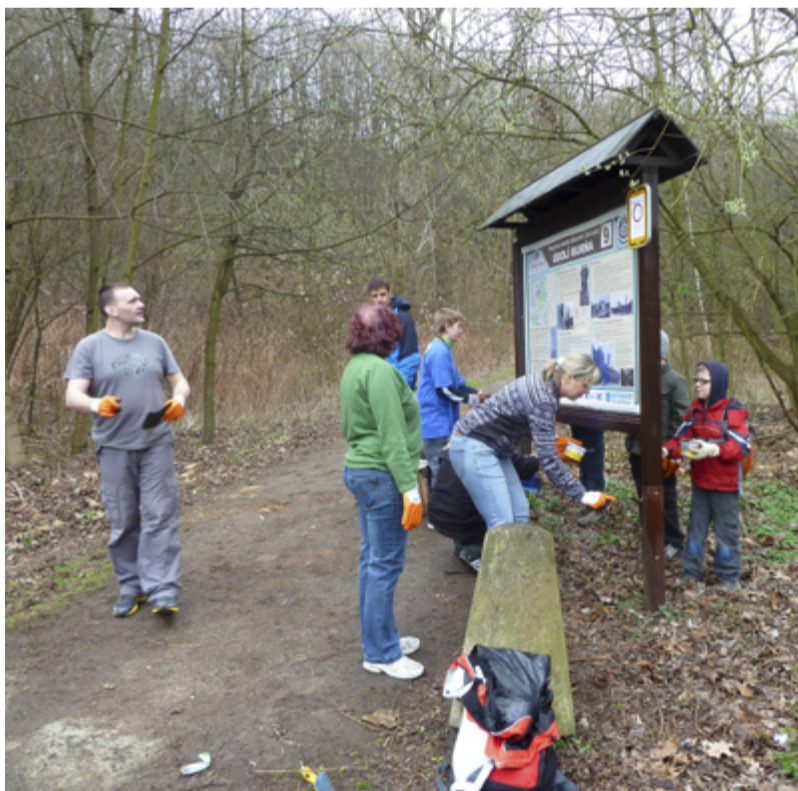
ÚKLID EMY. Naučná stezka je díky turistům vyčištěna.