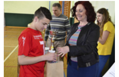
ODMĚNY. Místostarostka předává ceny.

ZŠ Bohumínská rovněž uspěla i ve fotbale. Pohár vyhrála s devíti body, šest bodů získala ZŠ Pěší, tři body ZŠ Chrustova a ZŠ Škrobálkova zůstala bez bodu.