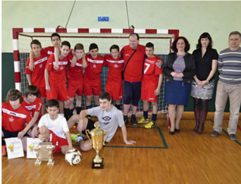
VÍTĚZOVÉ. Nejlepší tým turnaje, ZŠ Bohumínská.