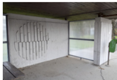
FRÝDECKÁ. Zastávky MHD po opravách.