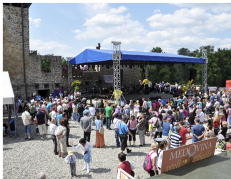
DEN SLEZSKÉ 2014. Letos v sobotu 24. května.