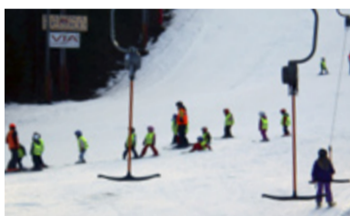
V PALKOVICÍCH. Děti z MŠ Koblov vyrazily na lyže. FOTO/ARCHIV