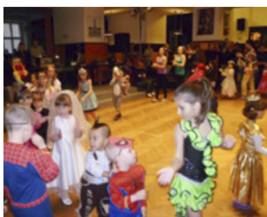
REJ. Děti z mateřské školy v Divadélku pod věží.