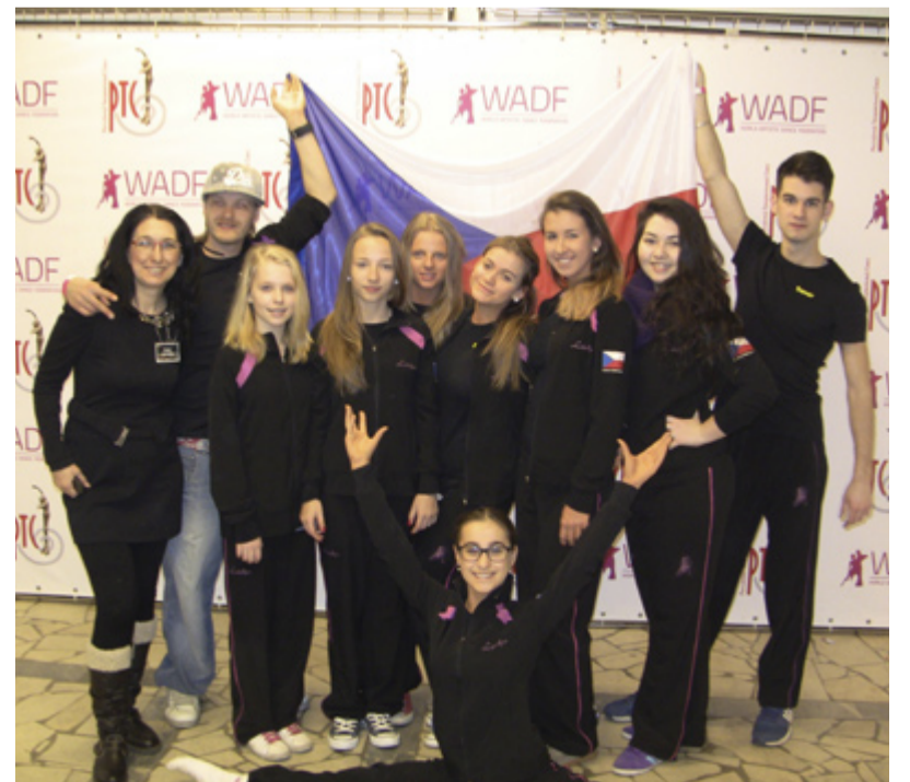
MOSKVA. Úspěšní tanečníci ze Slezské v hlavním městě Ruska.