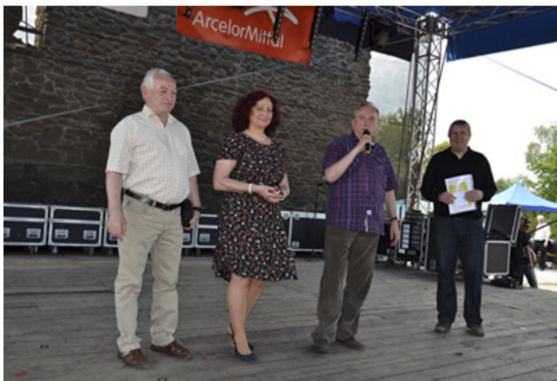
PŘIVÍTÁNÍ. Vedení městského obvodu vítá příchozí na Slezskostravském hradě.