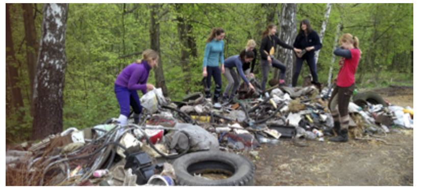
ÚKLID. Členky SK Mušketyr s nasbíranou hromadou odpadu.

Teď už je vše přikryté zelenými lístky, a nepořádku moc vidět není. Měli bychom se nad naším