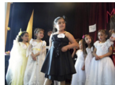
MISS ROMA. Dvaadvacet dívek soutěžilo v Heřmanicích.

také volná disciplína, svá vystoupení zakončily soutěžící děvčata