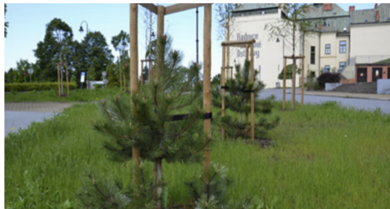
ZELEŇ. Stovky stromů a keřů byly vysazeny u nové okružní křižovatky v blízkosti radnice.

vnímána jako jedna z etap směřující ke zlepšení dopravní obslužnosti Slezské Ostravy a je součástí již dlouhodobě plánované stavby Obvodová komunikace – Františkov. Stavba byla částečně financována z evropských fondů. Celkové náklady činily přes 52 milionů korun. /red/