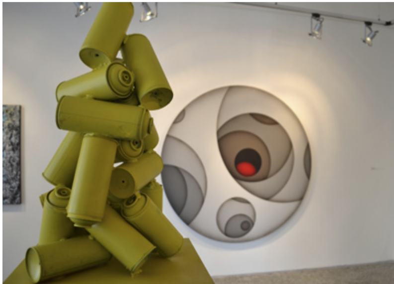
V GALERII. V loňském roce vystavovali v galerii také mladí autoři Chemistry Gallery, Jiří Sibinský, Marek Nenutil nebo Michaela Terčová.

V době konání hudebního festivalu Colours of Ostrava si mohli návštěvníci naší galerie prohlédnout další věkem vystavujících velmi „mladou“ výstavu. Ve spolupráci s pražskou The Chemistry Gallery vznikla hravá expozice sedmi mladých nadějných autorů nazvaná „Plej!“. Věrna svému názvu vyzývala ke hravému přístupu k životu, ale také podle českého významu slova plít k zbabování se plevele ze záhonu současného výtvarného