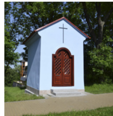
OPRAVENO. Kaplička před a po rekonstrukci.