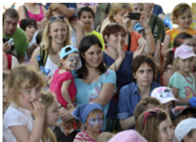
DEN SLEZSKÉ. Spokojení návštěvníci Slezskostravského hradu.