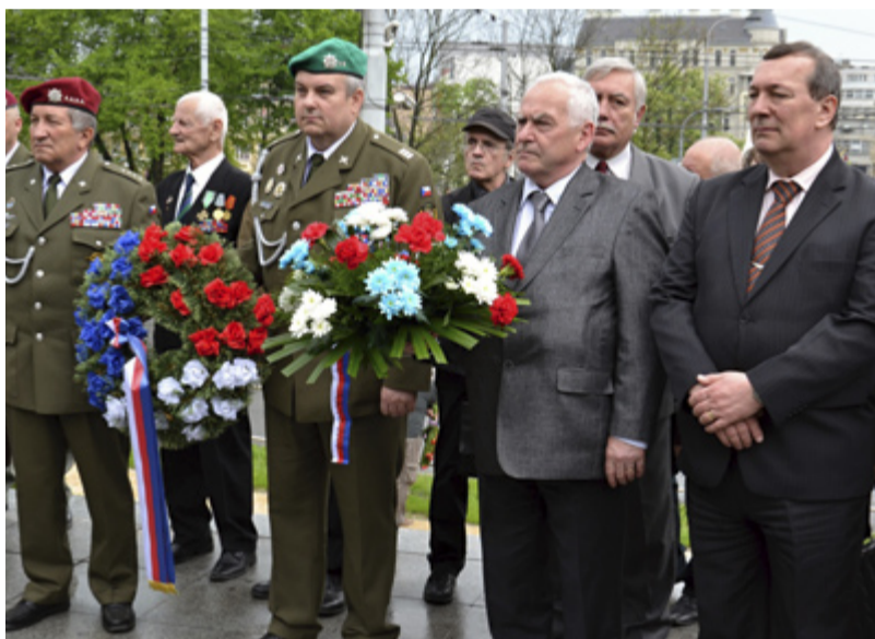
U TANKU. Veteráni spolu se zástupci obvodu u památníku ve Slezské Ostravě. /red/