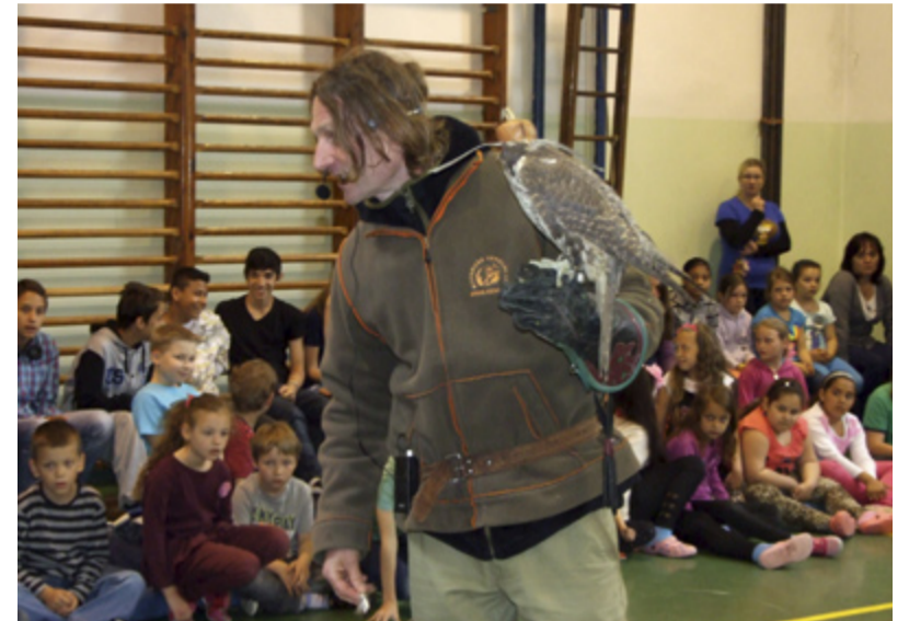
DRAVCI. Žáci ZŠ Chrustova obdivovali dravé ptáky.

Největším zážitkem, který si děti budou z této akce určitě pamatovat, byla ukázka lovu sokola. A to hlavně proto, že součástí jeho letecké trasy byly dvě členky našeho pedagogického sboru. Děti se přesvědčily na vlastní oči, že sokol je