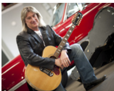
JOHN SCHLITT. Hlavní hvězda festivalu Slezská lilie.

Ostravský festival Slezská lilie představí v červnu legendu i muzikantský dorost. Do Ostravy přijede zpěvák legendární americké skupiny Petra – John Schlitt a kapela složená z dětí špičkových polských hudebníků Arka Noego. Kromě toho nás čeká další spousta zajímavých jmen. Slezská lilie jako mezinárodní křesťanský festival současné hudby přibližuje veřejnosti opomíjený fenomén současné autorské křesťanské hudby. Místo konání festivalu je zasazeno do městské části Ostrava-Kunčičky. Festival se letos uskuteční na dvou venkovních pódii, stejně jako v místním kostele. Nedílnou součástí festivalu je nedělní evangelizační den. Termín festivalu Slezská lilie je 14. a 15. června a v letošním roce je festival propojen s oslavou 20. výročí fungování studia Telepace v České republice.