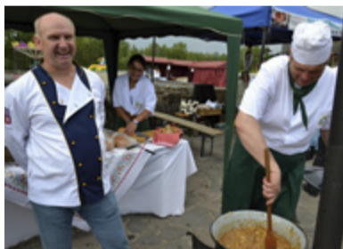
BIGOS. Slezské jídlo se vařilo v kotlích.