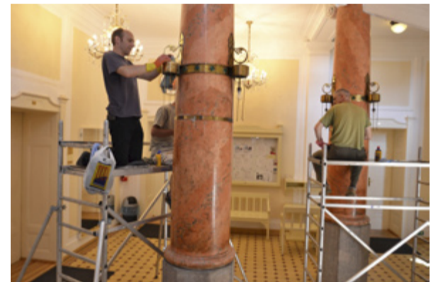
RESTAURÁTORSKÉ PRÁCE. Obnova interiérů slezskoostravské radnice.