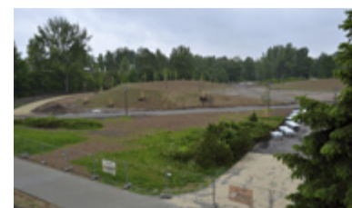
OKOLÍ. Stavení práce by měly být hotovy letos na podzim.

„Již letos jsme původně chtěli do blízkosti Těšínské ulice stěhovat areál Miniuni z výstaviště, ale jeho přestěhování je odloženo na rok 2018. Do té doby by zde mělo vyrůst oplocení nebo obslužná budova,“ uvádí podrobnosti o plánech s okolím hradu Karel Burda. /jk/