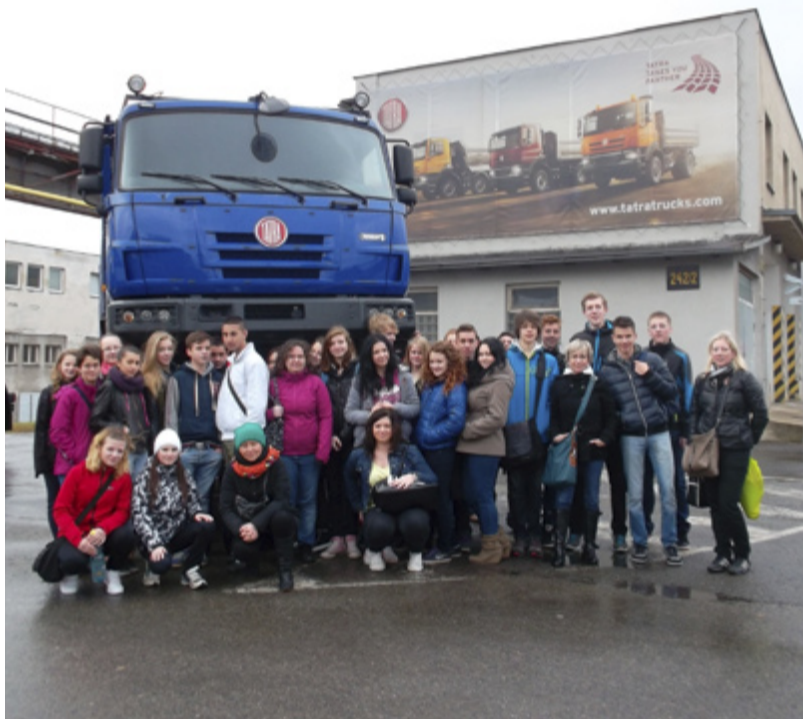
V TATŘE. Žáci si prohlédli automobilku v Kopřivnici.

Osobní, sportovní a nákladní automobily značky Tatra, podvozky, motory, sportovní letoun a další zajímavosti byly opravdu atraktivní podívanou pro naše žáky. Kopřivnickému rodáku, Emilu Zátokovi