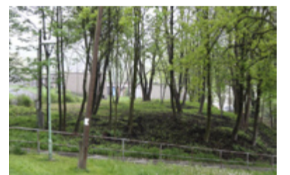
SKLÁDKY. S pozemků mizí nežádoucí odpad.

nizace se na rozdíl od společnosti RPG RE Land, s.r.o. a Baranovec, s.r.o. se svým dilem vypořádaly opravdu ve velmi krátkém termínu. Bakalova RPG RE Land, s.r.o. se neobtěžovala odstranit černou skládku a po jejím zahoření a následném uhašení to museli zajistit pracovníci úřadu.