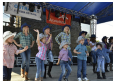
VYSTOUPENÍ. Spolu s dětmi z MŠ Bohumínská vystoupily i jejich maminky.