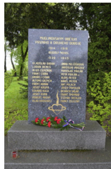
PAMĚTNÍ MÍSTA. Vzpomínka na padlé ve Slezské Ostravě. /red/