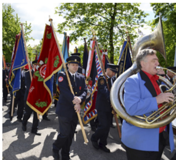
PRŮVOD. Zástupy hasičů kráčely od zbrojnice ke kostelu.

Mimořádná slavnost se konala v sobotu 10. května v Kunčičkách. Místní Sbor dobrovolných hasičů Ostrava-Kunčičky oslavil 115. výročí založení a také se zde uskutečnilo 9. Setkání hasičských praporů. Podobné setkání dobrovolných hasičů z celé Ostravy se v Kunčičkách odehrálo vůbec poprvé.