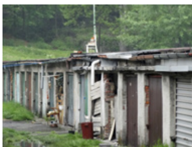
ČIŠTĚNÍ. Garážové areály čeká úklid.