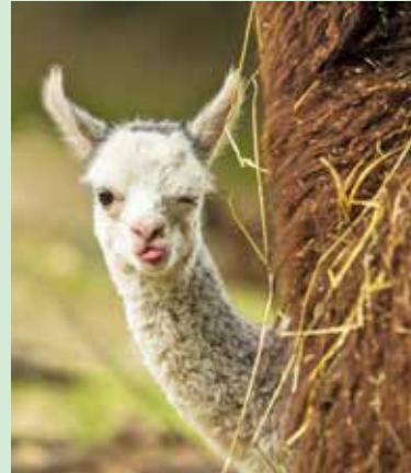
MLÁDĚ. Sebejistá mladá lama.

Ve stádě lam alpak přibyla dvě mláďata, která mohou návštěvníci pozorovat od jejich prvních krůčků. Obě mláďata jsou samičky, první přišla na svět 31. května, druhá 2. června. Mláďata lam, stejně