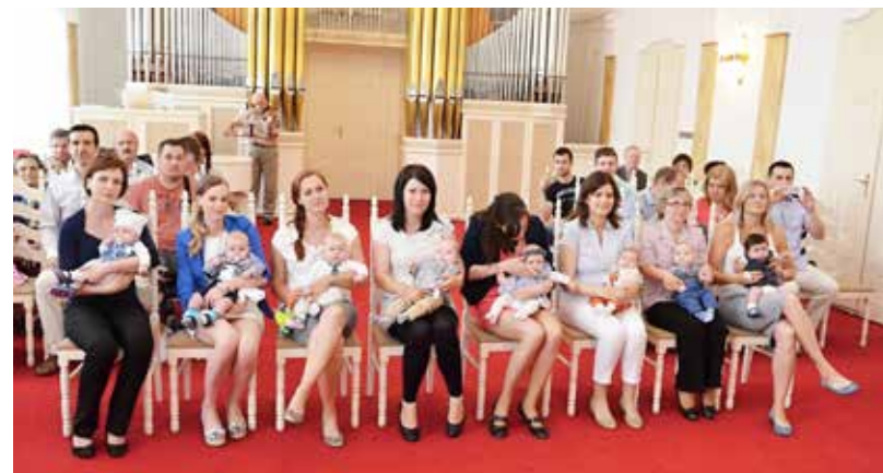
VÍTÁNÍ. Občánky a jejich rodiče ve slezskostravské radnici.