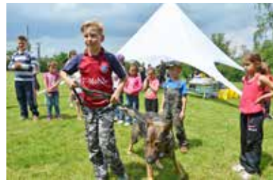
DĚTI A PSI. Malí kynologové v Hrušově.