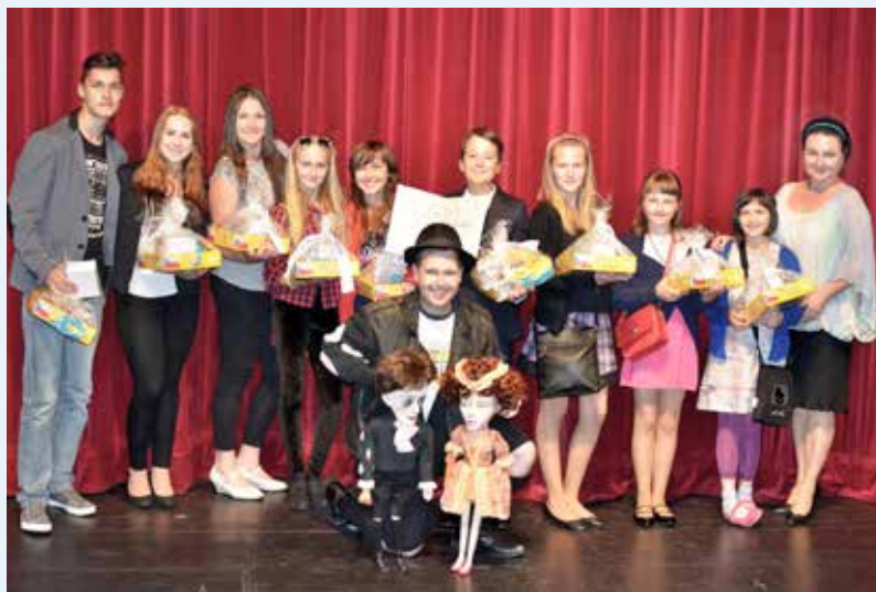
PARLAMENT. Ocenění žáci ZŠ Bohumínská.