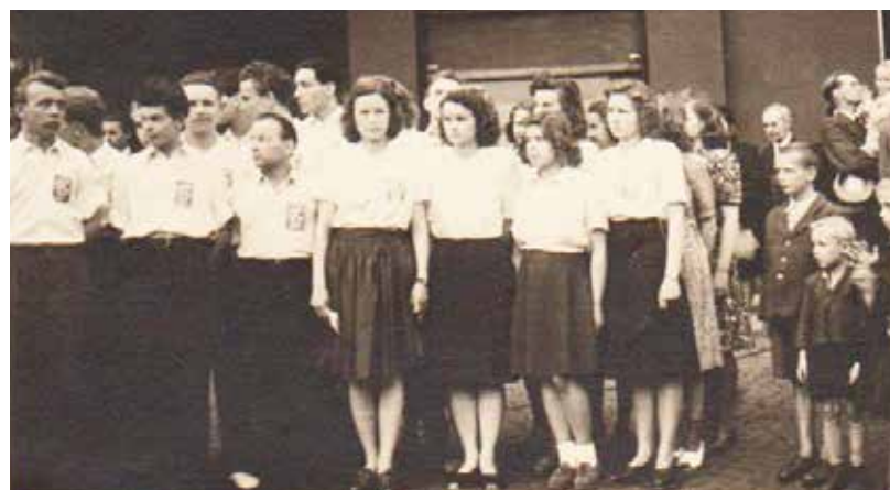
SLEZSKOOSTRAVSKÁ SEDMIČKA. Soubor Svazu české mládeže při vystoupení v prvních poválečných letech.