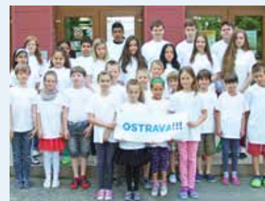
VZHŮRU NA LANDEK. ZŠ Chrustova vyráží na výlet.