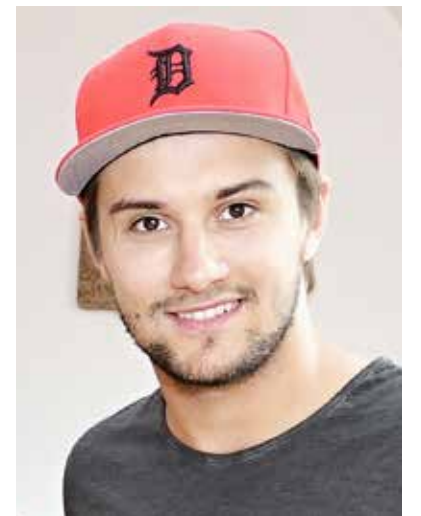
PETR MRÁZEK. Úspěšná sezóna v NHL.