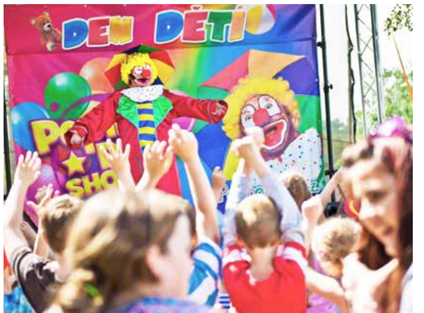
DĚTSKÉ ODPOLEDNE. Sdružení Kultura pro Slezskou Ostravu připravilo pro děti tradiční akci.