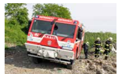
CVIČENÍ. Dobrovolní hasiči v terénu.