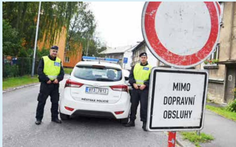
U ZOO. Městská policie a nové dopravní značení v ulicích v blízkosti ZOO.