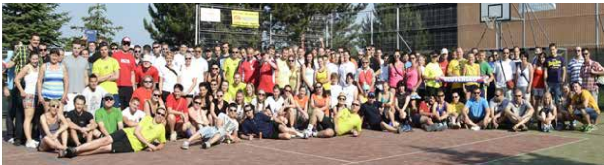
VOLEJBAL. Mezinárodní turnaj se konal ve Slezské Ostravě.