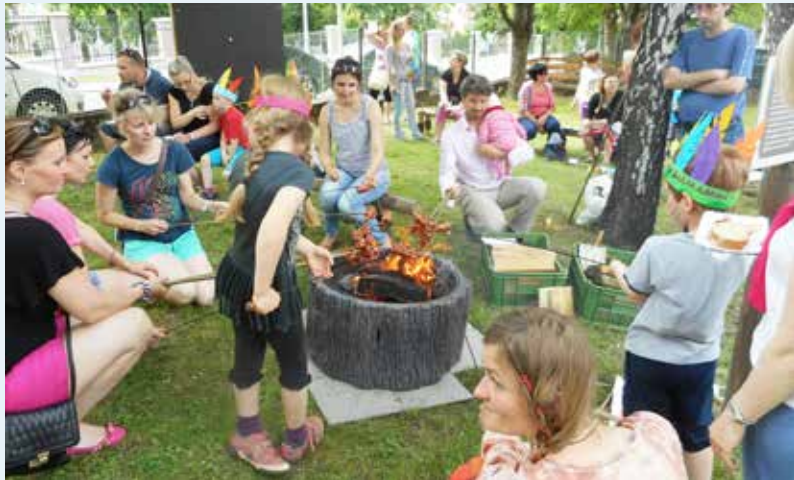
DEN DĚTÍ. Indiáni obsadili mateřskou školu.