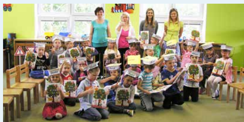
LOUČENÍ. S budoucími školáky se loučili také v MŠ Komerční.