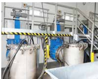
HRÁZ A TECHNOLOGIE. Spolu s hrázi vznikla i přečerpávací stanice, která má odvádět vodu z Žabníku do Odry.

Vážení čtenáři, příští číslo Slezskoostravských novin vyjde až na začátku měsíce září. Připravujeme už nyní nový, modernější formát listu. Všem přejeme krásné prožití letních měsíců, ať už budete trávit čas prázdnin někde v exotické cizině nebo doma ve Slezské Ostravě.