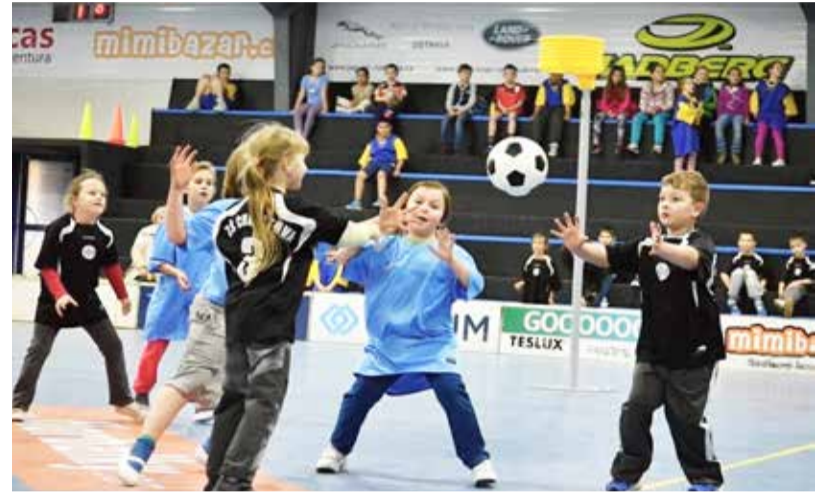
KORFBALOVÝ TURNAJ. Nový sport se prosazuje ve školách.