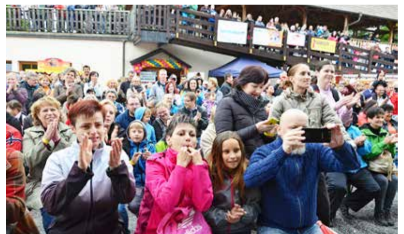
POTLESK. Hradní nádvoří zaplnily stovky spokojených návštěvníků.