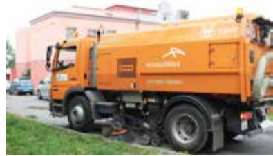
MÝVAL. Čistící vůz v ulicích Slezské Ostravy.