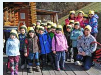
MŠ KOBLOV. Děti na Morávce.

Kolektiv zaměstnanců MŠ Komerčnické a odloučených pracovišť