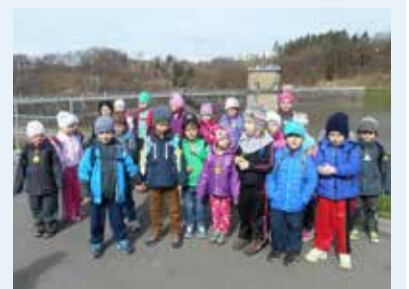
MŠ KOMERČNÍ. Děti v Luhačovicích.