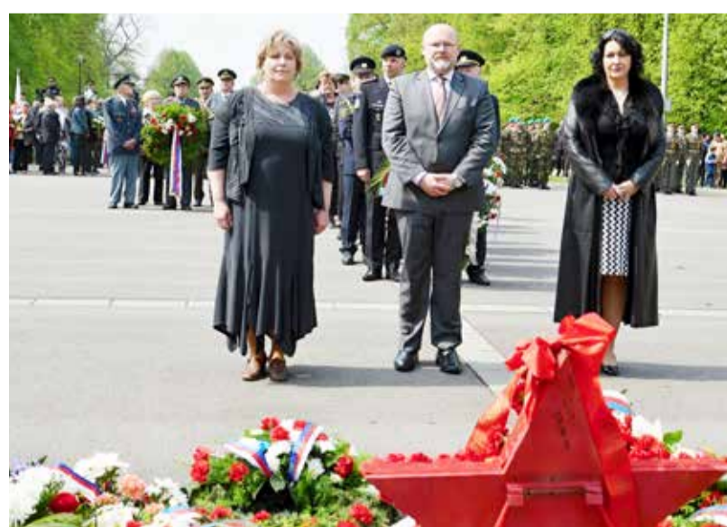
V KOMENSKÉHO SADECH. Slavnostní akt u Památníku Rudé armády.