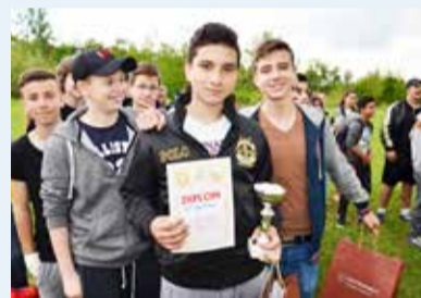
POHÁR. Vítězní fotbalisté ze ZŠ Bohumínská