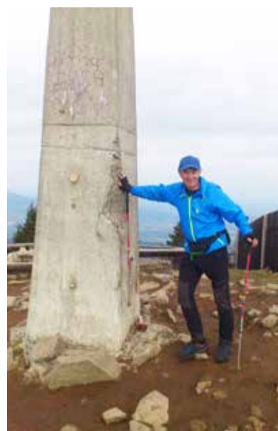
NA LYSÉ. Opět na vrcholu, opět v cíli.