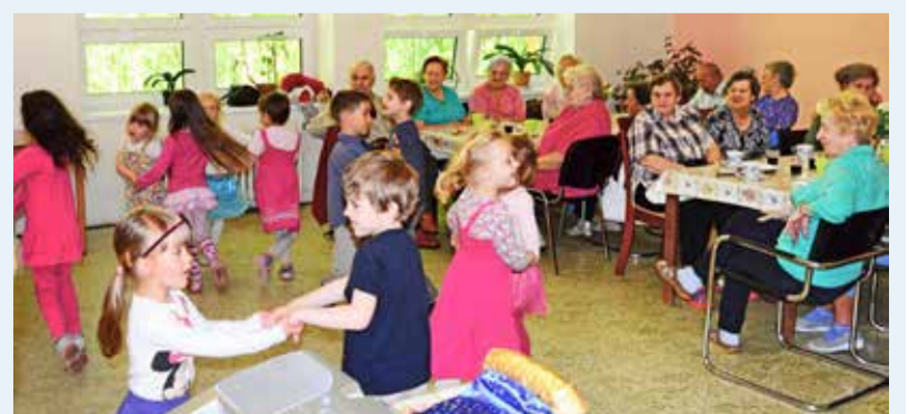
DEN MATEK. Děti z MŠ Chrustova na návštěvě u seniorů.