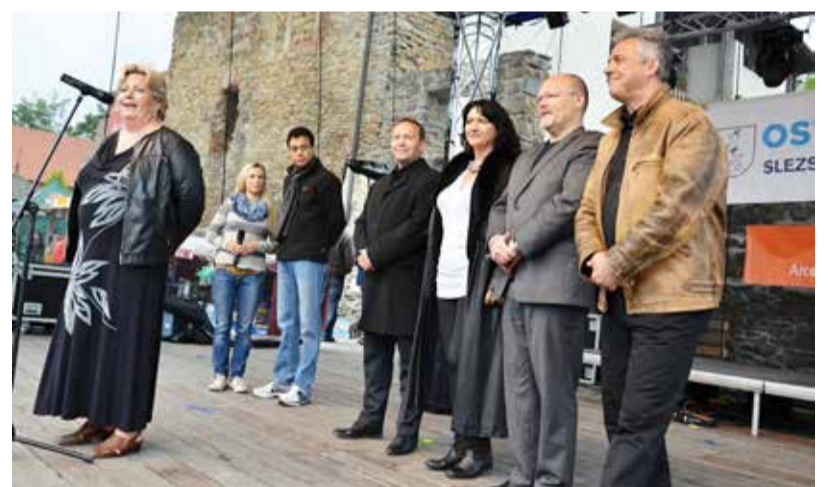
ZAHÁJENÍ. Vedení obvodu Slezská Ostrava přeje všem příjemnou zábavu.