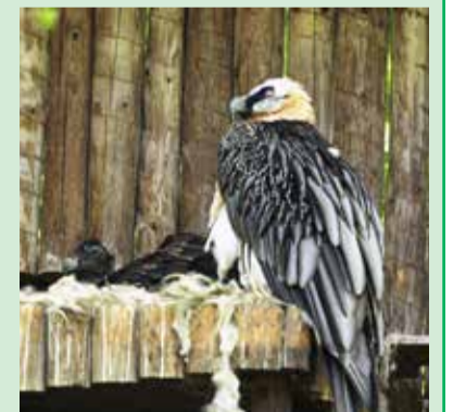
ORLOSUPI. Mládě přišlo na svět 23. února.

zvanému siblicida, kdy starší a silnější mládě usmrtí to menší, pracovníci ZOO druhé vejce odebrali a nahradili je podkladkem. Protože i toto bylo oplozené, podložili je druhému páru, který letos o vlastní vejce přišel. Bohužel líhnutí nakonec nedopadlo dobře.