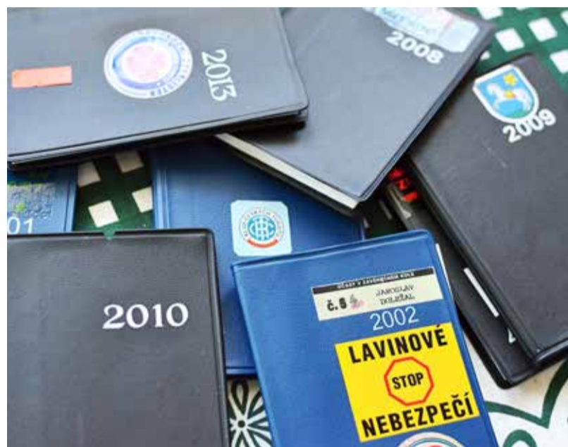
EVIDENCE. Na tisíc výstupů stačí jeden deník.