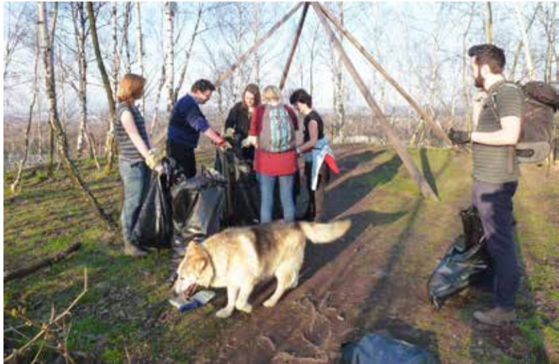
ÚKLID. Turisté našli na haldě haldy odpadků.