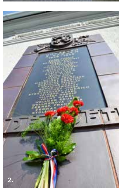
PIETNÍ MÍSTA SLEZSKÉ OSTRAVY. na ulici Na Druhém /1/, na ulici Koněvově /2/. Více foto na www.slezska.cz