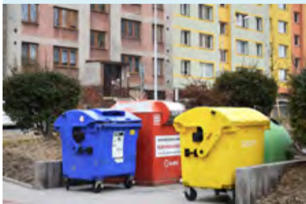
KONTEJNERY. Nový prostor pro odpad na ulici Švédské.