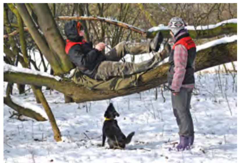
KYNOLOGOVÉ. Ve Slezské začal působit záchranářský oddíl.

Kontakt pro zájemce: info.zachranari@seznam.cz