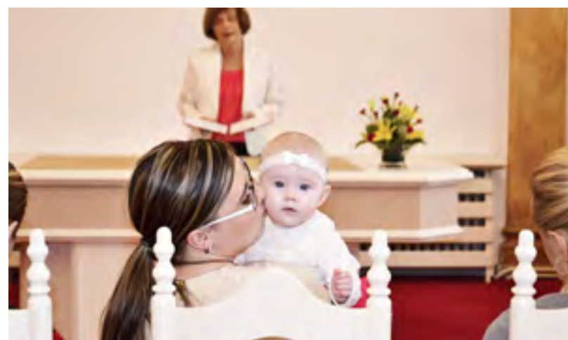
VÍTÁNÍ. Tradiční obřad ve Slezské Ostravě.