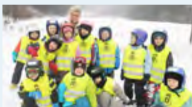
KURZ. Děti z Koblova lyžovaly v Palkovicích.