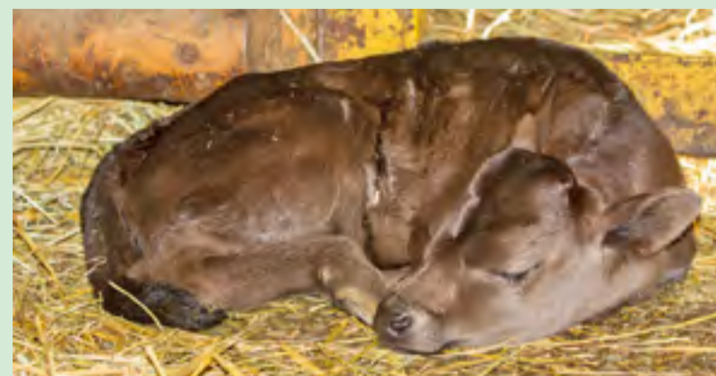
DAHOMÉ. Mládě zakrslého tura domácího, nejmenšího plemene skotu.

9.30 pandy (za pěkného počasí) 10.30 vydry (za pěkného počasí) 11.15 zebry (za pěkného počasí) 13.30 žralučci (SO a NE) 14.00 hroši 14.30 velbloudi (za pěkného počasí)