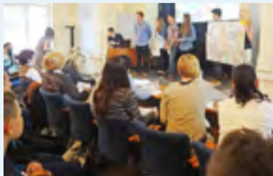
O SÍTÍCH. Žáci ZŠ Pěší se zúčastnili preventivního projektu.