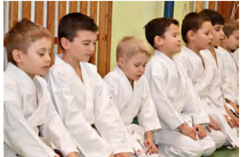
SOUSTŘEDĚNÍ. Malí bojovníci před tréninkem.