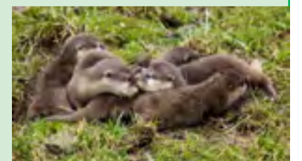
VYDŘATA. Pět nových mláďat.

Na statku v ostravské zoologické zahradě se opět narodila nová mláďata. Dne 12. února přišlo na svět mládě samičky nejmenšího plemene domácího skotu. „Jedná se o druhé mládě zakrslého plemene tura domácího dahome narozené v ostravské ZOO. Samička se s mámou zdržuje ve vnitřní stáji expozice Na statku, ve které ji mohou návštěvníci vidět. Rozmnožil se také pár vyder mlých. Ve vrhu bylo pět mláďat, dvě samičky a tři samečci. Celá rodina tak aktuálně čítá dvanáct členů.“