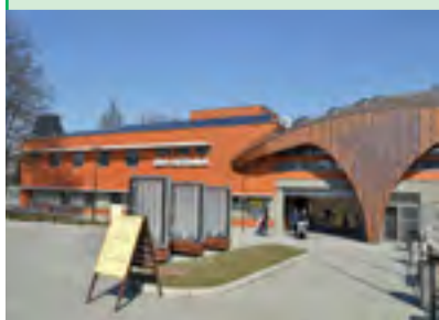
VSTUPNÍ AREÁL. Do ZOO novým vchodem.

Návštěvníky ZOO však nyní čekají problémy s parkováním. Začala totiž celková přestavba hlavního parkoviště. „Prosíme proto, aby motoristé s touto skutečností