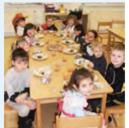
KARNEVAL. Děti jako piráti, klauni, nebo princezny.