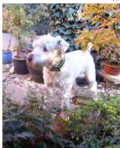
OMAR. Teriér, který má své stránky i na Facebooku: Omar Junior Kni-York.

skařů příliš nechápal. Teď jsem ale musel vše zcela přehodnotit. Pejsek se jmenuje Omar, je to irský jemnosrstý pšeničný teriér a je obrovským obohacením nás všech. Plně změnil rodinné klima, stal se společníkem ženy maminky. Sám teď někdy nevím, kdo má v naší rodině vlastně navrch. Jestli jsme dříve v domě žili čtyři, tak teď je nás pět zcela legitimních a rovnocenných nájemníků. A dokonce bych řekl, že jsou někdy situace, kdy ten nejnovější nájemník je rovnocennější a má více pravomocí než ti, kteří žili v domě původně.