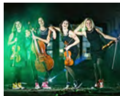
GADREW WAY. Již brzy ve slezskoostravské radnici.

11.30 až 12.30 hodin), a v sobotu a neděli od 10.00 do 16.00 hodin. Bližší informace na 594 410 426 a 599 410 081.