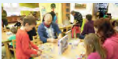
PUZZLE. Úspěšný první ročník soutěže.