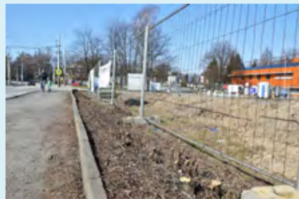
REKONSTRUKCE. Rozsáhlé úpravy před ZOO Ostrava.