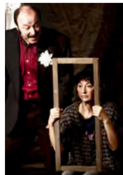
DIVADLO SILESIA. Snímek z představení Smetišť.

MgA. Jiří Vobecký, umělecký šéf Divadla Silesia