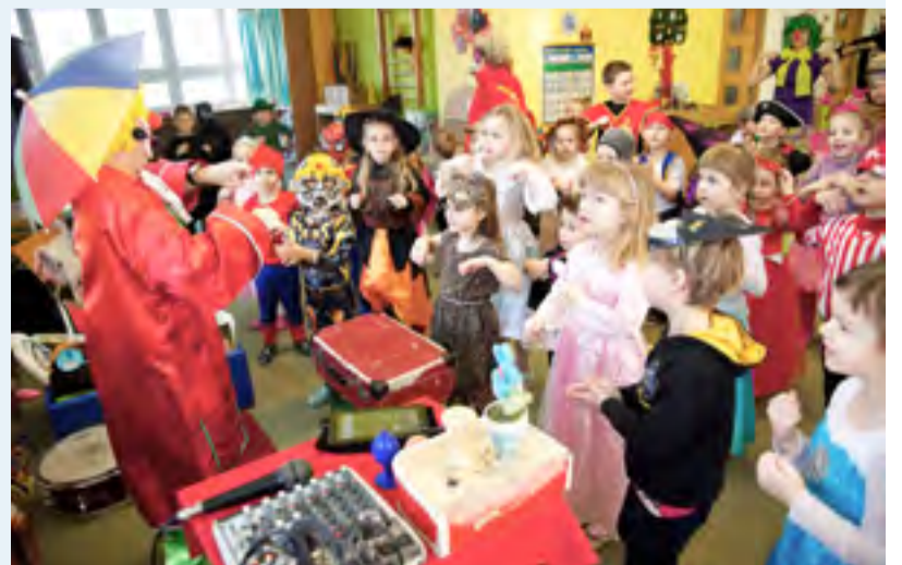
KLAUN A DĚTI. Pohádková zábava na Komerční.