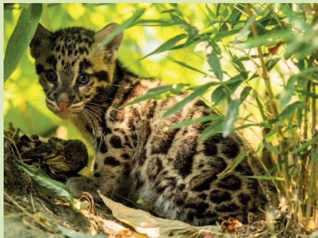
PARDÁLOVÉ. Už šest mláďat vzácných šelem odchovála Zoo Ostrava.

Pardál obláčkový obývá horské i nížinné lesy jižní a jihovýchodní Asie. Na celém území jeho výskytu dochází k nejrychlejšímu odlesňování na Zemi (přes 10 procent plochy za posledních 10 let). Kromě ztráty přirozeného prostředí ohrožuje tuto nejmenší velkou kočku nelegální lov a obchod s kožešinou a kostmi. Počty v přírodě jsou odhadovány na 10 000 jedinců. Na celém světě je chováno pouze asi 150 zvířat. V Zoo Ostrava je chována od roku 2010 a doposud se zde podařilo úspěšně odchovat čtyři mláďata. S těmito samečkami to bude celkem šest.