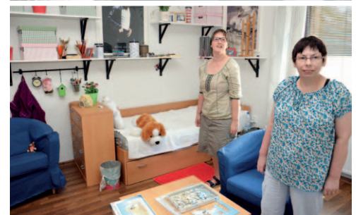
BRONZOVÁ. Klientky Čtyřlístku v nových prostorách.