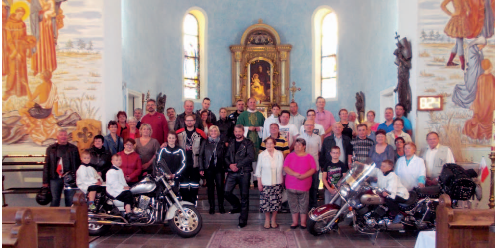
SVATÝ KRYŠTOF. Motoristé v kostele v Kunčičkách.