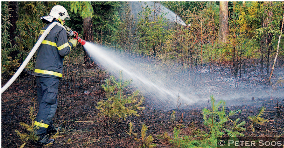
POŽÁR. Hasiči z Heřmanic zasahovali v Mikolajicích.