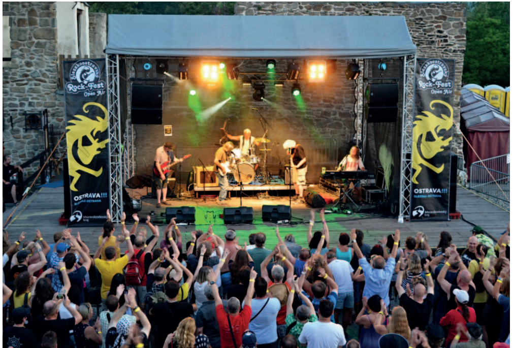
ROCK-FEST. Rockeři obsadili Slezskoostravský hrad.