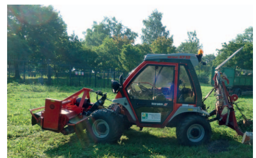
PO BOUŘI. Pracovníci Technických služeb káceli poškozené stromy.

Havarijní kácení museli provést na ulicích Najmanská (kaštan), Na Vizině (vrby, jívky), Bernerova (vrby, jívky) a na Ústředním hřbitově (břízy, slivoň). Dále pak byly nutné i orezy dřevin, u kterých hrozil pád. A to u Mostu Pionýrů (vrba), U Vrbin (bříza) a v ulici Na Vizině (vrba, jívka).