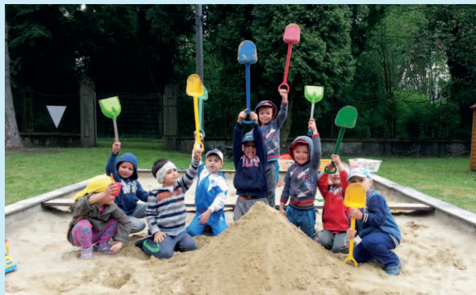
NÁSTUPNÍ!. Děti se v mateřské škole nenudí.

Děti z MŠ Nástupní v Kunčičkách navázaly nová přátelství s dětmi z místní charity. Měly možnost se seznámit na společných akcích, které jim připravili učitelé a asistentky. Vydařila se návštěva ZOO i sportovní dopoledne ke Dni dětí. Odměnou jim byly nejen sladkosti, ale i medaile a diplomy, které si děti právem zasloužily. Musíme rovněž připomenout, že děti z naší MŠ měly úspěch také na ve-