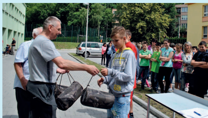
CVIČENÍ. Příprava žáků na mimořádné situace.

Naše základní škola tradičně na konci školního roku pořádá cvičení žáků v rámci učiva ochrana obyvatelstva za mimořádných událostí.