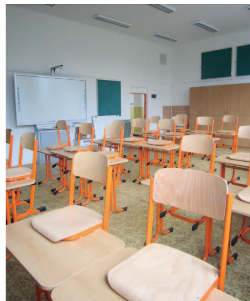
MODERNIZACE. Nově vybavená učebna v ZŠ Škrobálkova.

Projekt je spolufinancován z Regionálního operačního programu NUTS II Moravskoslezsko 2007-2013. Městský obvod obdrží dotaci ve výši 85 % celkových způsobilých výdajů projektu, max. v celkové výši 3 592 092,12 Kč.