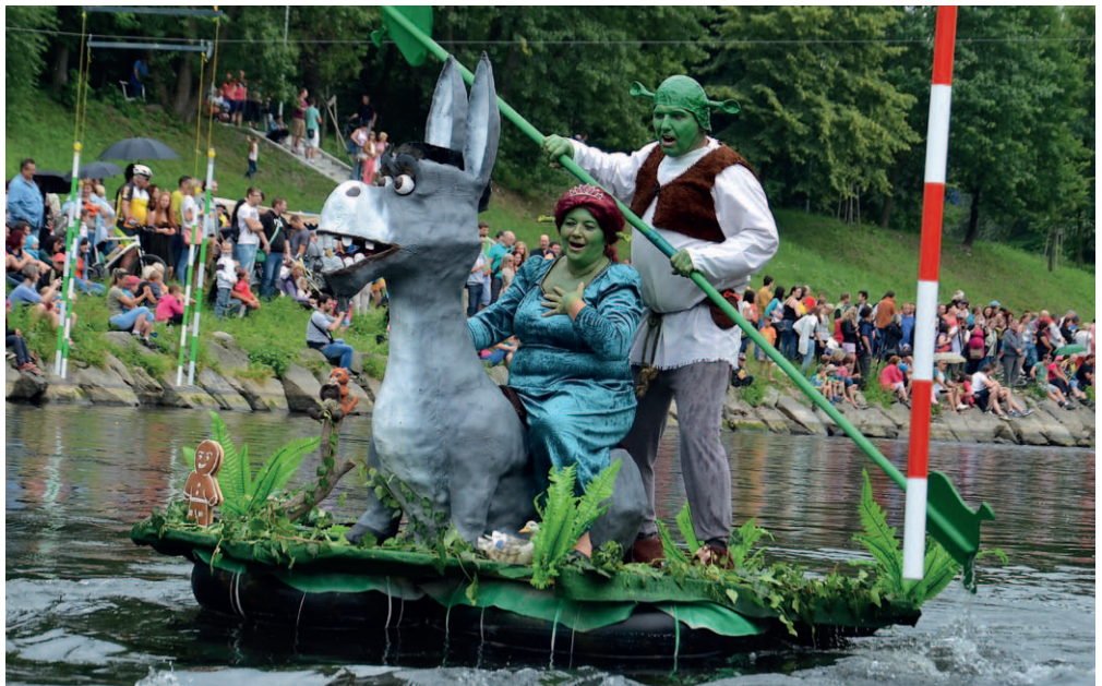
U OSTRAVICE. Netradiční plavidla, hudba, tanec i veliká světelná show. Takto vypadaly Rozmarné oslavy Ostravice.