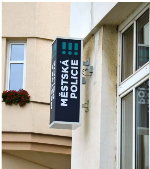
NÁMĚSTÍ J. GAGARINA: Nové kontaktní místo je také v budově úřadu.

út 09.00 - 10.00 hod., čt 15.00 do 16.00 hod.