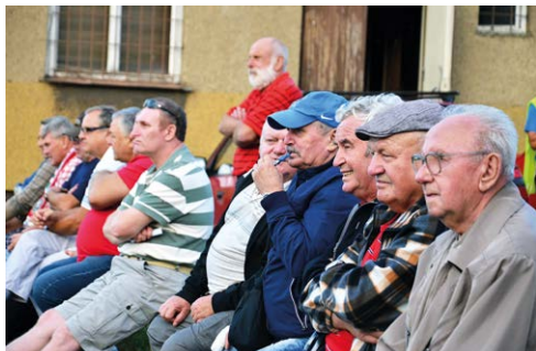
FANOUŠCI. Věrní diváci na heřmanickém stadionu.

Pokud jde o podmínky, pak z šestnácti mužstev z přeboru jsme někde mezi 10. a 16. místem. Potřebovali bychom vybudovat nové zázemí, to současně je už hodně zastaralé, ale peníze na provoz nám vystačí tak akorát. V dobrém stavu máme hřiště. S jeho kvalitou jsme určitě v horní půlce tabulky. Zavedli jsme zavlažování trávníku, se kterým nám