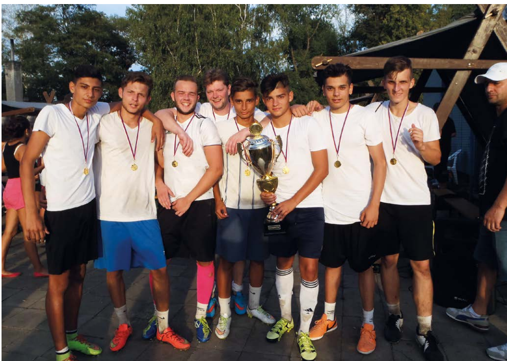
VÍTĚZNÝ TÝM. V opravovaném areálu TJ Kunčičky se bojovalo o pohár.