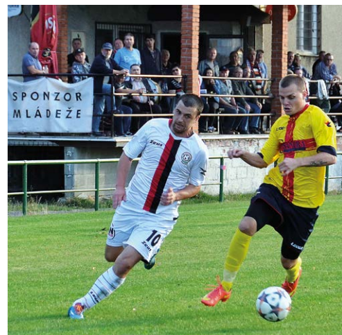
ZÁPAS. Heřmanice /v bílém/ tentokrát Vendryně neporazily.

Kontakt pro zájemce o mládežnický fotbal v FC Heřmanice Slezská: +420 736 425 616