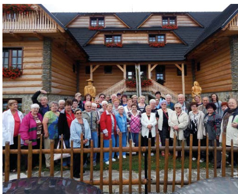
V TATRÁCH. Senioři na zájezdě ve slovenských velehorách.

Městský obvod Slezská Ostrava, úřad městského obvodu, odbor sociálních věcí uspořádal pro seniory z Domů s pečovatelskou službou na ul. Hladnovská, ul. Heřmanická a klubů důchodců třídní zájezd do Západních Tater.