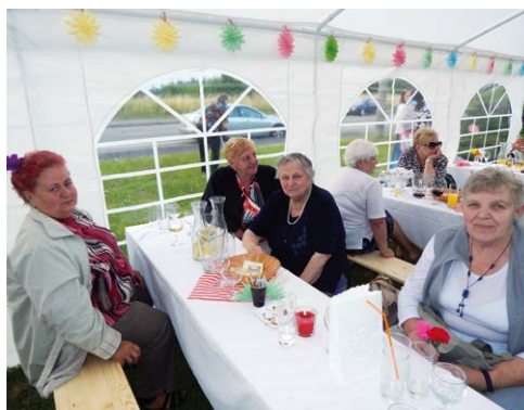
SLAVNOST. Senioři se bavili v areálu KD Muglinov.