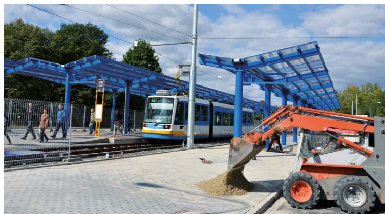
HRANEČNÍK. Ve Slezské Ostravě vzniká moderní přestupní terminál.

Nový terminál Hranečnick představuje především podstatně větší komfort pro cestující než na dnešních zastávkách Nám. J. Gagarina, ÚAN nebo Hranečnicku (plně krytý přestup mezi spoji do 10 metrů, uzavřená čekárna, občerstvení, WC). Bezpečnost je zajištěna kamerovým systémem.