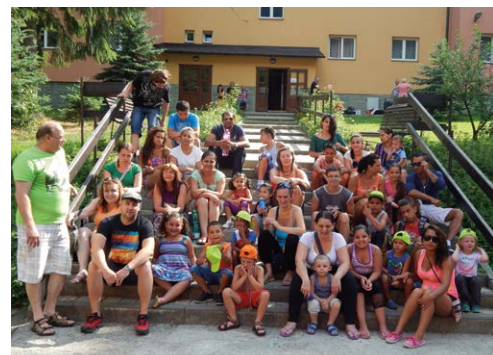
VZDĚLÁVACÍ SEMINÁŘE. Již od měsíce června se ve Slezské Ostravě konal projekt podpořený statutárním městem Ostrava.