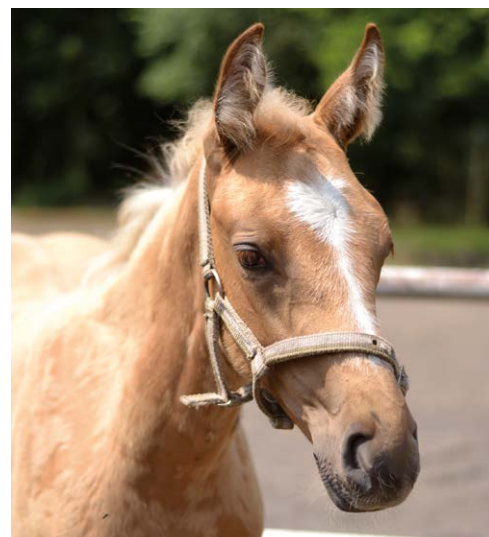
JAK POJMENOVAT? Vymyslete jméno ...

Vítězné vybrané jméno bude uveřejněno v této rubrice a autor odměněn poukazem na jízdu v sedle.