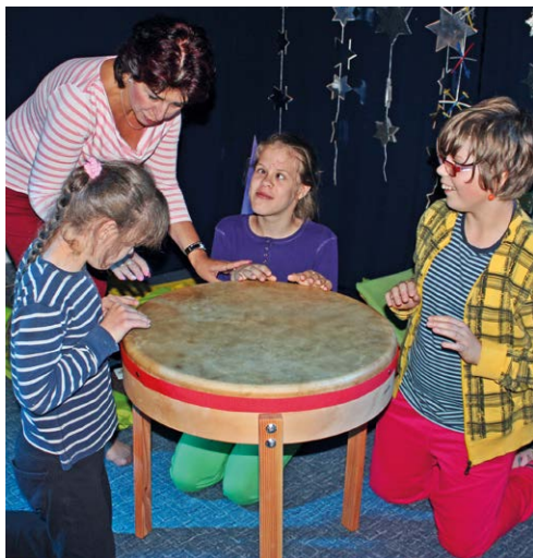
MUZIKOTERAPIE. Děti v ZŠ Těšínská.

Handicapované děti z Ostravska si budou moci v novém školním roce užívat muzikoterapii ve speciální smyslové místnosti.