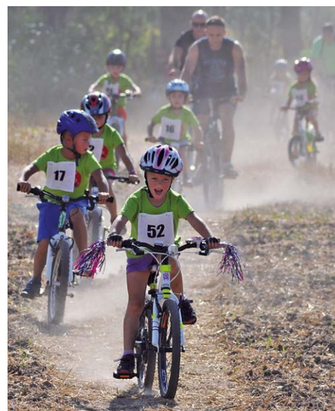
CYKLISTI. Více jak osmdesát přihlášených dětí zdárně ukončilo závod.