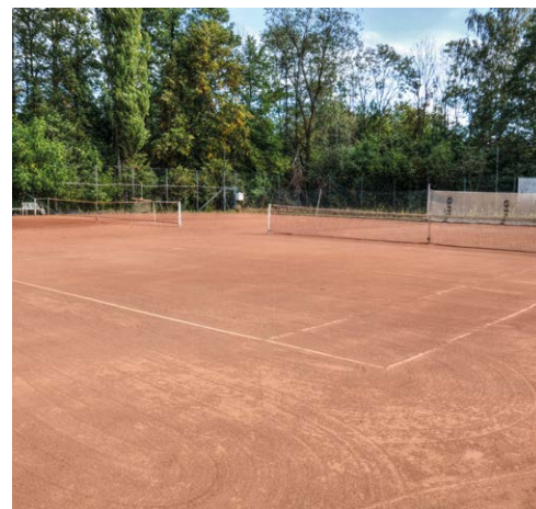
NA TENIS. Hřiště v areálu TJ Kunčičky.