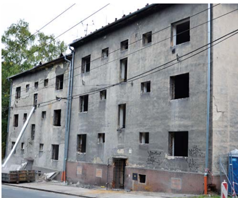
PROMĚNA. Z dříve bytového domu vzniká komunitní dům pro seniory.

Stavební práce byly zahájeny 31.8.2015 a v současné době jsou dokončeny bourací práce a probíhají úpravy vnitřních prostor.