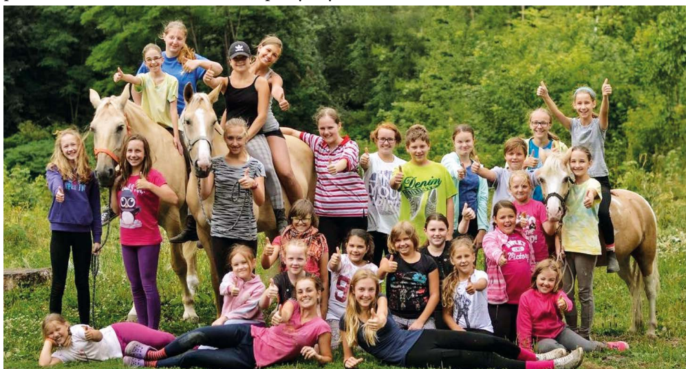
SK MUŠKETÝR. Šťastné prázdniny u koní ve Slezské Ostravě.