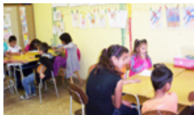
PROJEKT. Cesta k úspěchu v základní škole Škrobálkova.