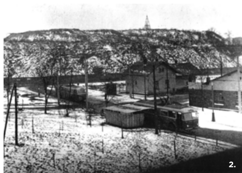
2. Rozvoj průmyslu na Ostravsku ke konci 19. století přitáhl do Ostravsko-karvinské pánve množství nových pracovních sil. Pracovníci dolů a hutí, bydlící v širokém okolí, se potřebovali rychle a levně dostat do svých podniků. Přijatelné východisko z problému nabízela výstavba dopravní sítě úzkorozchodných tramvajových tratí. Tento nový systém obslužné komunikace byl od prvo počátků provázen ostrým konkurenčním bojem, neboť provoz sliboval rychlé zúročení vloženého kapitálu. Na úzkorozchodných tratích se počítalo jak s přepravou osob, tak také s dopravou nákladní, a jelikož byla lukrativnější, podnikatelé ji upřednostňovali.