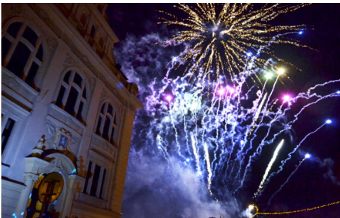
2015! Vítání nového roku ve Slezské Ostravě.