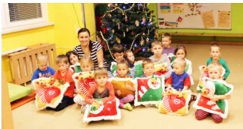
NÁSTUPNÍ. V mateřské škole v Kunčičkách se rozdávala radost i potěšení. FOTO/ARCHIV