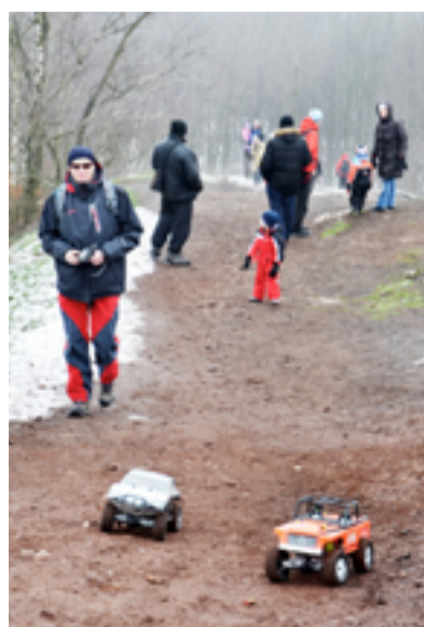
NOVÝ ROK 2015. Celé rodiny stoupaly 1. ledna na nejvyšší vrchol Slezské Ostravy.

vyznamenán za zásluhy o stát. Klub českých turistů eviduje i nejmladšího účastníka novoročního výšlapu. Tím byla letos ještě ani ne tříměsíční holčička, kterou její rodiče dopravili na Emu v kočárku.