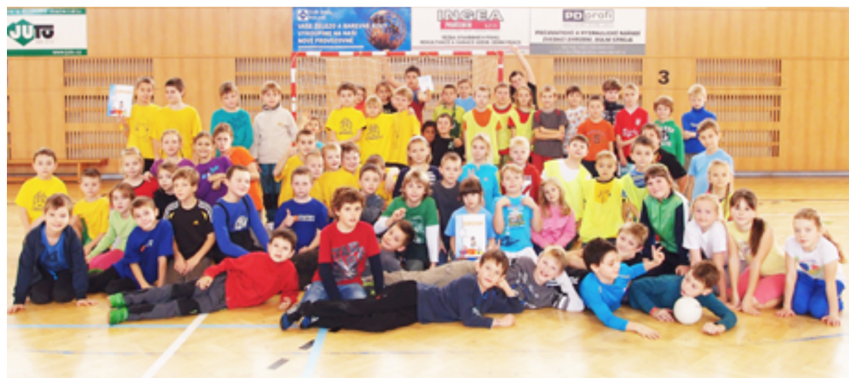
VÍTĚZOVÉ. Žáci ZŠ Chrustova úspěšní v miniházené.