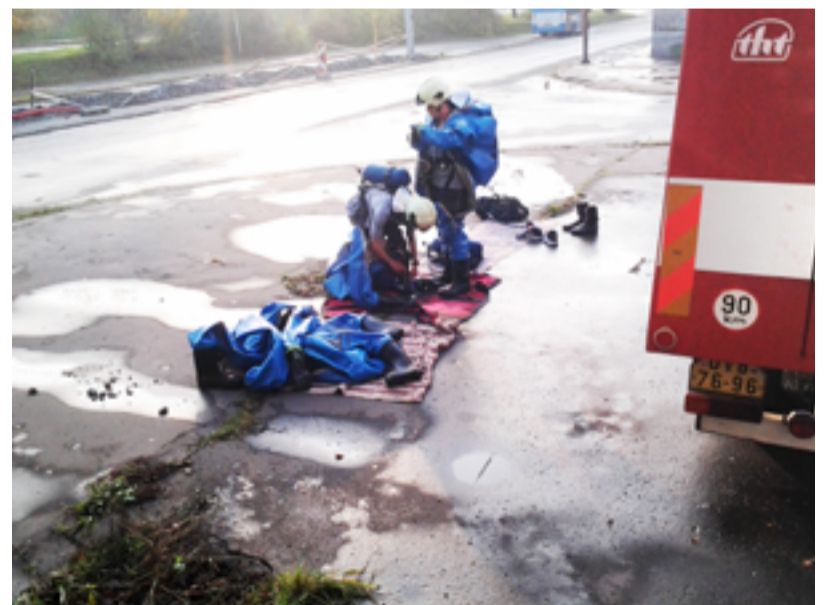
VÝCVIK. Heřmaničtí hasiči cvičili v areálu bývalého dolu.

Petr Kos, Jednotka sboru dobrovolných hasičů Ostrava-Heřmanice