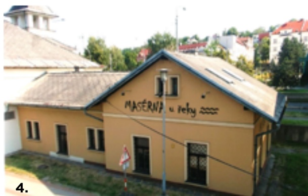
4. V bezprostřední blízkosti Ostravice se pak nachází dosud zachovalý objekt, který byl v minulosti staniční budovou Místní dráhy. Na nezregulovaném břehu řeky vedla úzkorozchodná trať ve směru na Hrušov, po prodloužení trať pokračovala od staniční budovy pod oblouk Říšského mostu na Zárubek. /4/ Bývalá staniční budova, která je dnes označena jako „Maserna u řeky“, je historicky zajímavá tím, že se v ní 28. října 1911 sešla odborná komise, která zde sepsala závěrečný protokol o konání a průběhu technicko-policejních zkoušek, uskutečněných na Místní dráze v úseku Polská Ostrava – Hrušov po přestavbě na elektrický pohon. Obsahově podobný protokol hodnotil výsledky zkušební jízdy, která byla provedena soupravou vozů z vozového parku hrušovského depa a profil tratě byl testován odstupňovanými rychlostmi až do rychlosti 25km/hod. Pro vylepšení technického zázemí byly objednány nové motorové vozy a také projednána otázka prodloužení tratě od Říšského mostu na Zárubek. Přepravní délka tratě se tak ustálila na 4, 60 kilometru. Provoz na nově elektrifikované trati byl zahájen 1. listopadu 1911 a přinesl občanům slezské části Ostravy značné dopravní zlepšení. Do užívání byly dány zastávky – Hrušov – Severní dráha, Hrušov – stanice, Muglínov, Říšský most, Městský sad /Stará střelnice/, Zárubek. Pro bezproblémovou orientaci byly nápisy na budovách, zastávkách a v dopravních prostředcích uváděny dvojjazyčně – německy a česky. Traduje se, že přistěhovalci z polské Haliče, kteří přišli do Ostravy za prací, se překvapeně zastavovali a tvořili hloučky, když kolem nich projela řinčící „lokálka“ a tento technický „zázrak“ komentovali po svém: „Cuż to psiakrew za mašina, bez damfu i bez komina a jak smaruje tak smaruje tyłko s kolečkem i prentikem po drutiku upaluje do Bogumina“.

5. Provoz na elektrické trati Hrušov – továrna na sodu, Polská Ostrava, Zárubek, byl spravován ředitelstvím Místní dráhy Ostrava – Karviná a trval do 1. července 1914. Od 30. června 1914 přešly všechny náležitosti novému