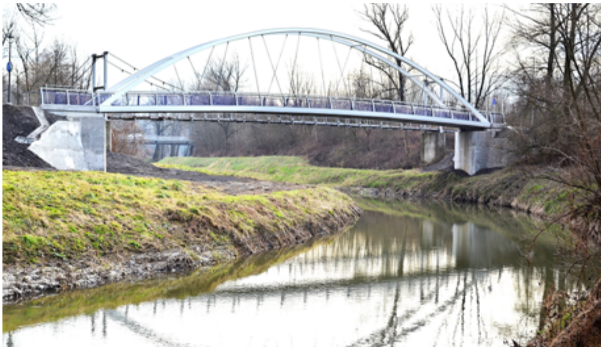
LÁVKA. Nová cesta pro pěší a cyklisty přes Lučinu.