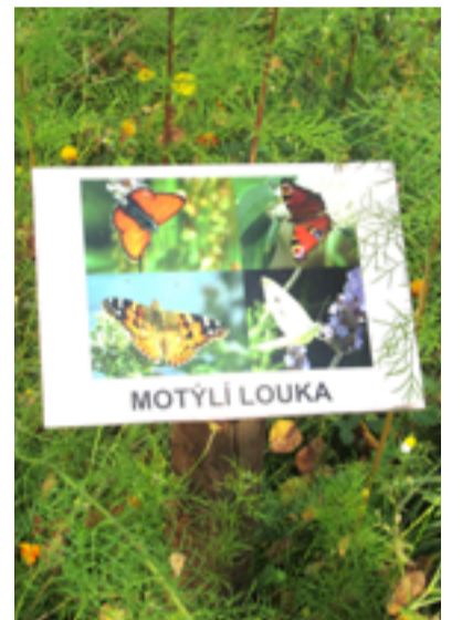
PŘÍRODA. Motýlí louka v zahradě mateřské školy.

Jsmo velice rádi, že se nám podařilo vytvořit podnětné prostředí školní zahrady umožňující dětem nejen aktivní hry, ale i pozorování a získávání nových poznatků v oblasti environmentální výchovy. Projekt „Hrajeme si v přírodě“ byl