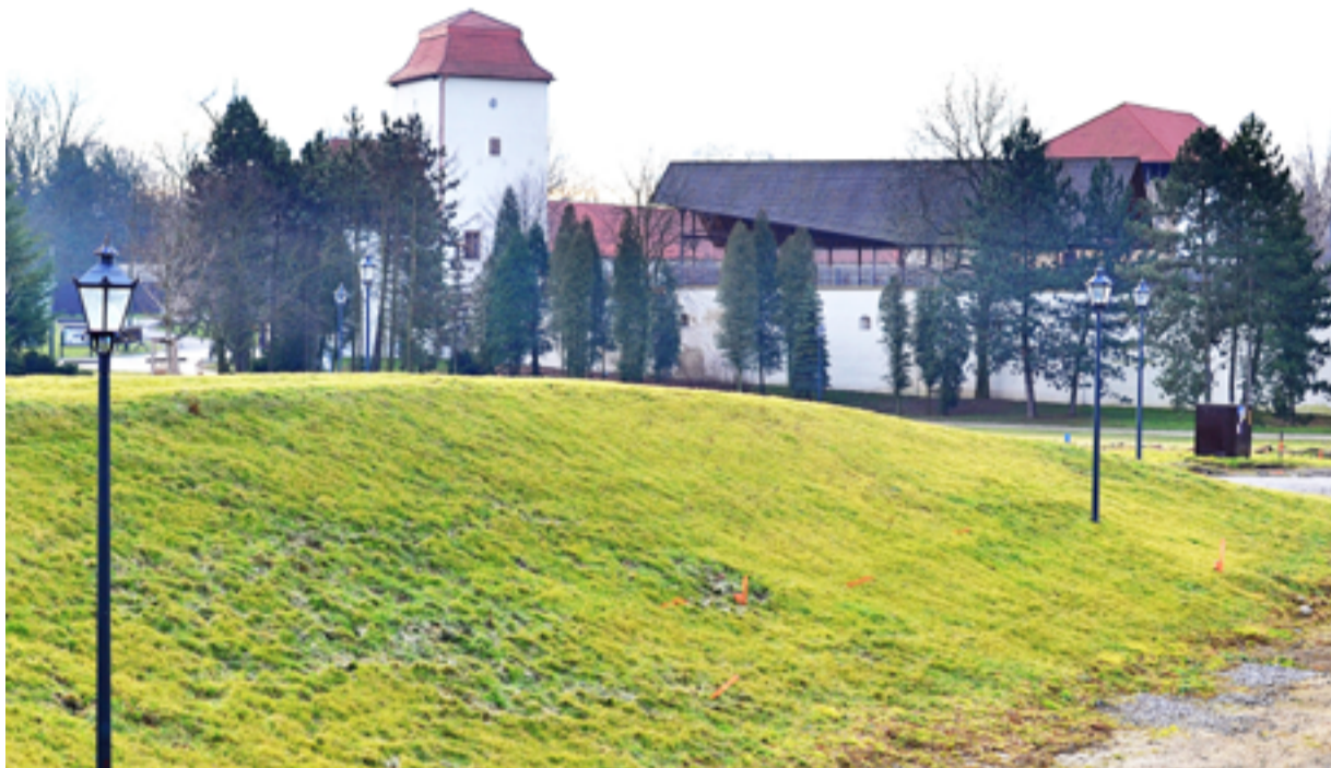
AMFITEÁTR. Přírodní valy u hradu.