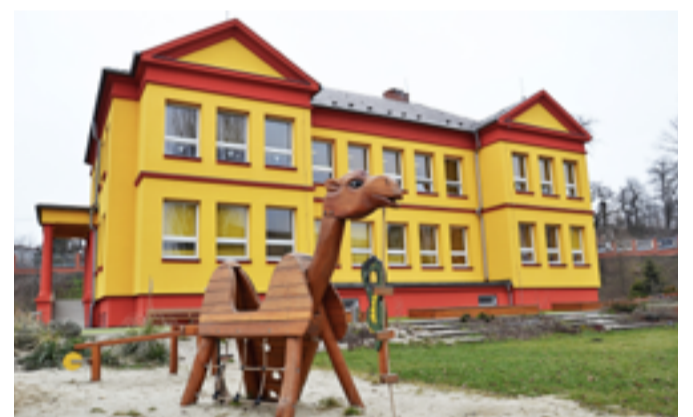
MŠ ZÁMĚSTNÍ. Nový plot, okna i zateplení.

V současné době zjišťujeme názory obyvatel k projektům. Svě podněty pošlete na: ismidakova@slezska.cz . Do příštích čísel chystáme články s využitím názorů místních obyvatel.