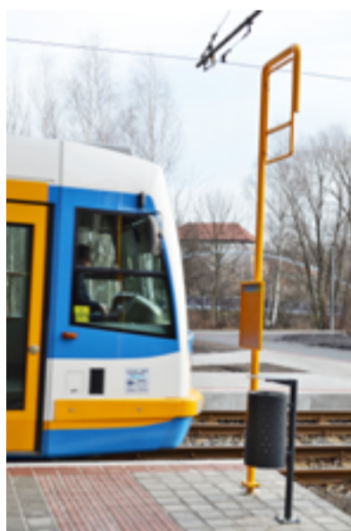
U HRADU. Nová tramvajová zastávka.