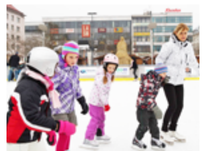
BRUSLAŘI. Nejmenší vyrazili na led.