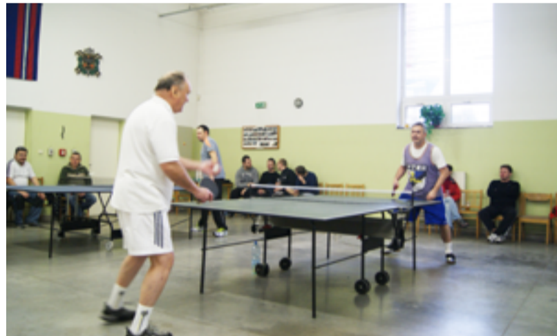
STOLNÍ TENIS. Vyrovnané souboje v antošoviccké požární zbrojnici.