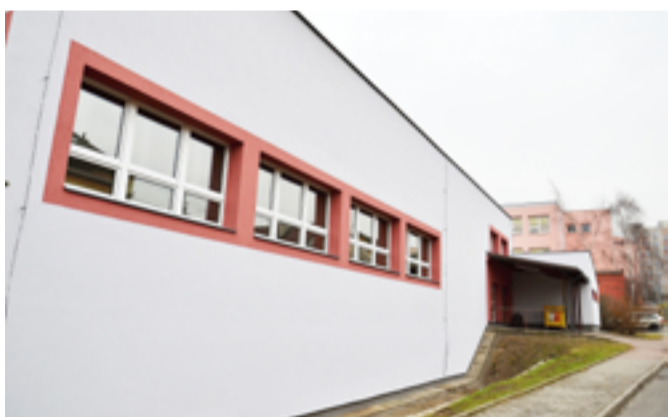
ZŠ PĚŠÍ. Zateplena tělocvična a spojovací koridor.