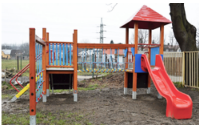
MŠ FRÝDECKÁ. Nové hrací prvky, úpravy zahrady.