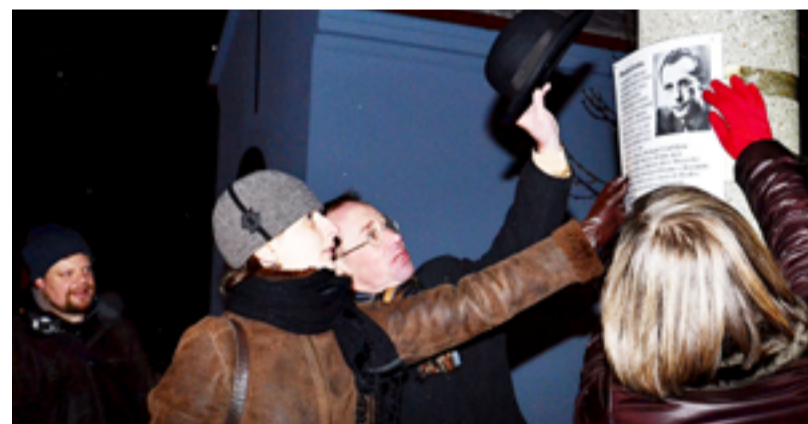
SATURNÁLIE. Okrašlovací spolek připomněl Zdeňka Jirotku.