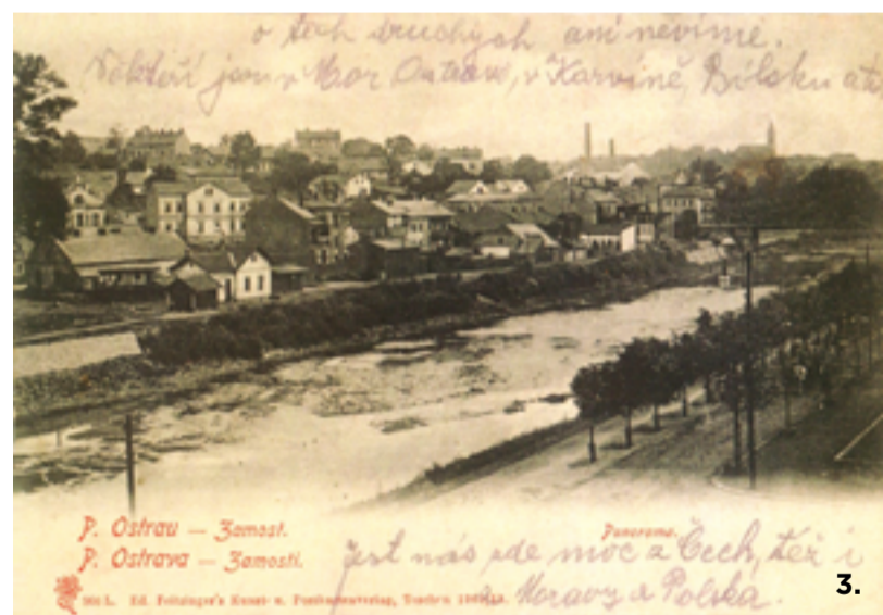
3. 4. Tato pohlednice vydaná v roce 1905 v Těšíně /L. Ed. Feitzinger Kunst-u.Postkartenverlag, Teschen 1905/ pod názvem „P.Ostrau-Zamost. P. Ostrava-Záměstí“ má poměrně značnou vypovídající hodnotu, neboť zobrazuje zástavbu Slezské Ostravy na počátku 20. století. U kraje snímku v levé části je patrný štít tzv. „staré elektrárny“ /1895/, vedle stojící patrová budova přeměněná na byty je pozůstatkem zaniklé jámy Josef /1847/. Pod nimi se nachází podlouhlý objekt, ve kterém po přestavbě vznikl v roce 1912 legendární biograf Palác /Oko/.